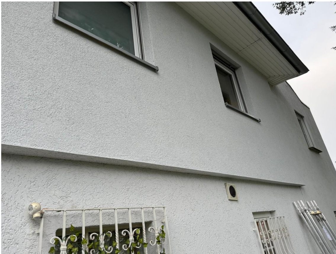
Dämmung Fassade in 2024