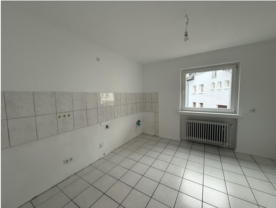
unmöbliert - Küche