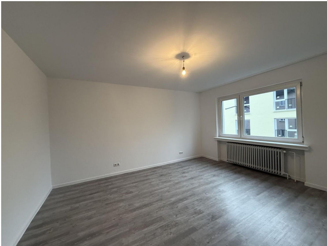
unmöbliert - Schlafzimmer