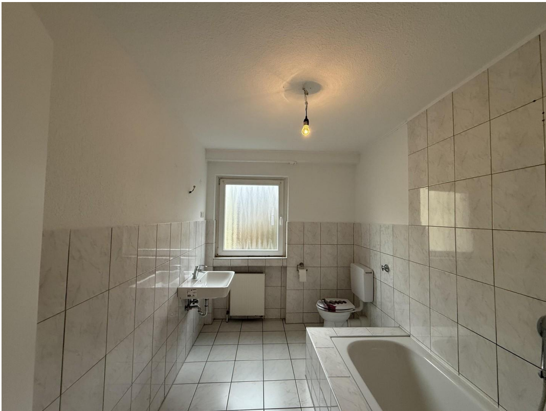
unmöbliert - Badezimmer