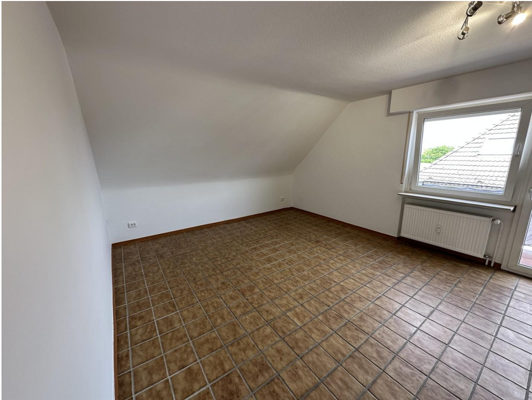
Wohnzimmer Bild nach links