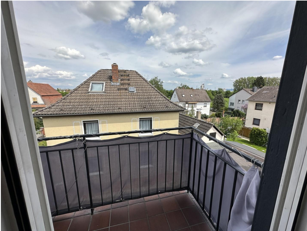
Balkon Blick Main