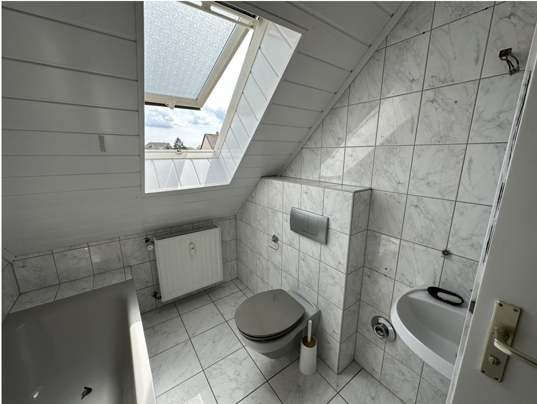
Bad/WC Bild 2