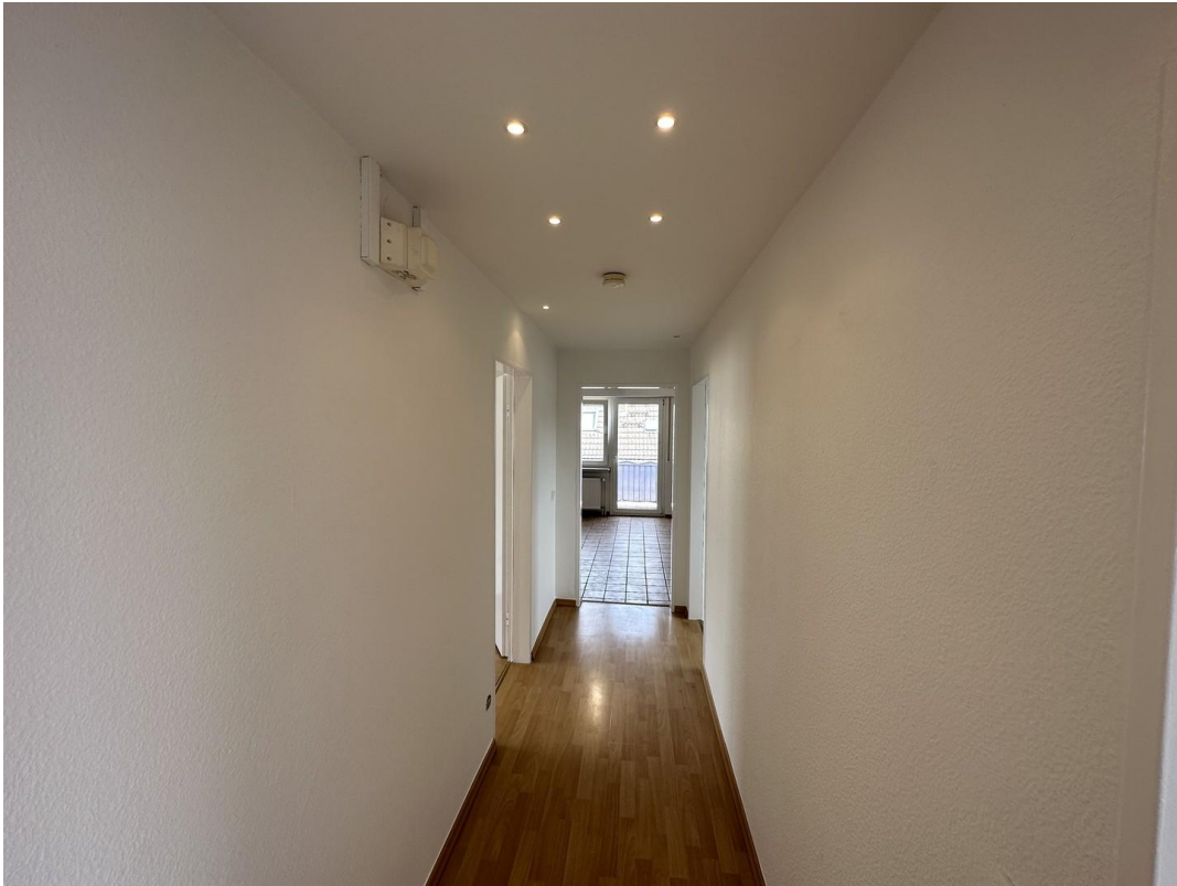
Flur Richtung Eingang