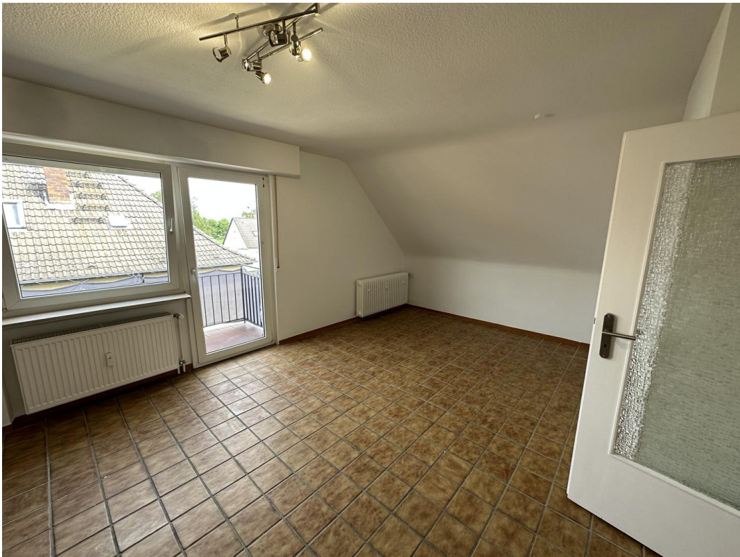
Wohnzimmer Bild nach rechts