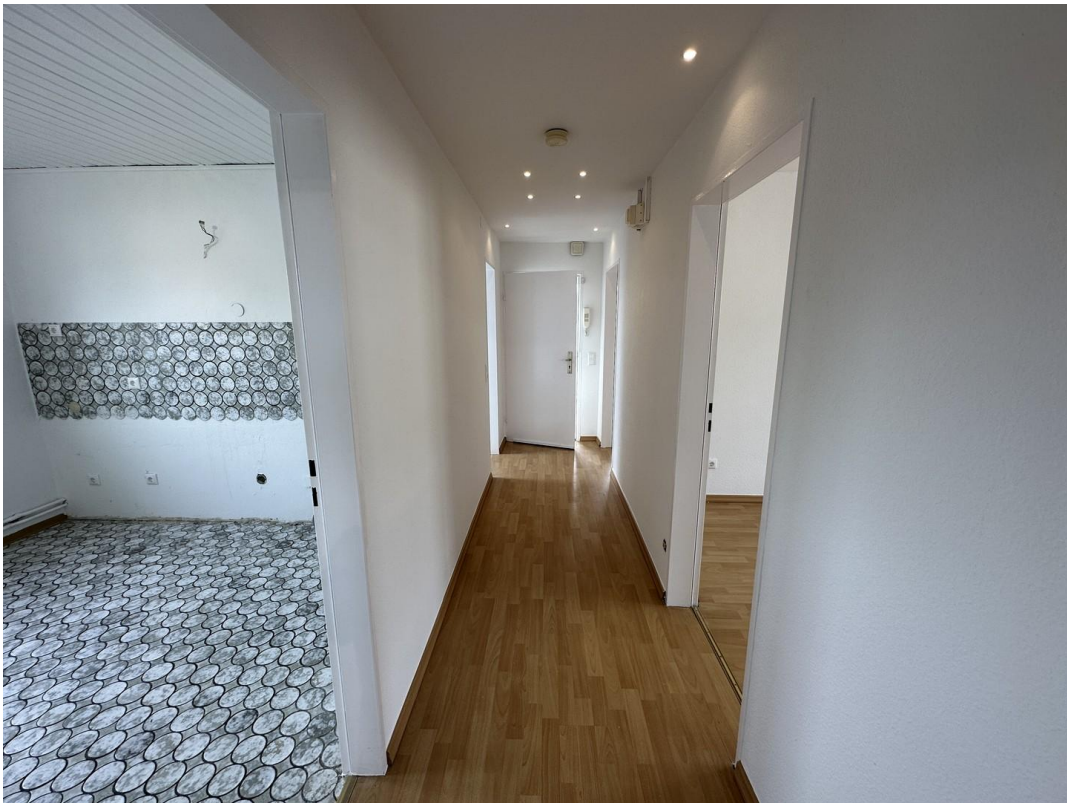
Flur Richtung Eingang