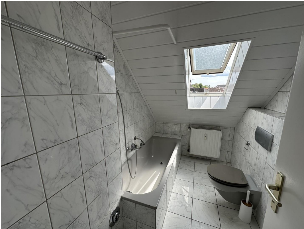
Bad/WC Bild 1