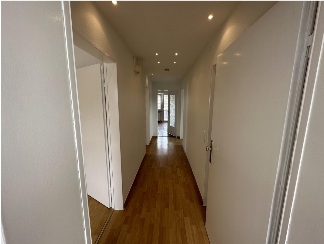
Flur Wohnung Eingang