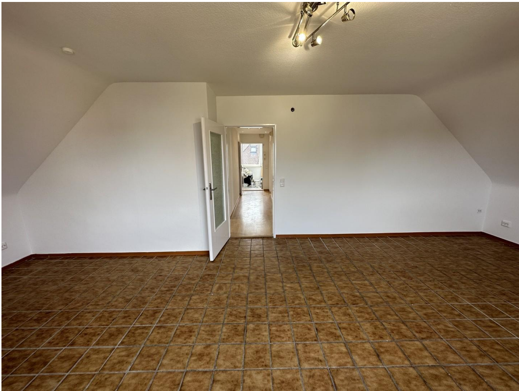
Wohnzimmer Richtung Eingang