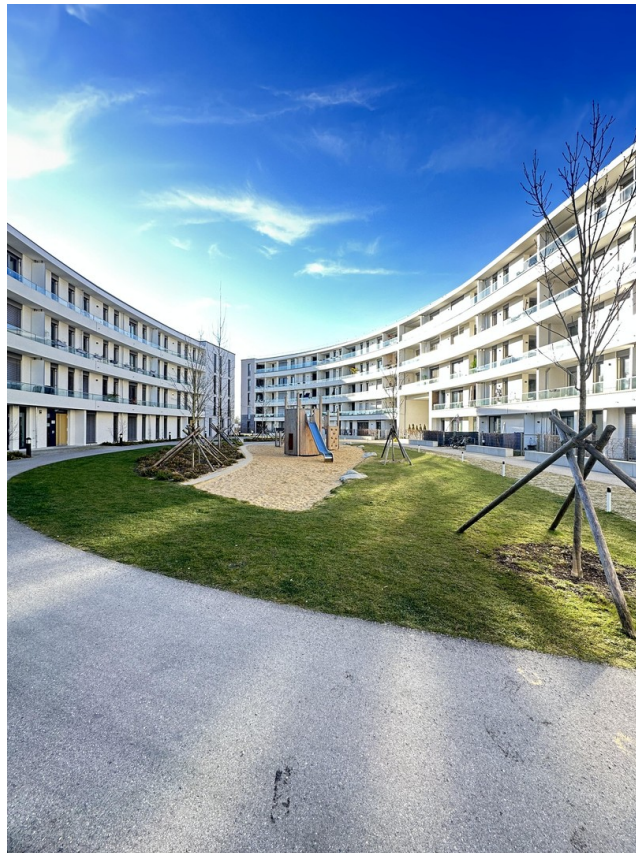
Innenhof mit Spielplatz