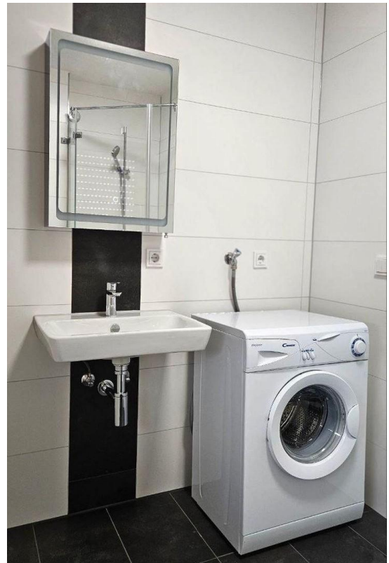
Bad inkl. Waschmaschine