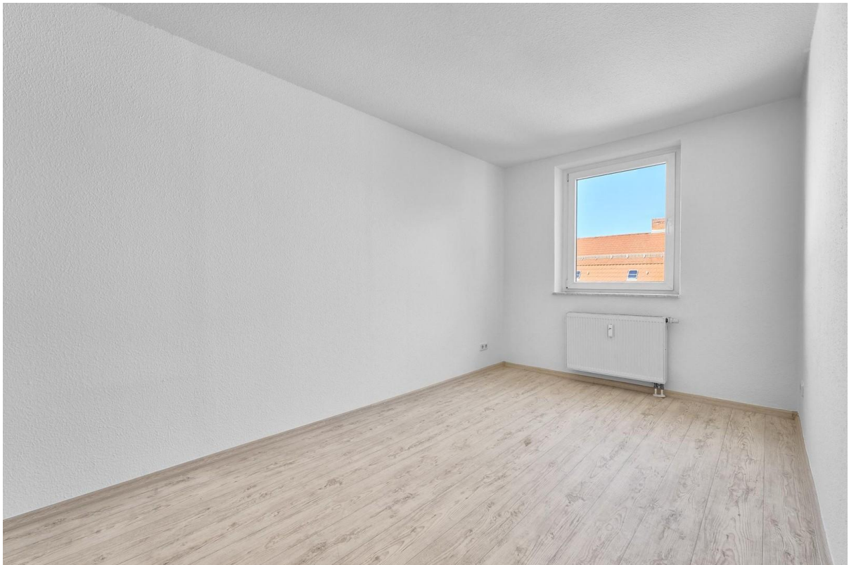
Schlafzimmer nach hinten