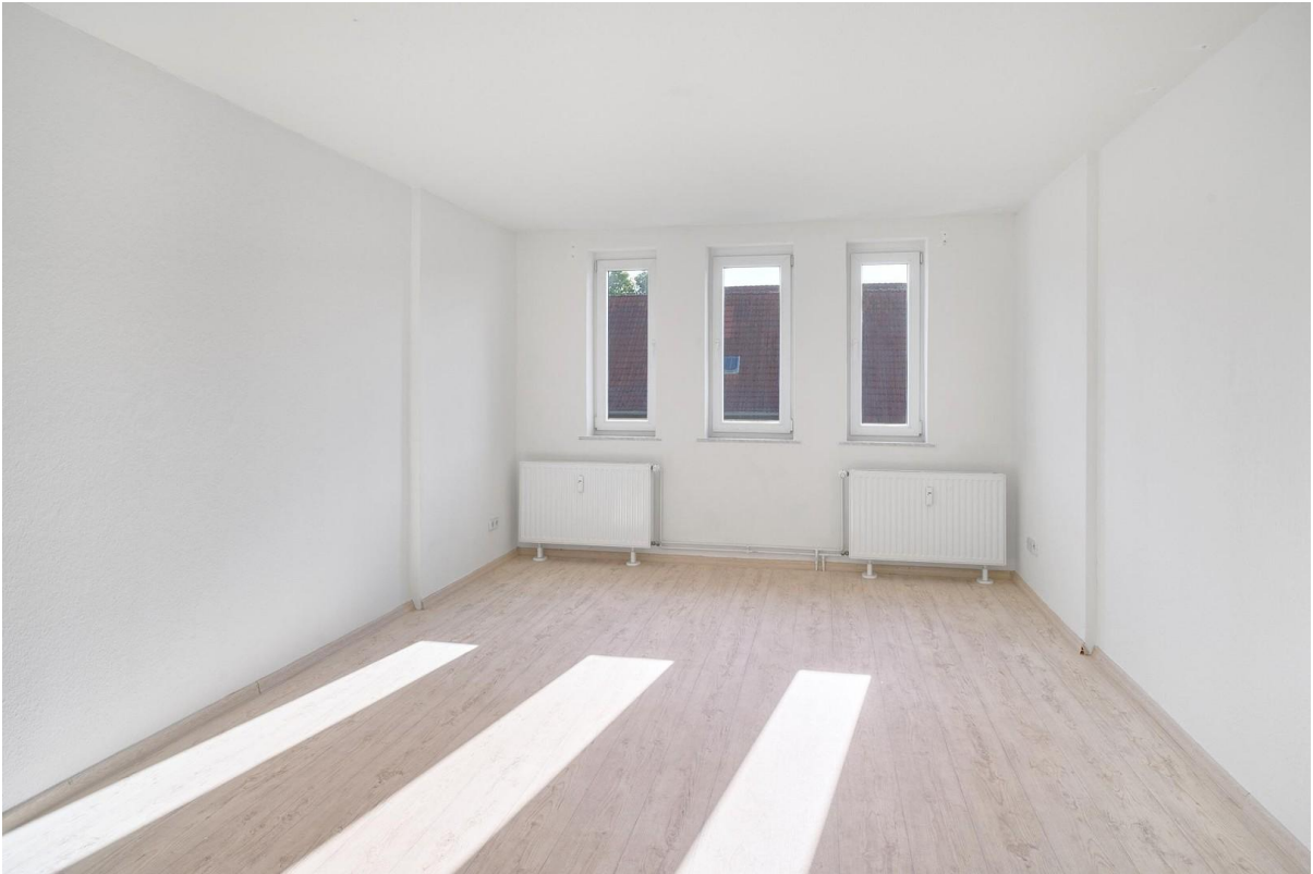
Schlafzimmer nach vorne