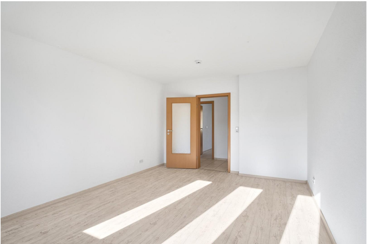
Schlafzimmer nach vorne