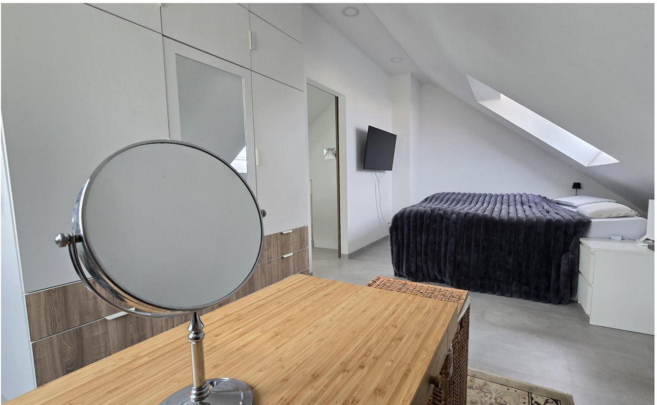
Schlafzimmer mit Schminktisch