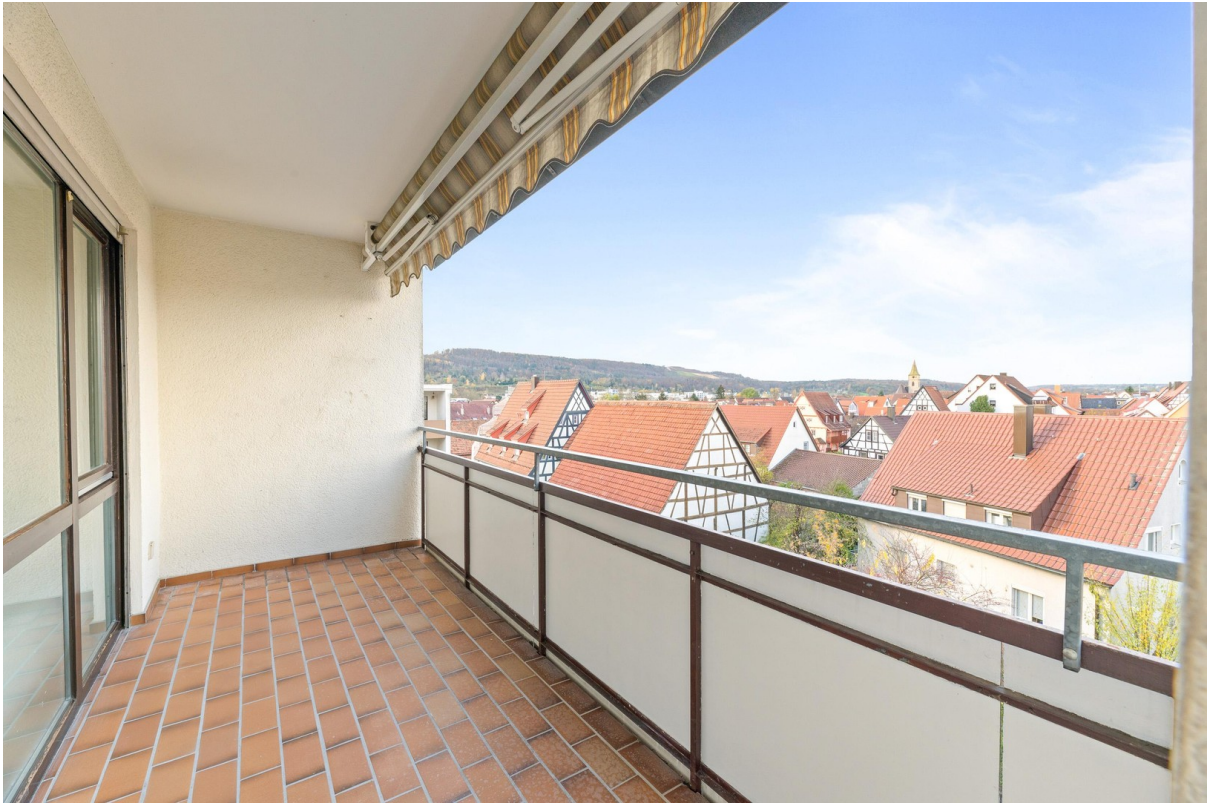
Balkon nach Westen