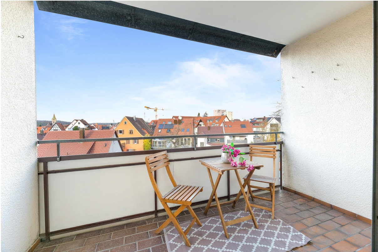
Balkon nach Westen