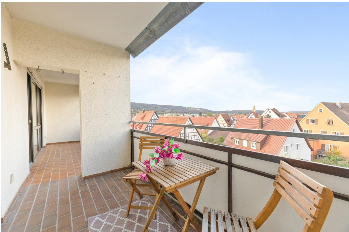
Balkon nach Westen