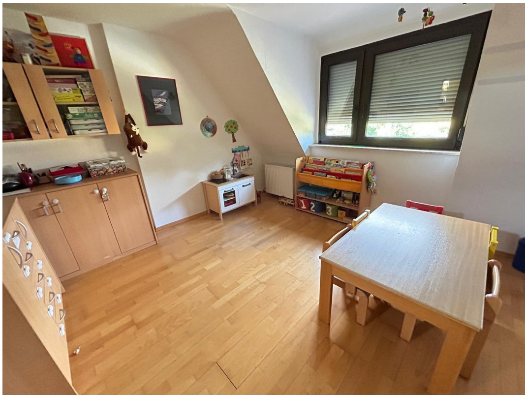
Kinderzimmer 2. OG