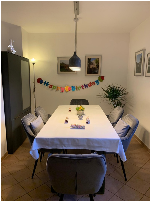
Küche Essbereich EG