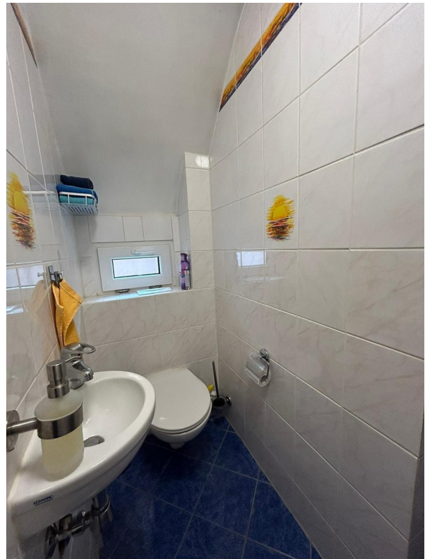
WC - Bereich Bad EG