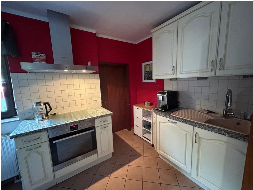
Küche Kochbereich EG