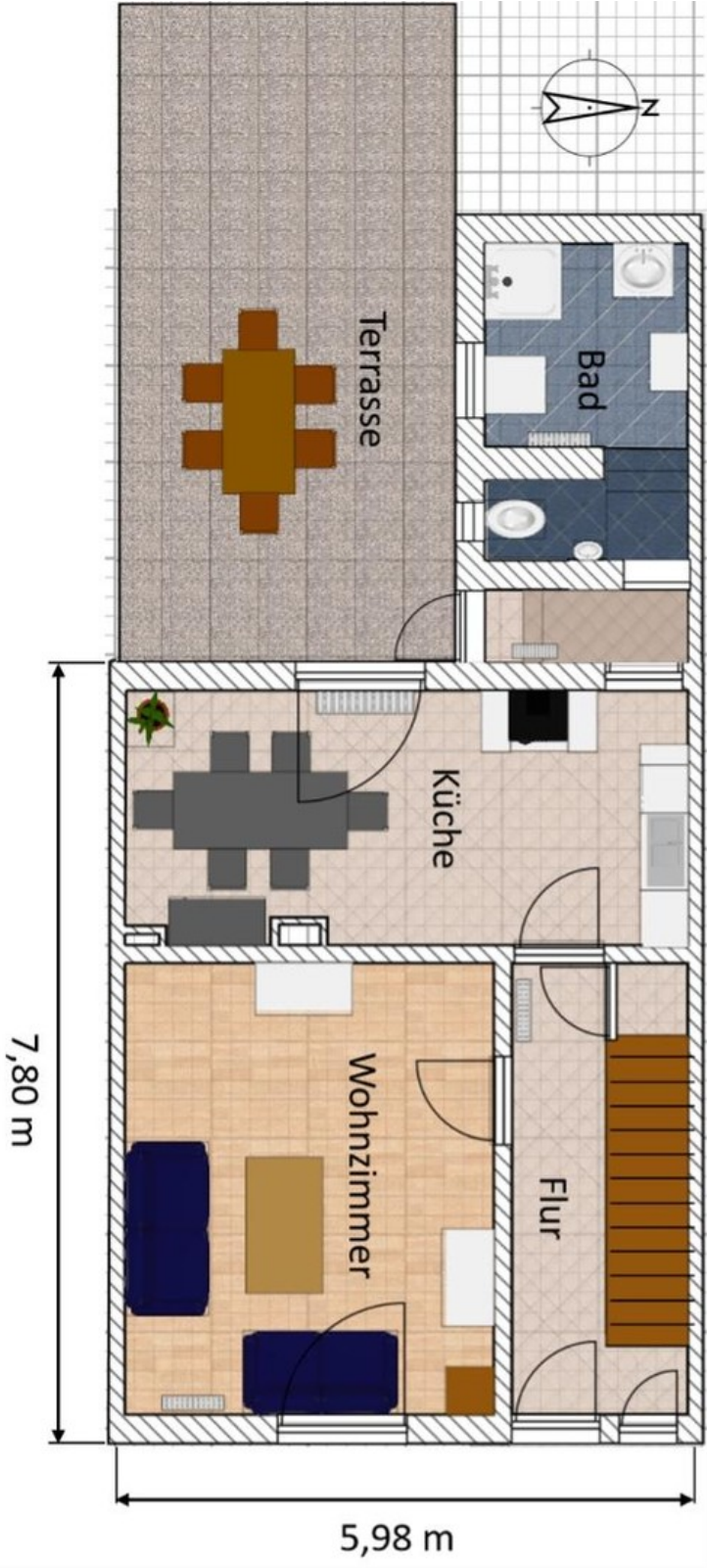
EG mit Terrasse