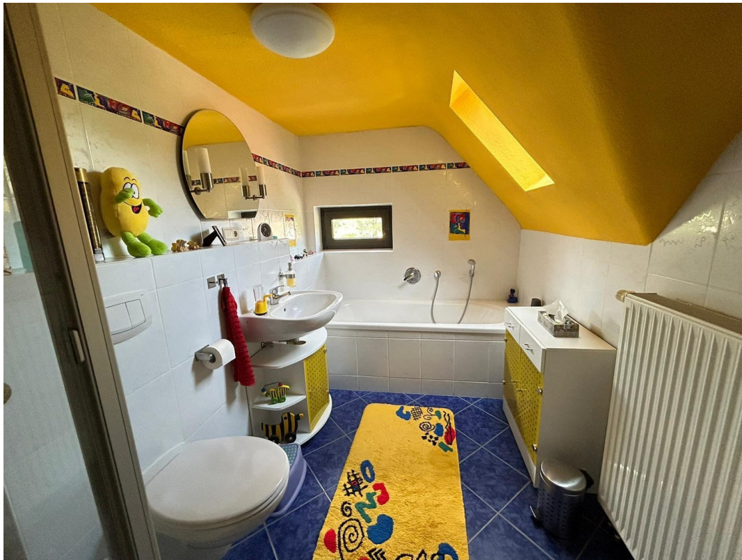
Bad 2. OG