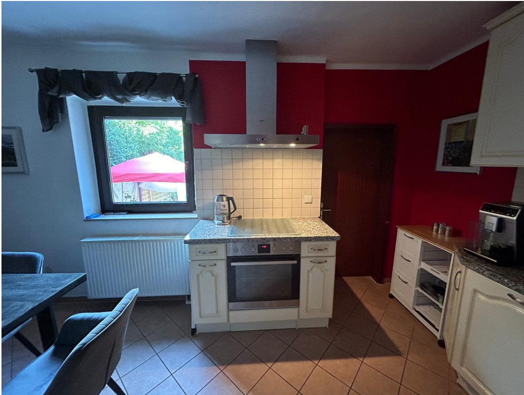
Küche Kochbereich EG