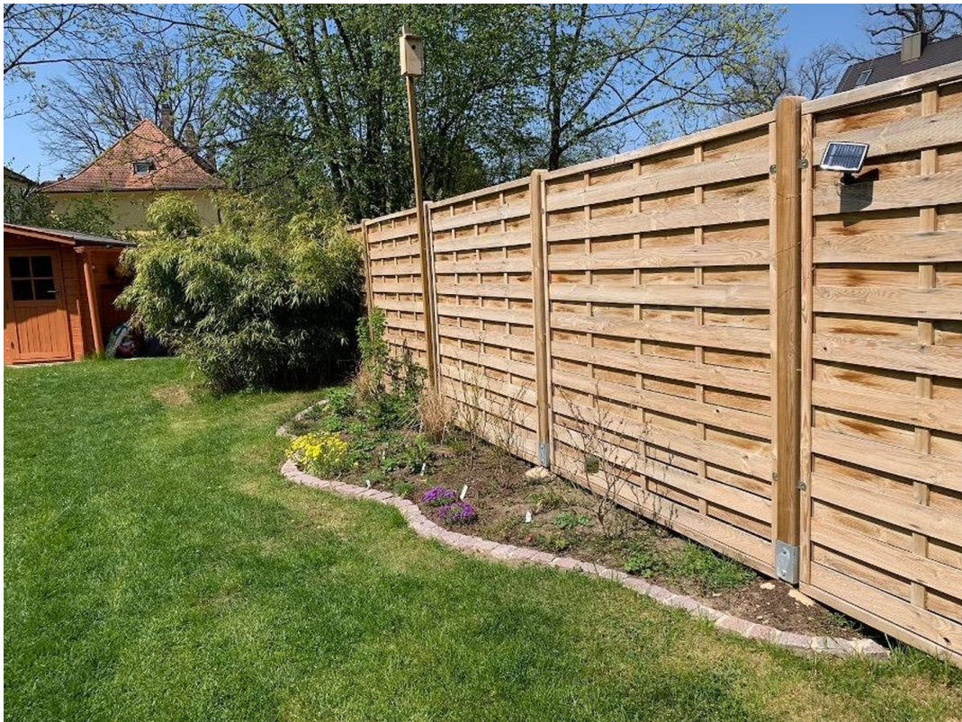
Garten mit Beet u. Sichtschutz