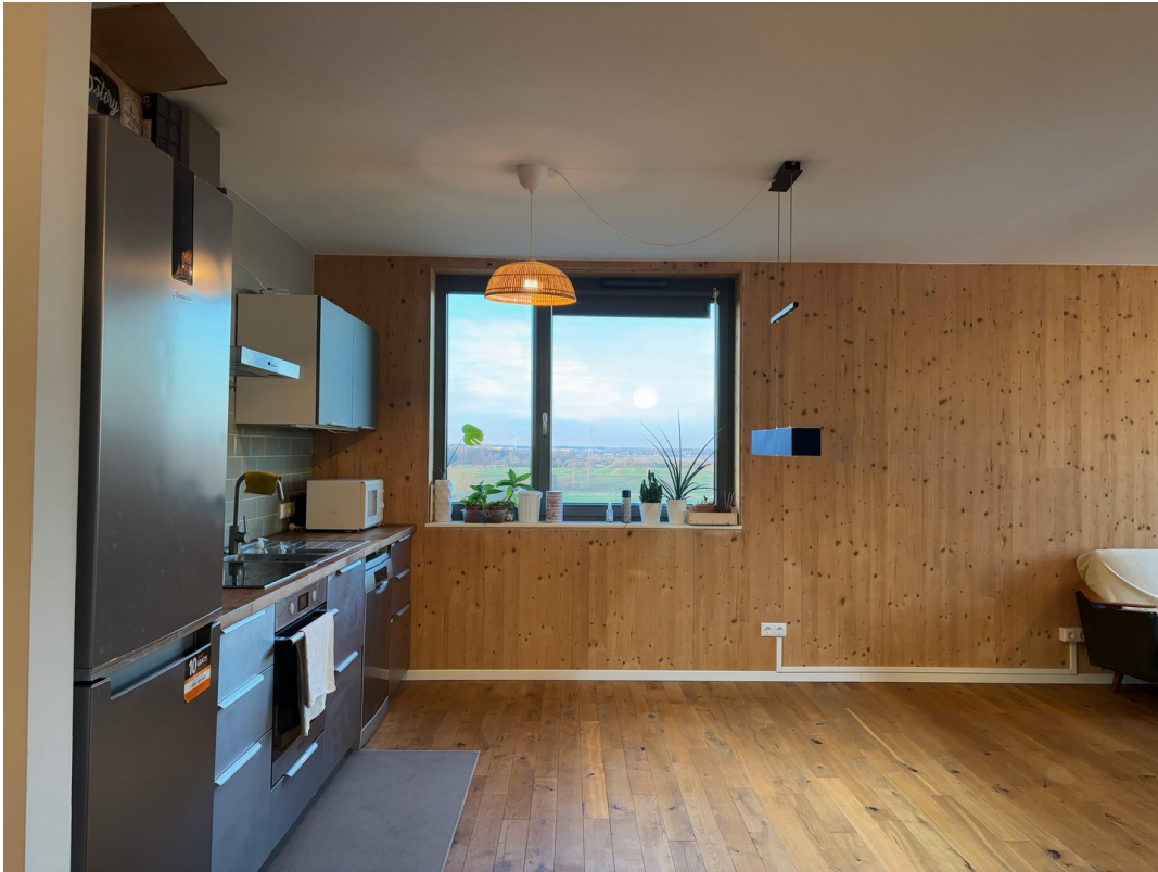
Wohnküche Bild 1