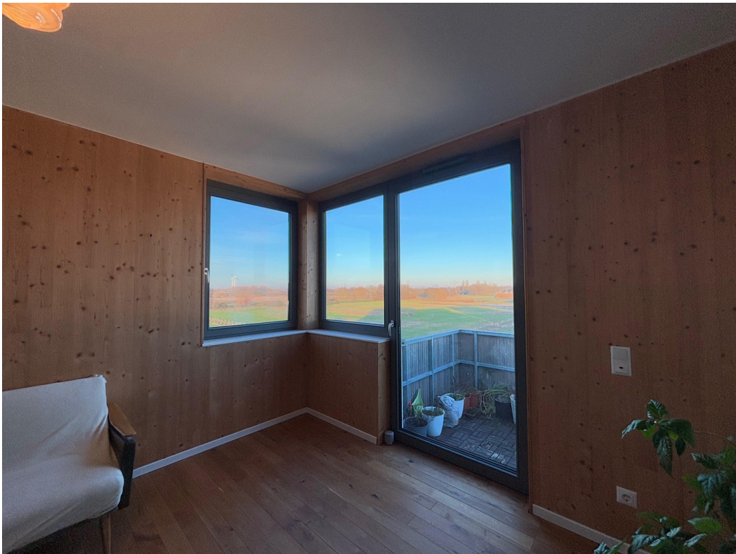
Wohnzimmer Sicht nach Außen