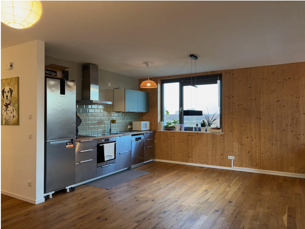
Wohnküche Bild 1