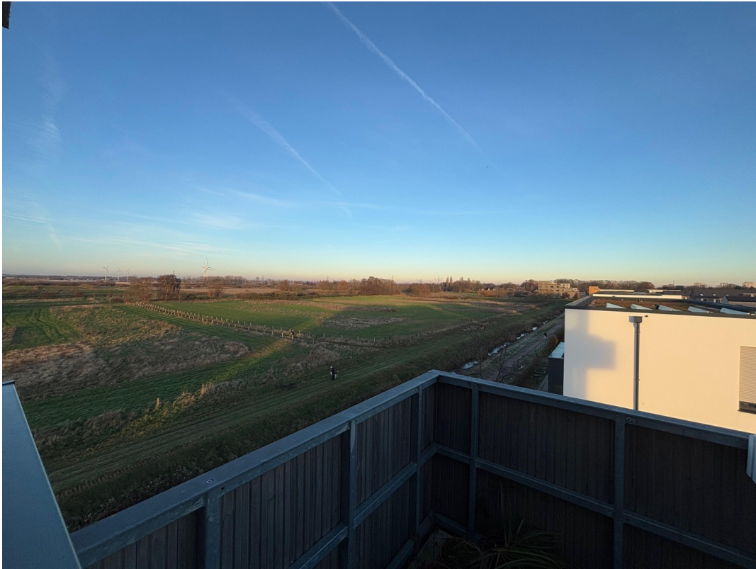
Blick zum Naturschutzgebiet