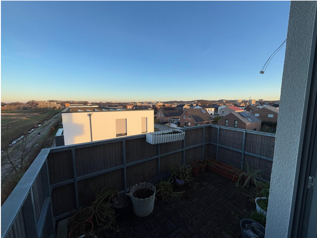
Blick über Dächer