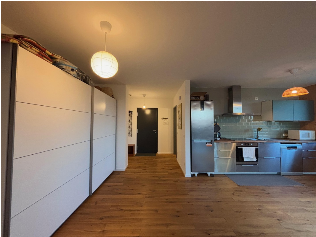
Blick zur Eingangstür