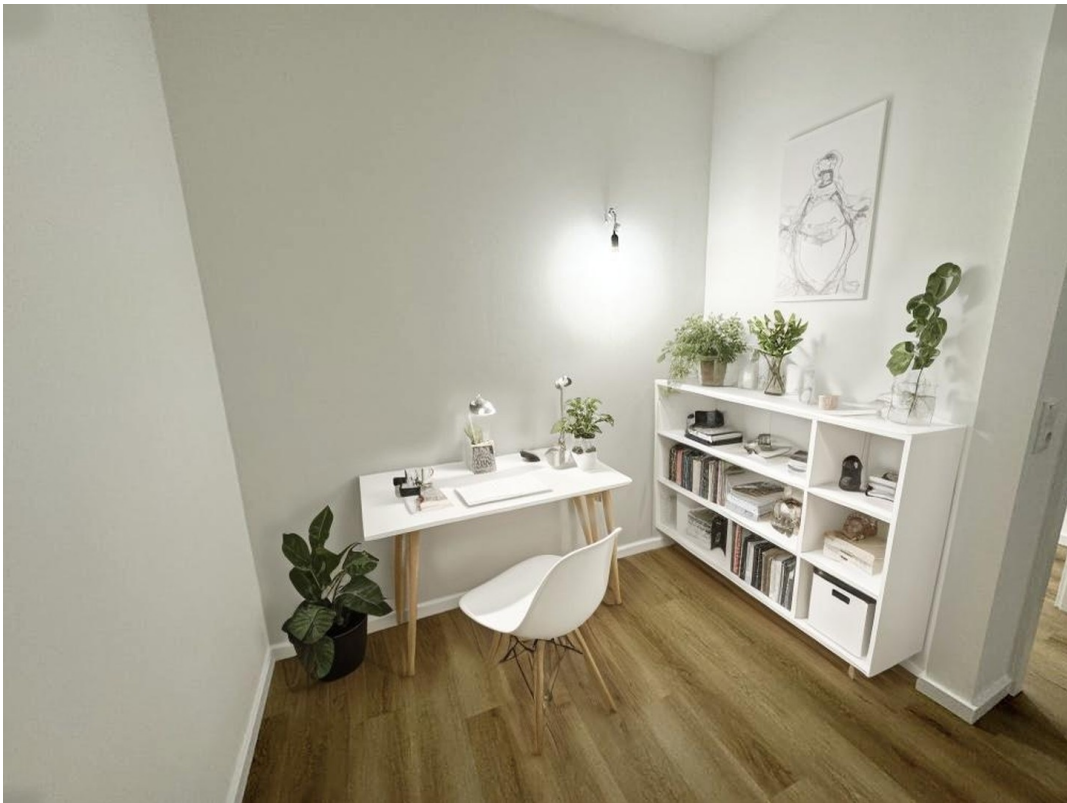
Nische im Schlafzimmer