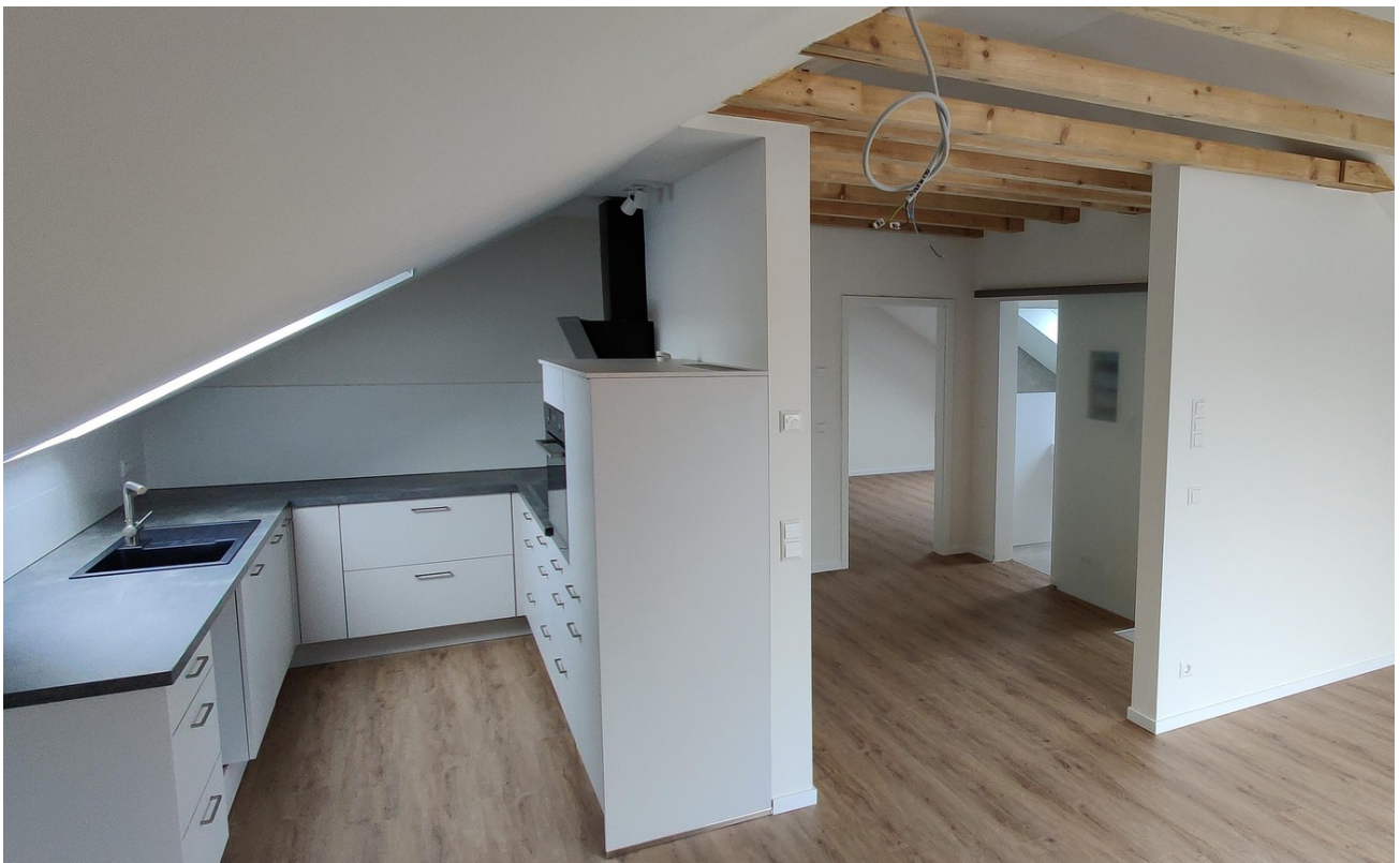
Wohnbereich mit offener Küche