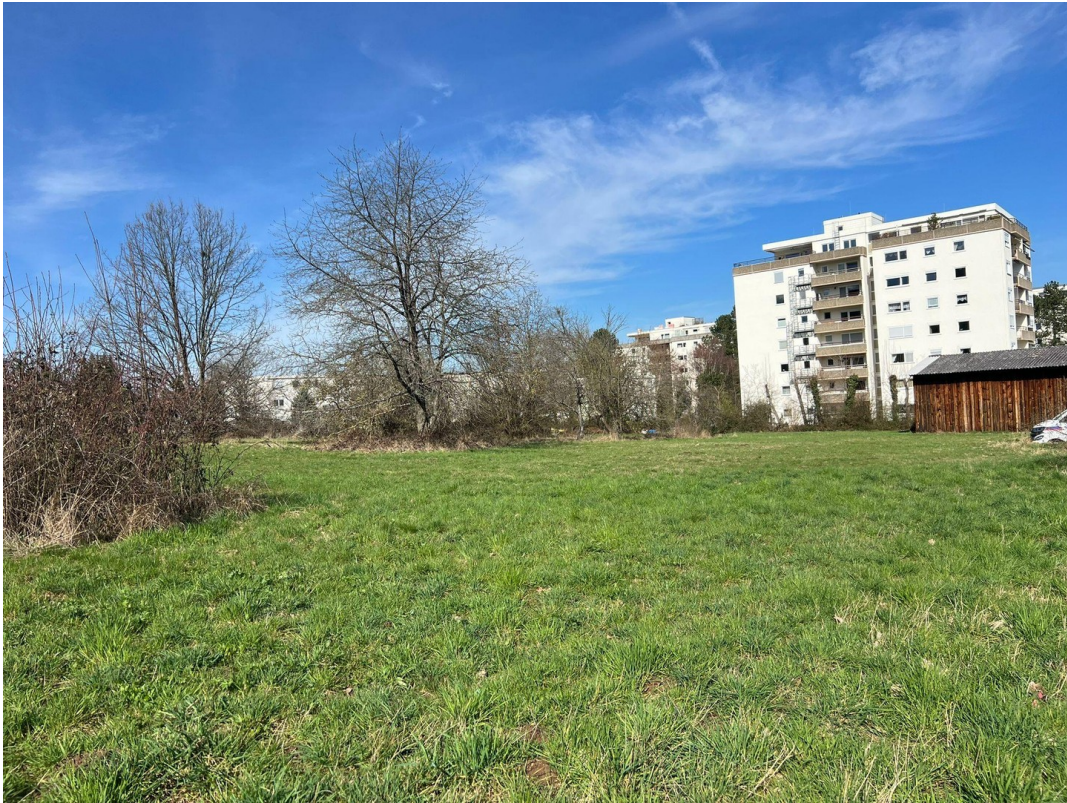
ALLEIN LAGE !!!