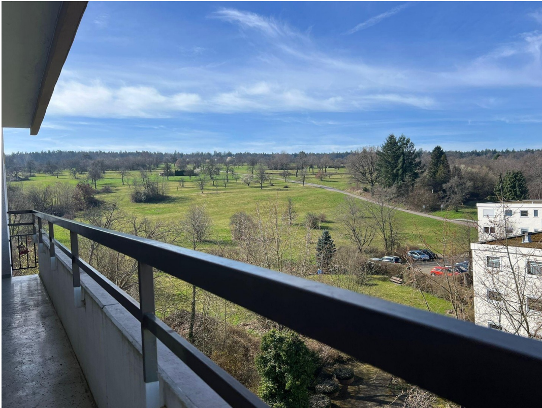
Aussicht vom Balkon