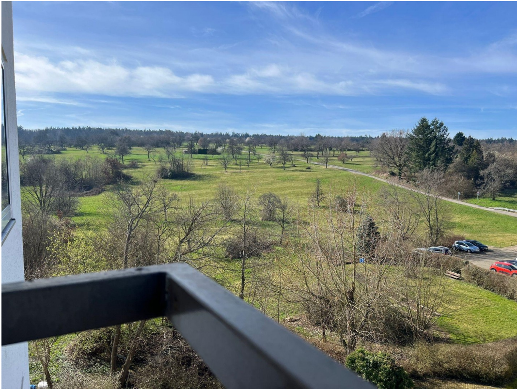
Aussicht vom Balkon