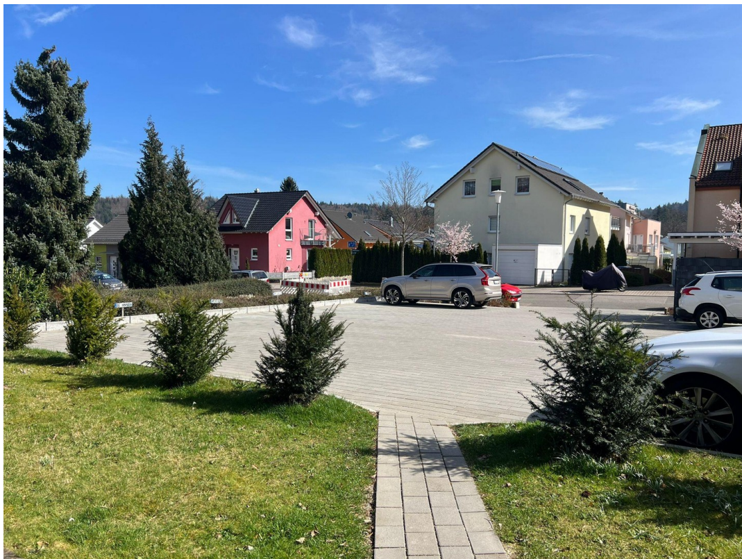
HAUS ZUGANG EINGANG