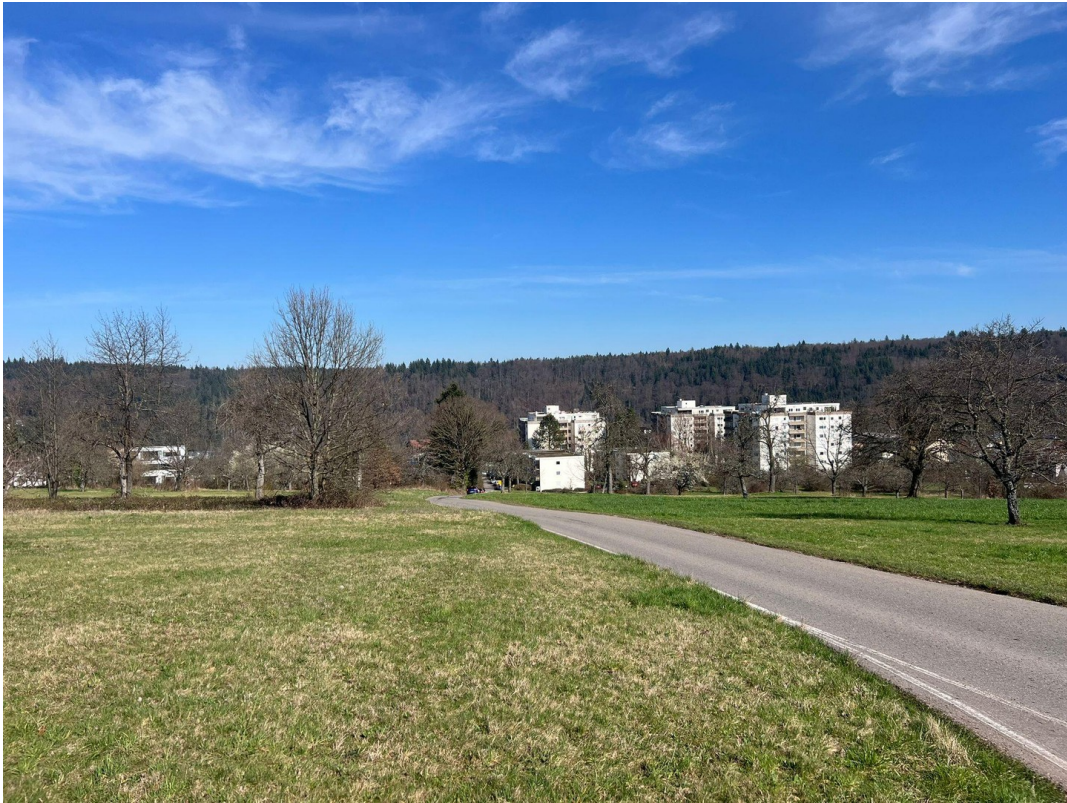
WIESEN UND FELDER