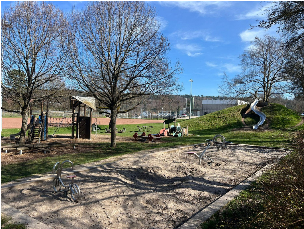
KINDERSPIELPLATZ IN DER NÄHE