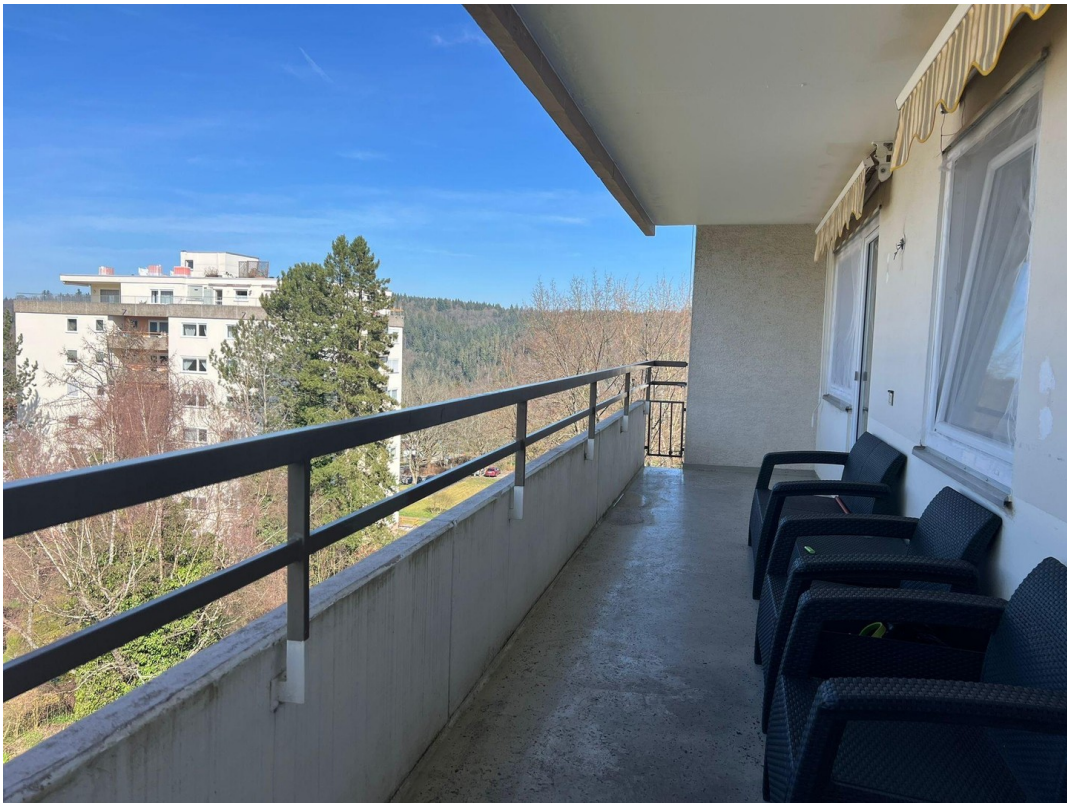
Balkon der Wohnung