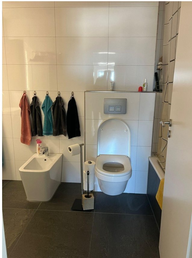
BAD mit Bidet und Wanne