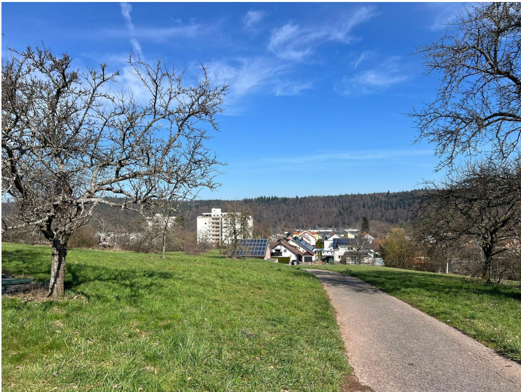
TOLLE SPAZIERWEGE INS TAL