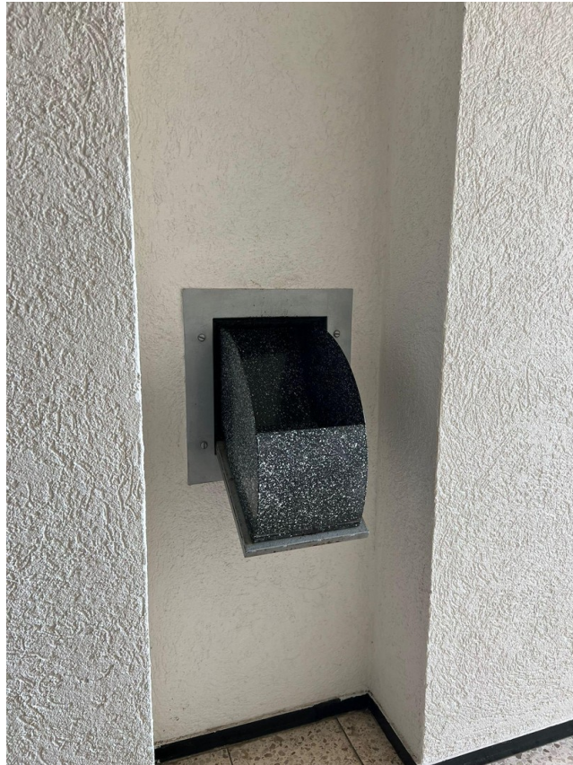
MÜLLSCHLUCKER auf jeder Etage