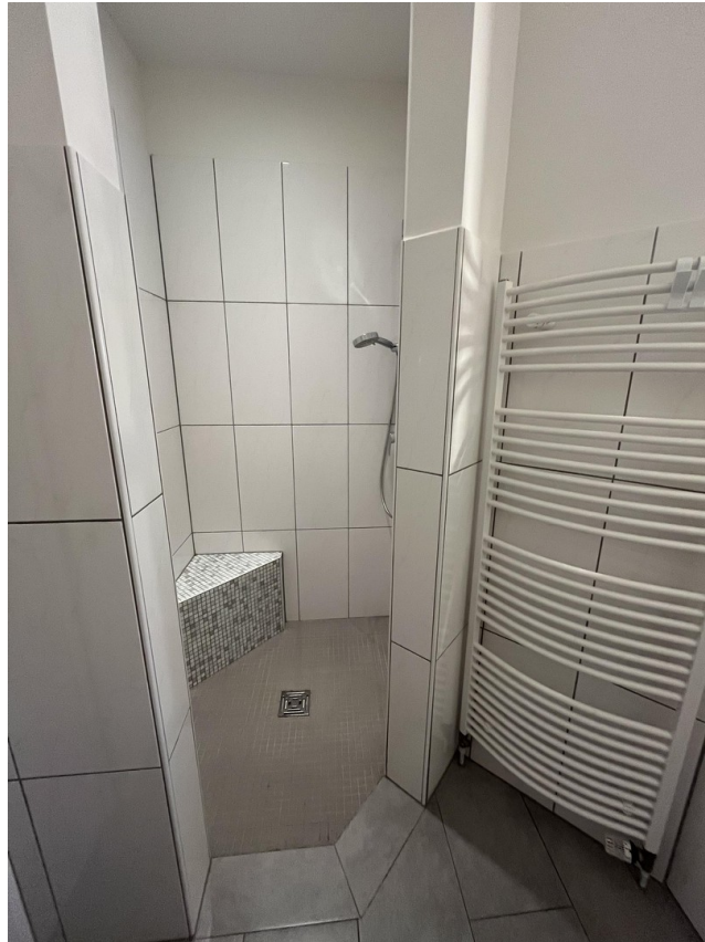
Begehbare Dusche EG