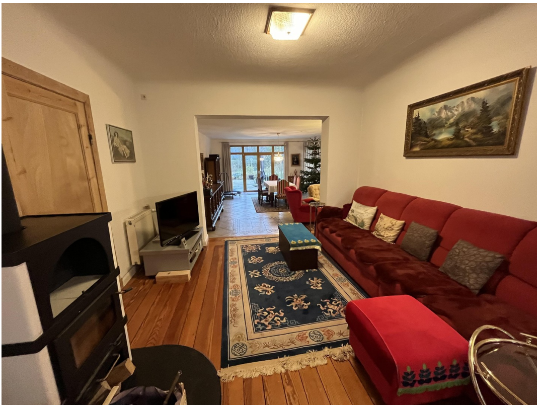
Dänischer Ofen EG