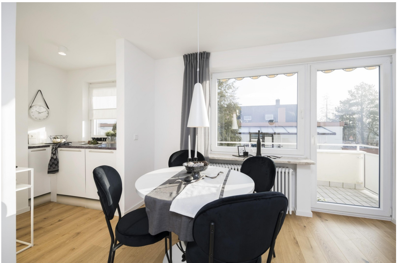
Essbereich mit Küche