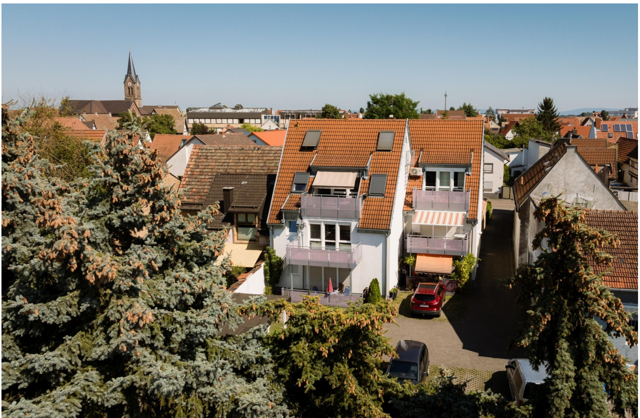
Hausansicht vom Hof