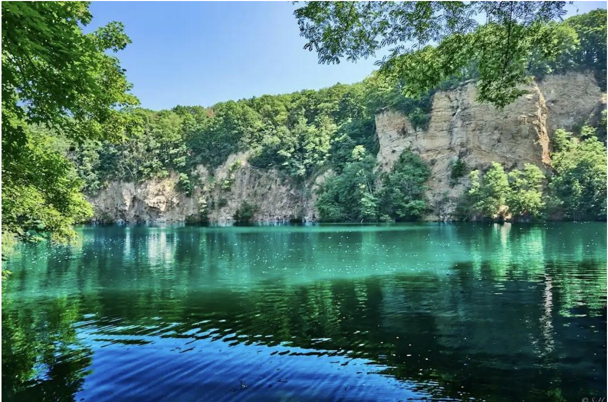
Blauer See Bonn Oberkassel