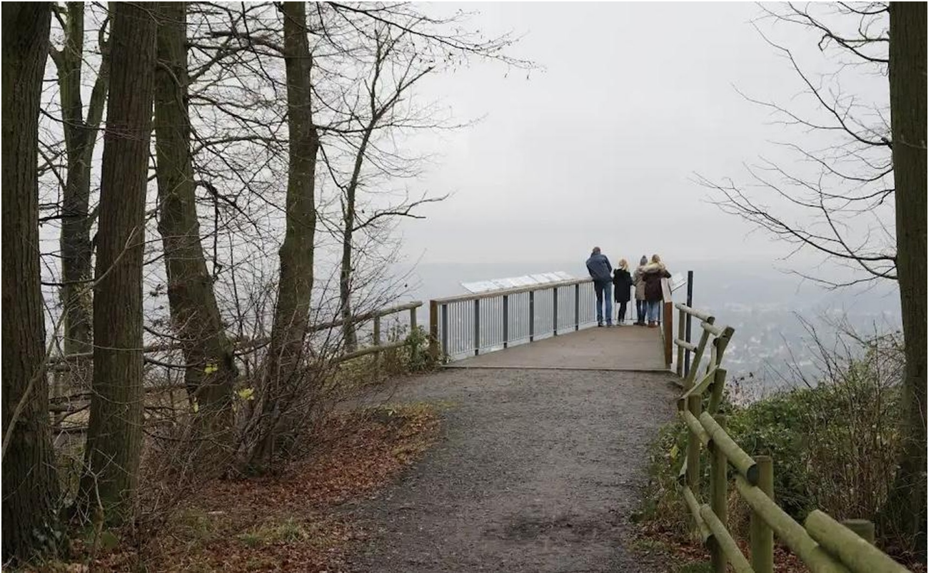
Skaywalk Rabenlay in Oberkasse