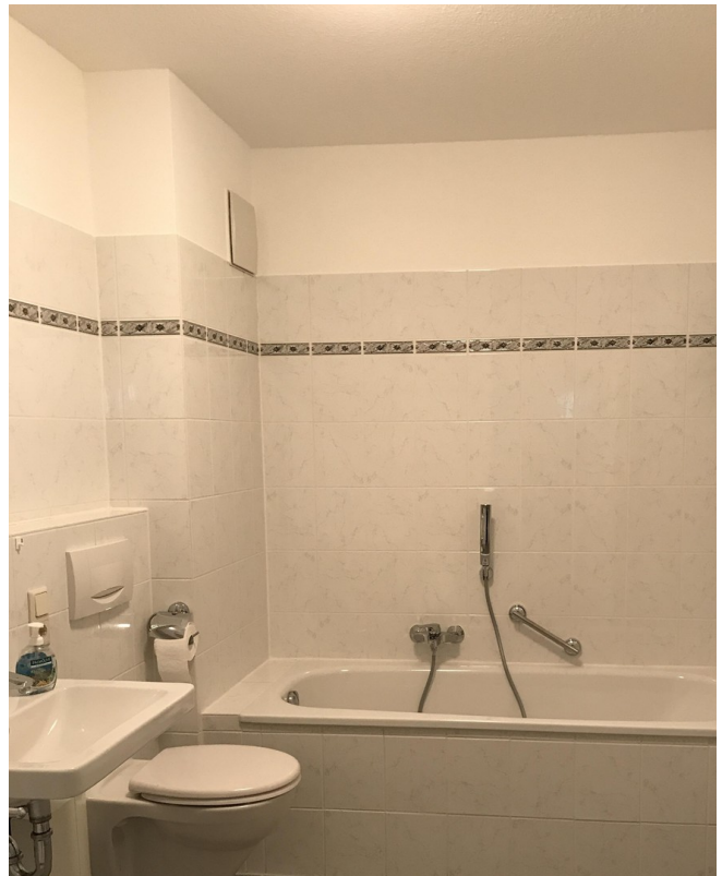
Badezimmer mit Wanne