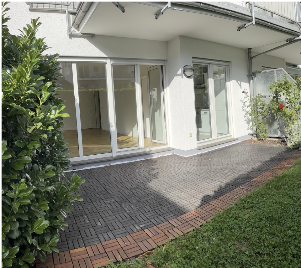
17 qm Sonnenterrasse