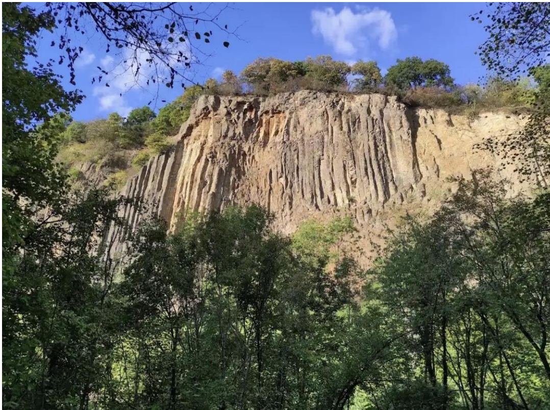
Klippe in Bonn Oberkassel