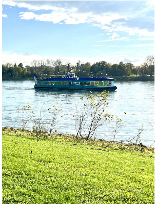
Uferpromenade in Oberkassel