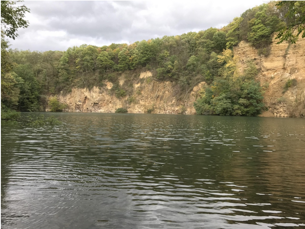
Märchensee in Oberkassel