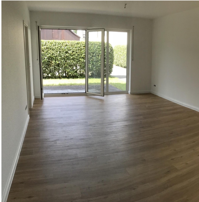
Wohnzimmer mit Terrasse