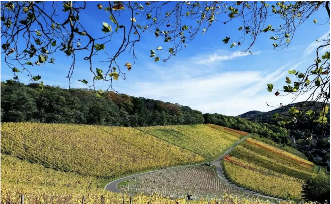
Weinberge in Oberdollendorf