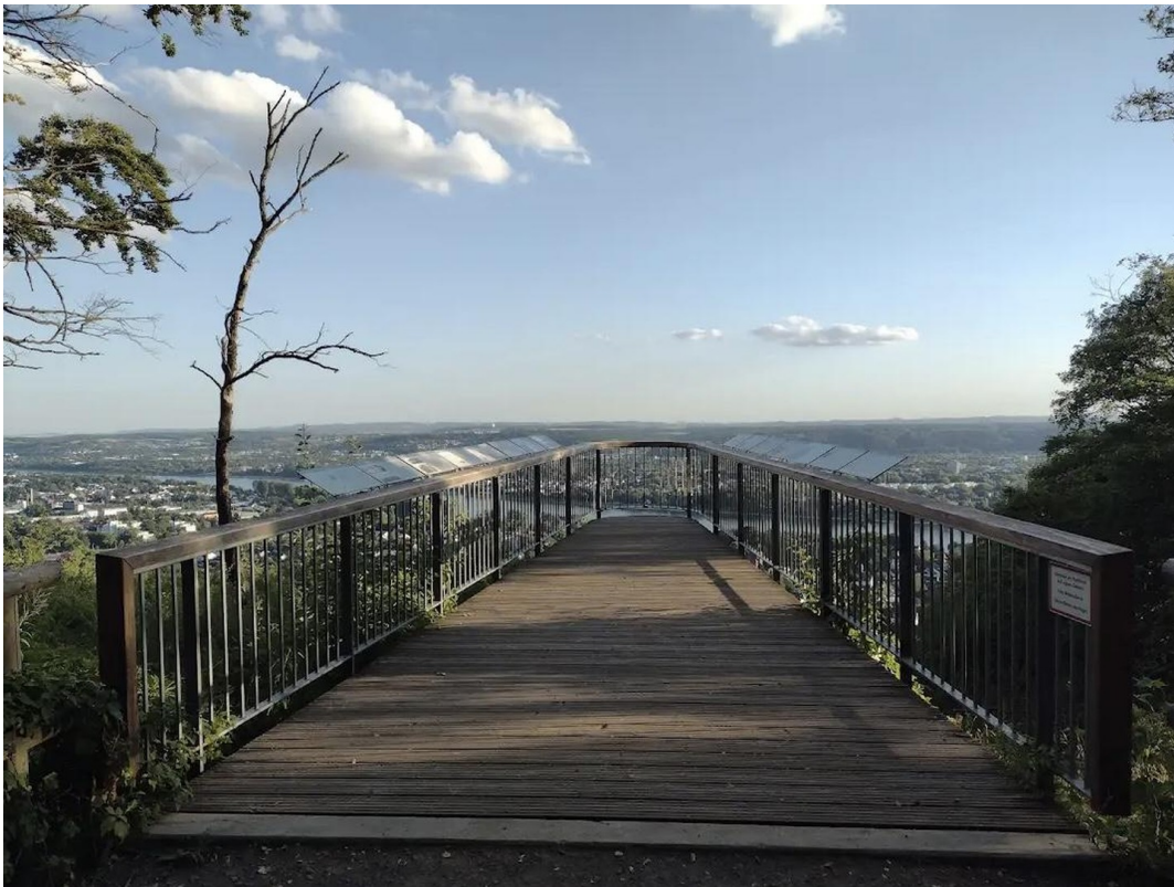
Rabenlay in Oberkassel