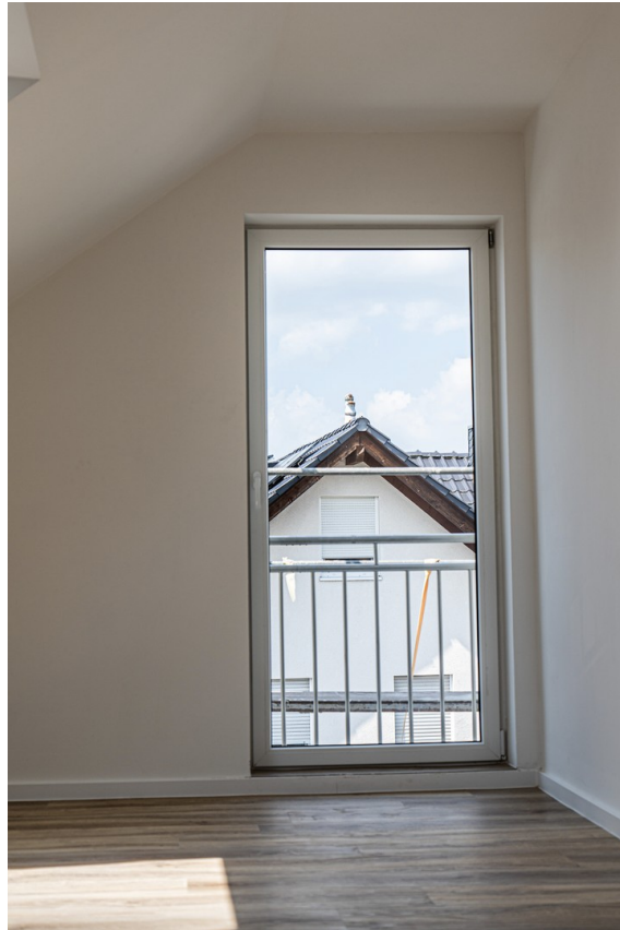
Bodentiefes Fenster Wohnzimmer