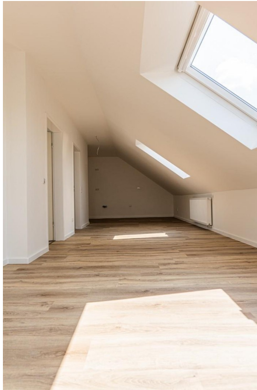
Koch- / Wohnbereich