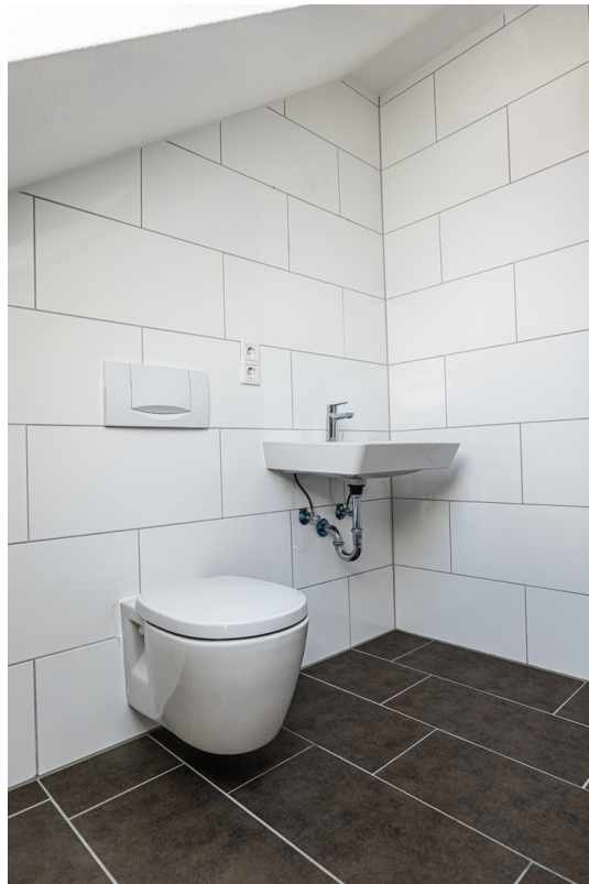
WC & Waschtisch