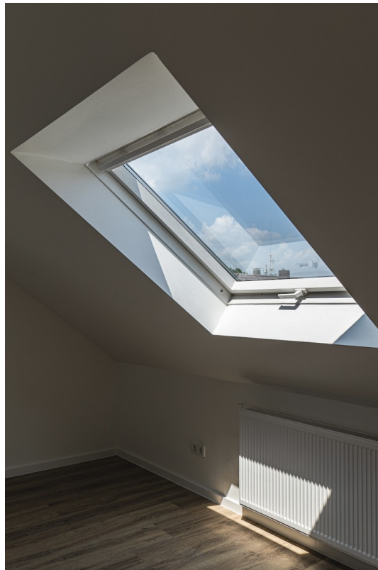
Dachfenster im Wohnbereich