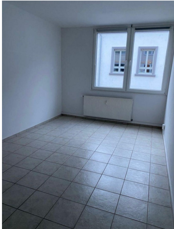
Zimmer Blick zum Fenster