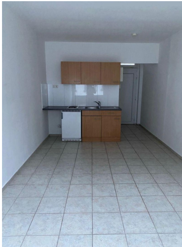
Zimmer Blick zum Eingang