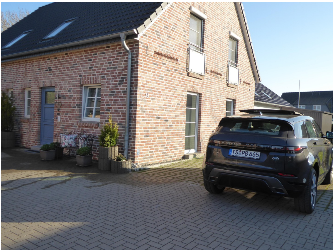
VORDERE DHH mit Stellplatz