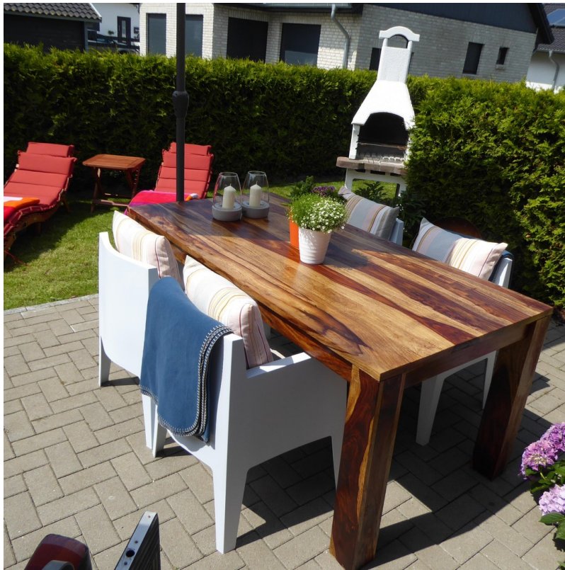
GARTEN, TERRASSE und GRILL