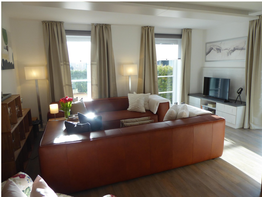
WOHNEN - EG