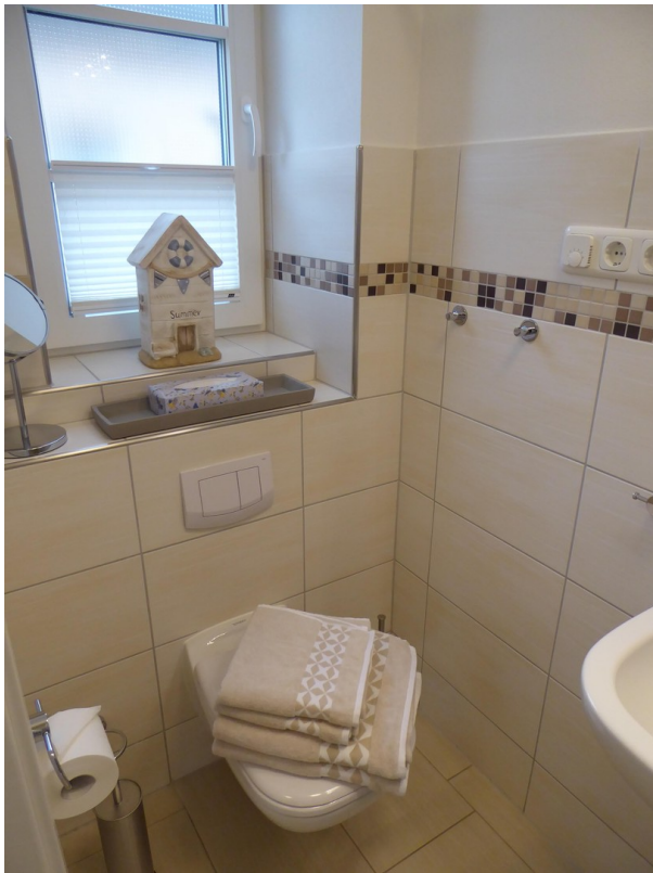
DUSCHBAD, WC - EG