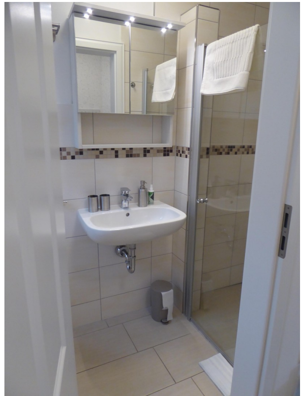
DUSCHBAD, WC - EG