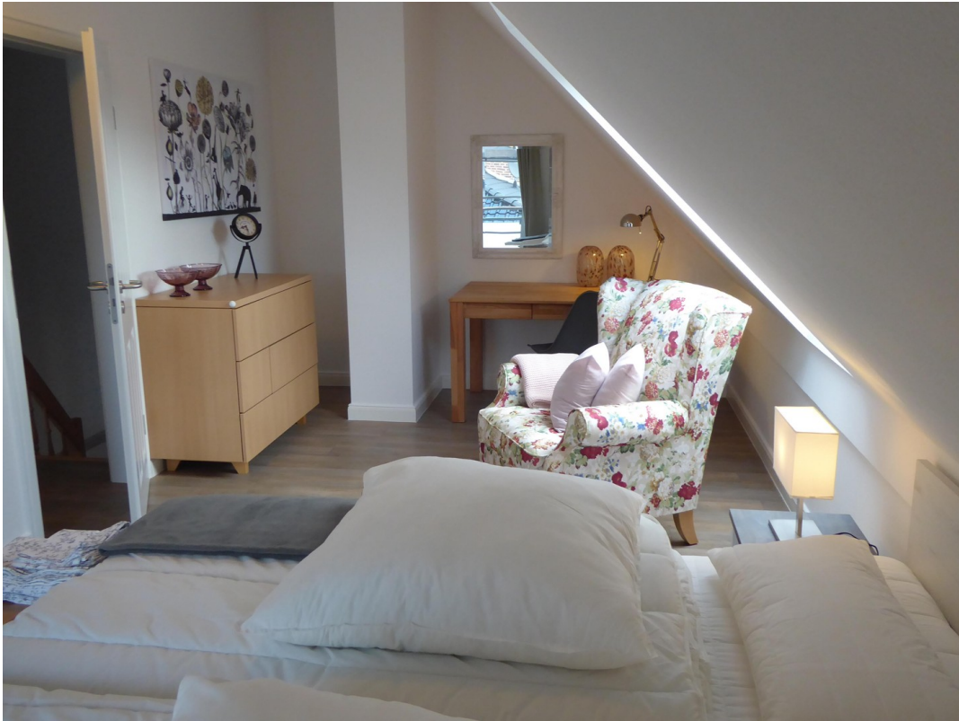
gr. SCHLAFZIMMER - OG