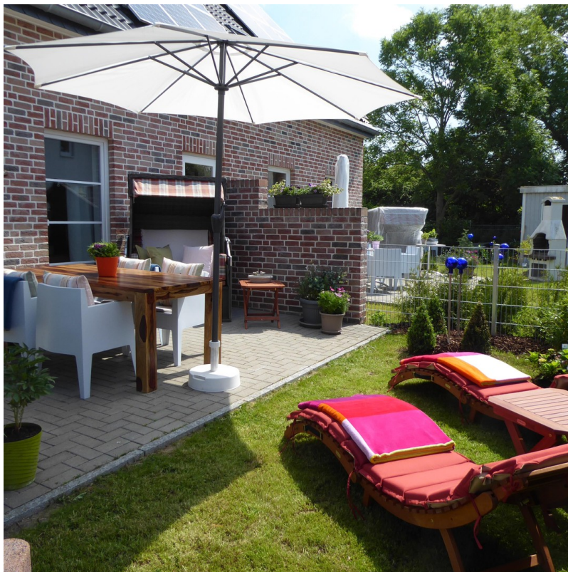
SONNENTERRASSE, mit Garten