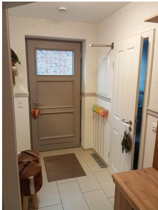
DIELE, Duschbad/WC, Garderobe