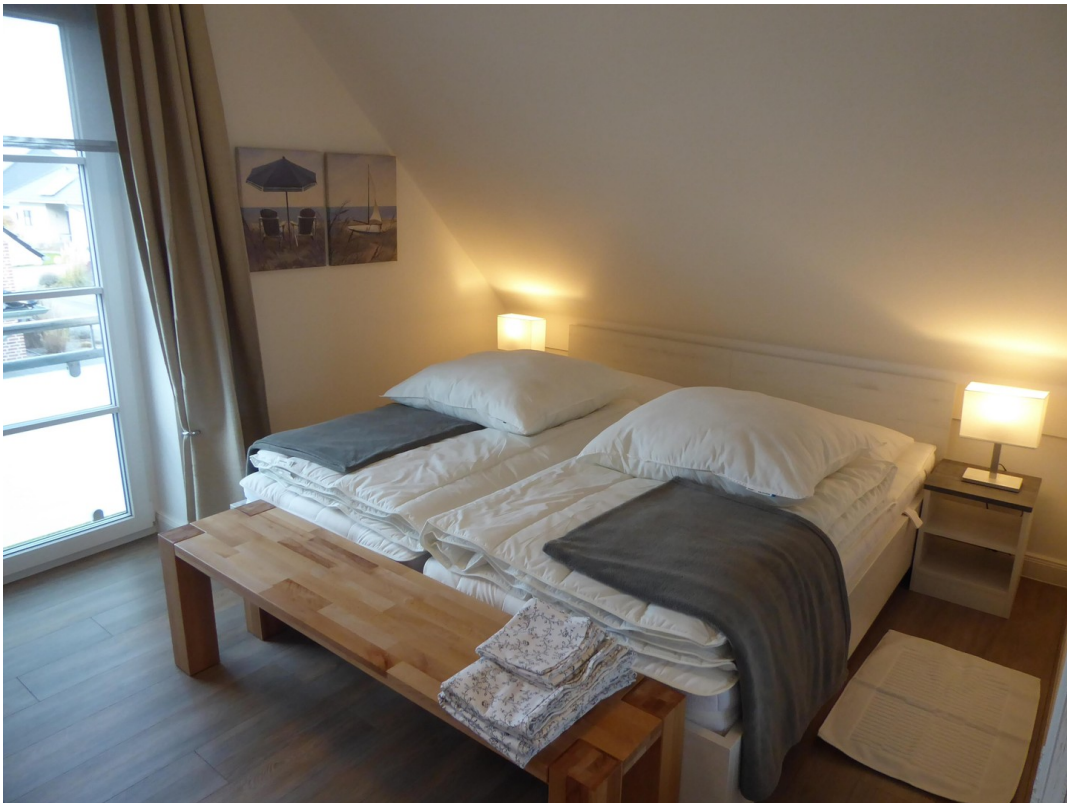
kl. SCHLAFZIMMER - OG