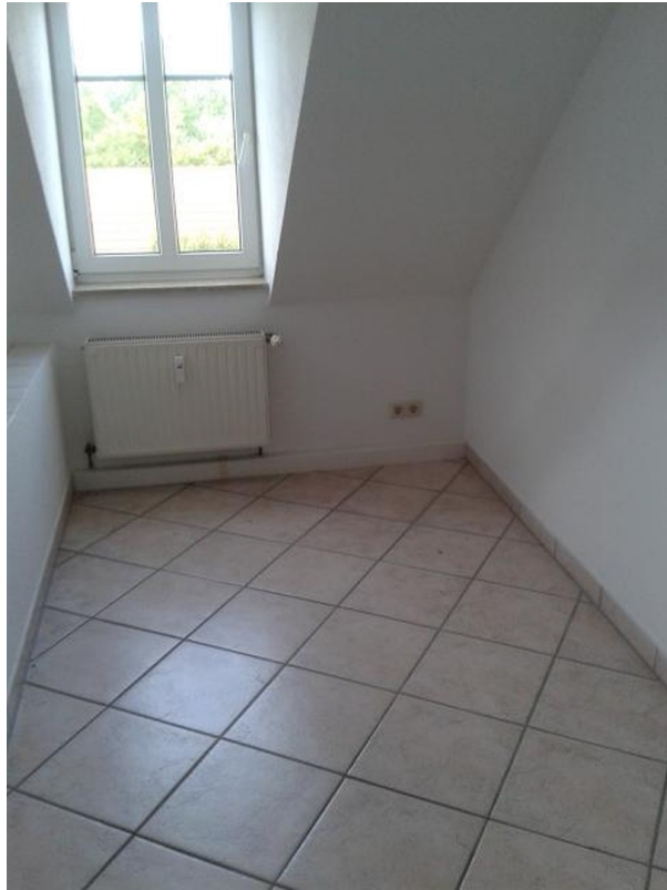
Küche / Sitzbereich