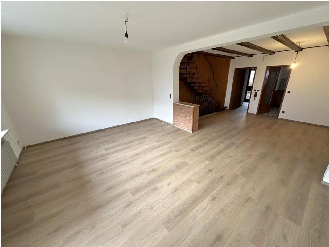
Wohn- u. Esszimmer