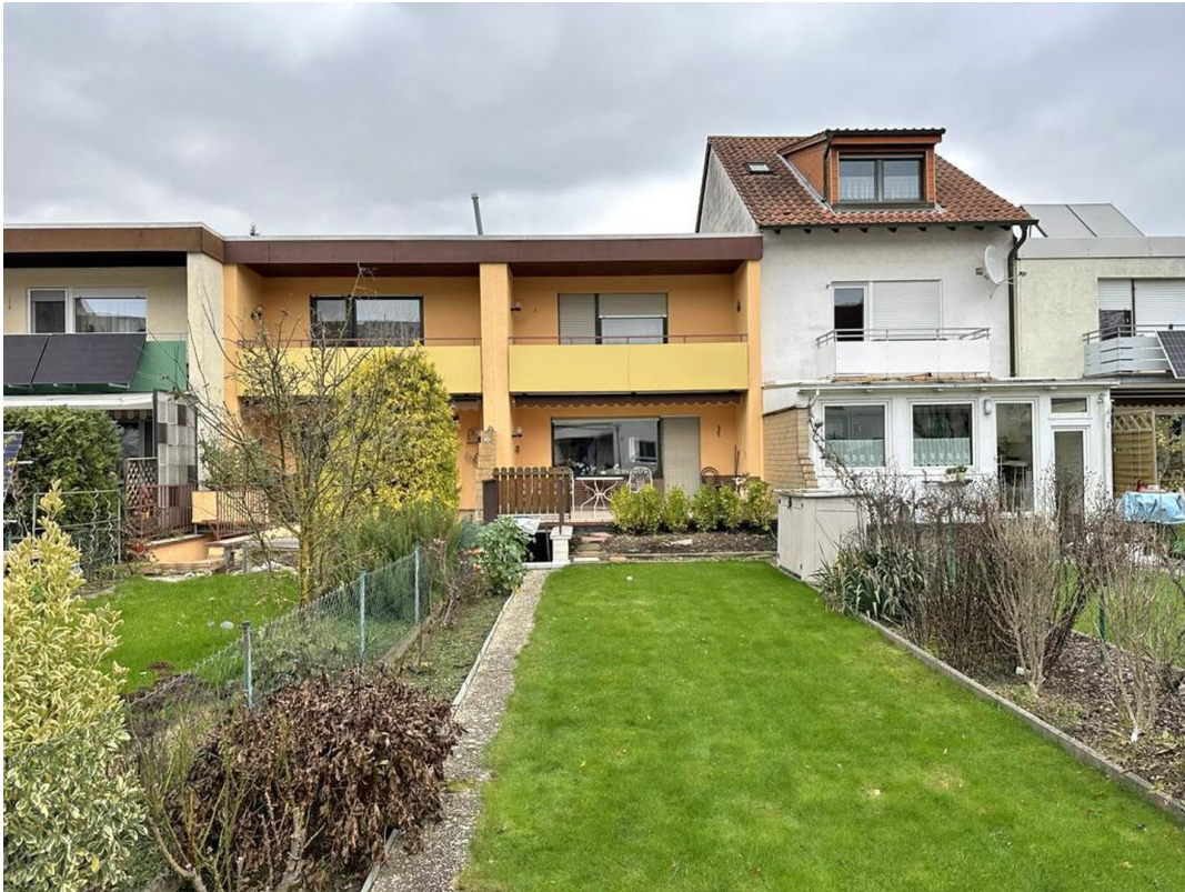
Rückansicht mit Garten