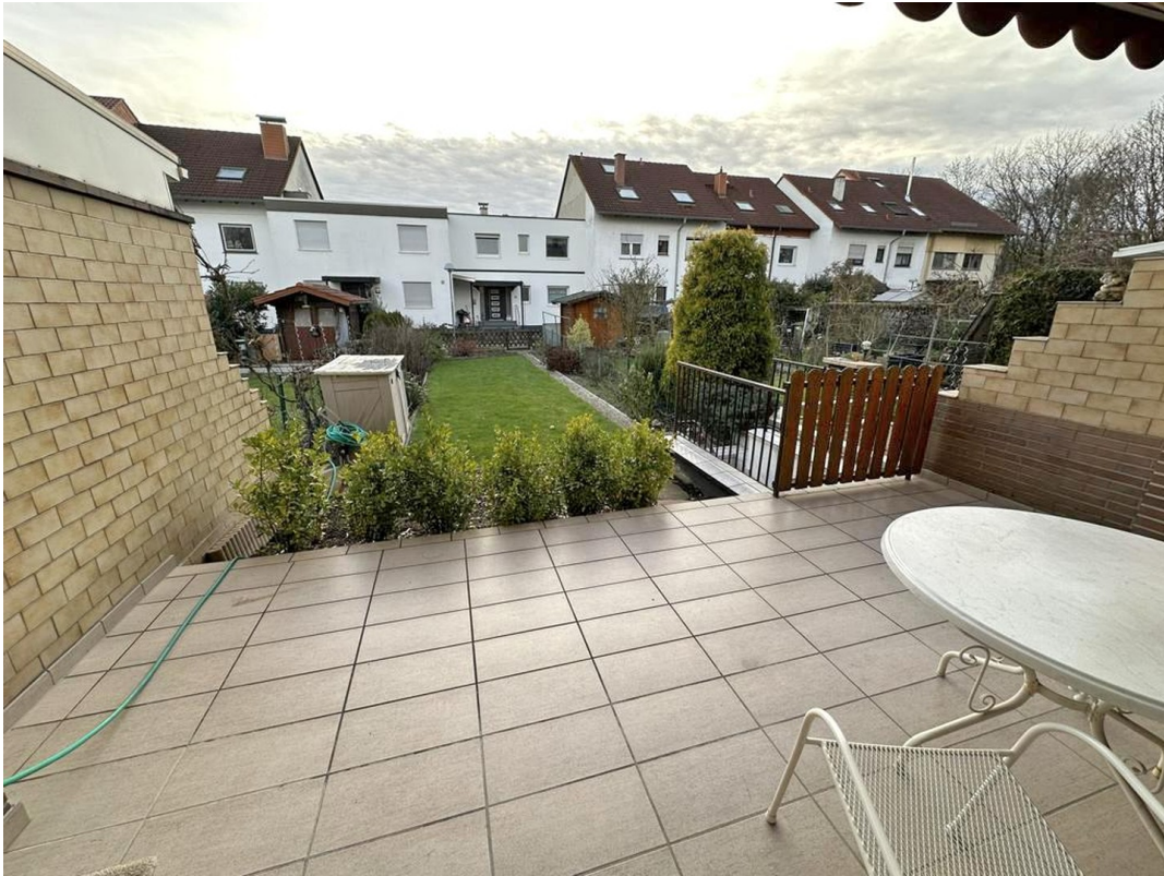
Terrasse mit Markise