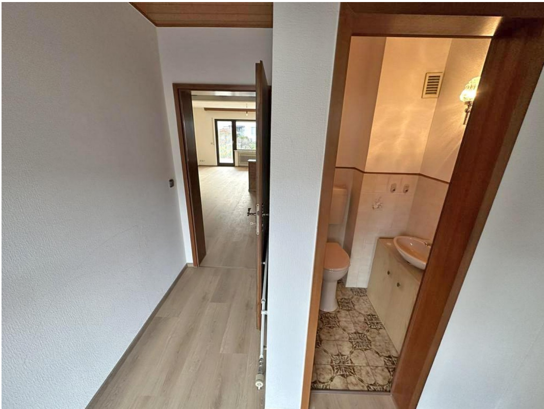
Flur EG mit Gästetoilette