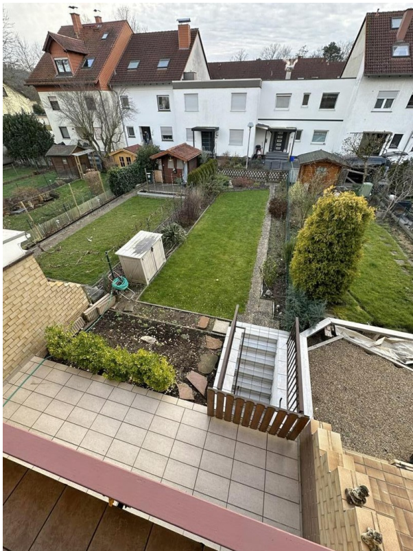
Blick von der Loggia