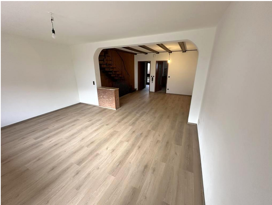
Wohn- u. Esszimmer