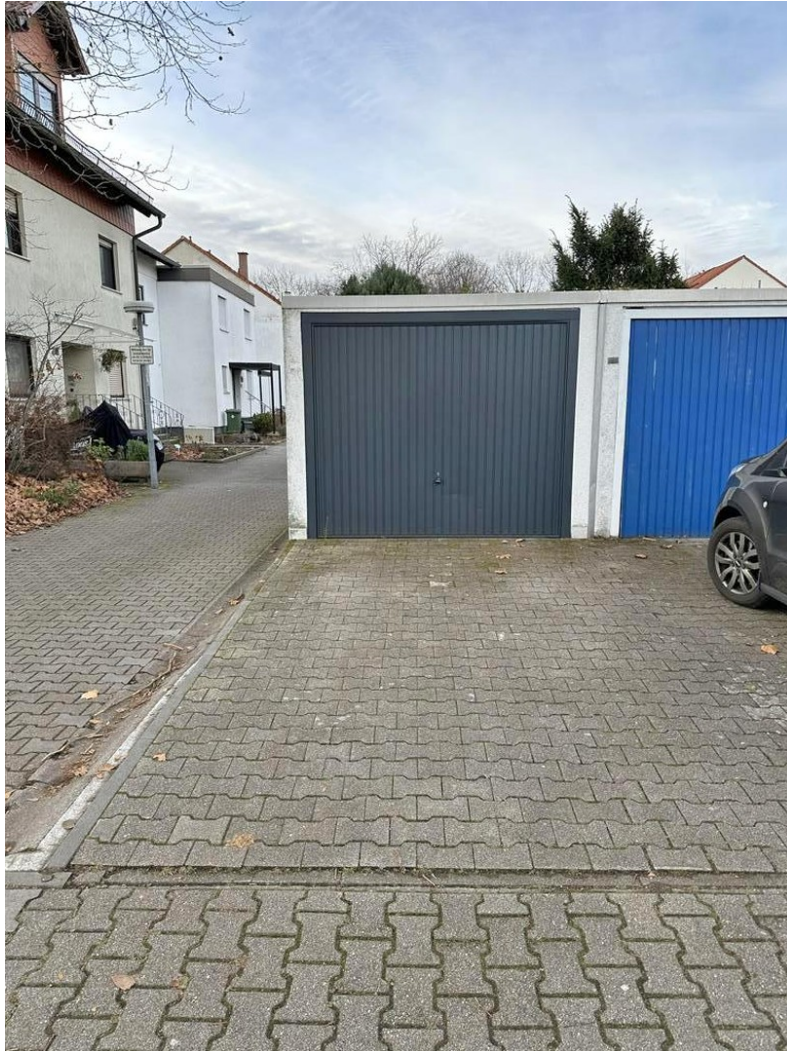
Garage mit Stellplatz