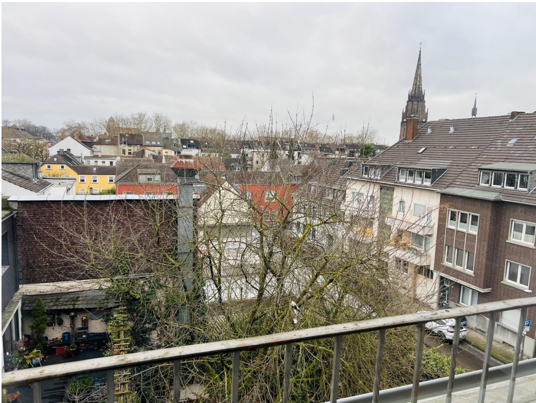
Blick aus Büro 2