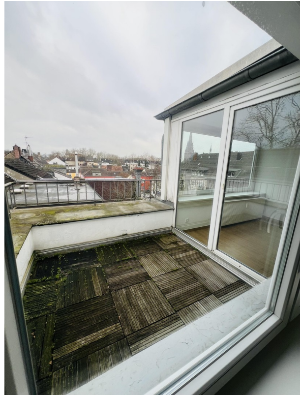
Terrasse vor Büro 2 und 3