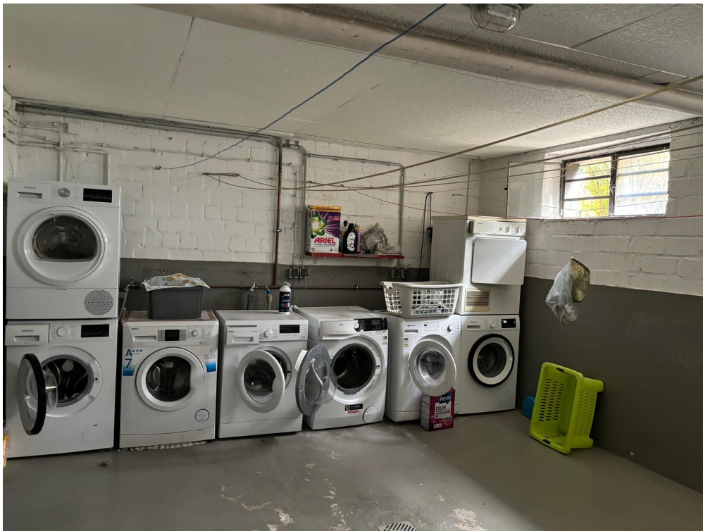
Wasch- und Trockenraum