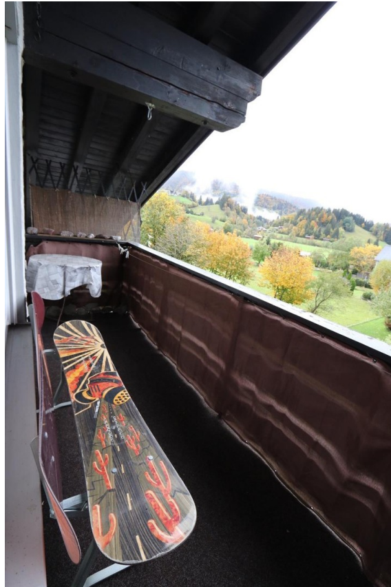
Balkon - Blick nach Westen