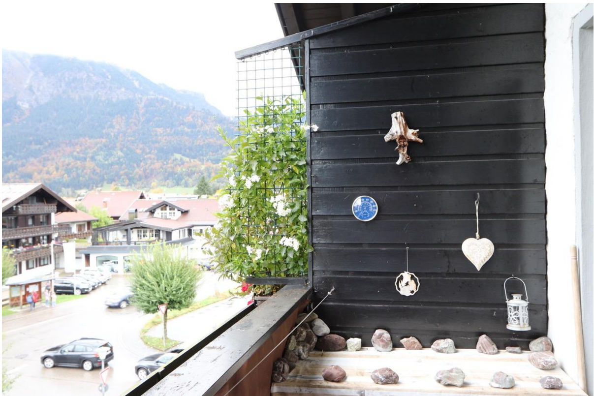
Balkon - Blick nach Osten