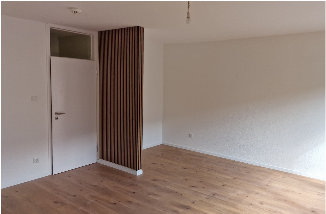
Wohnzimmer mit Schlafbereich