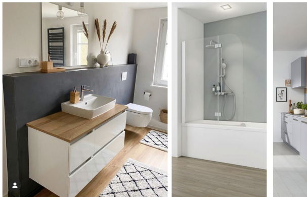
Anmutung nach Sanierung

Top Lage - charmanter Altbau - 2 Zimmer, teilmöbliert - Erstbezug nach Renovierung - WG geeignet