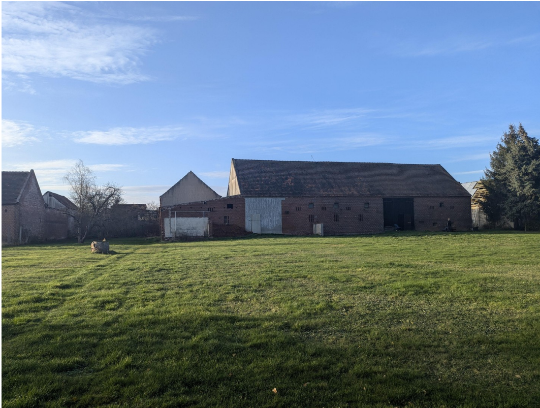
Scheune vom Garten