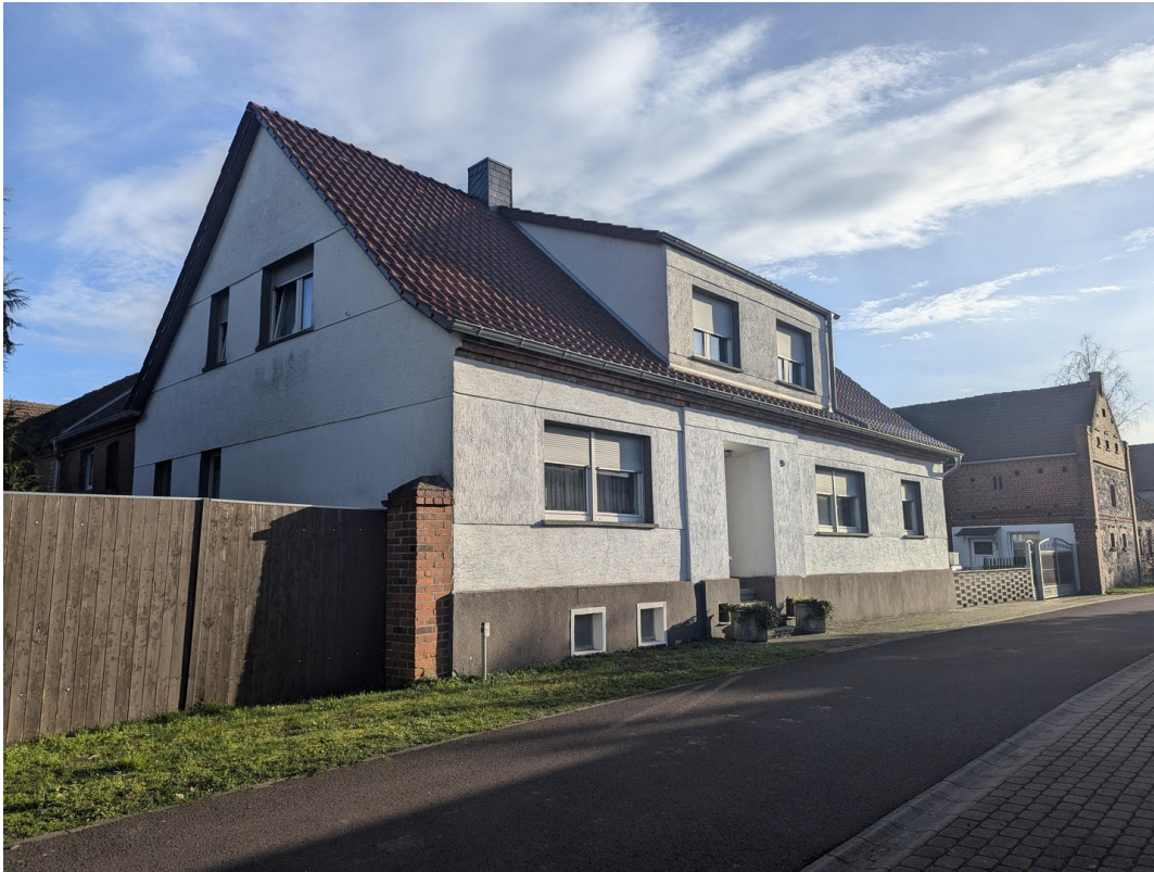
Straßenfront mit Gartenzufahrt