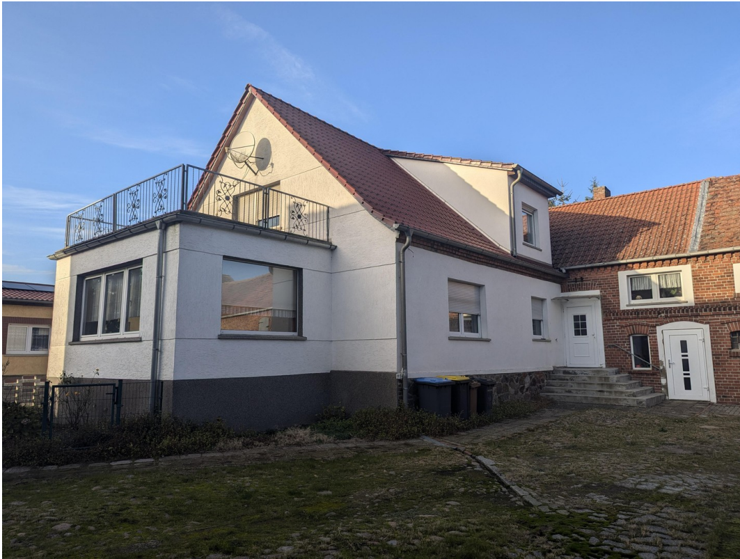
Hof mit Nebeneingang