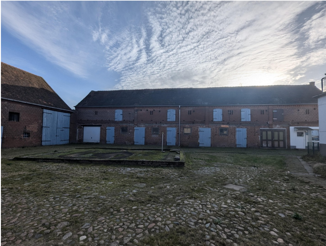
Stallung mit kl. Werkstatt