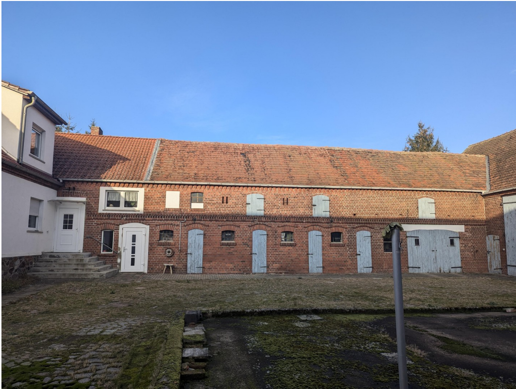
Stallung und Garage