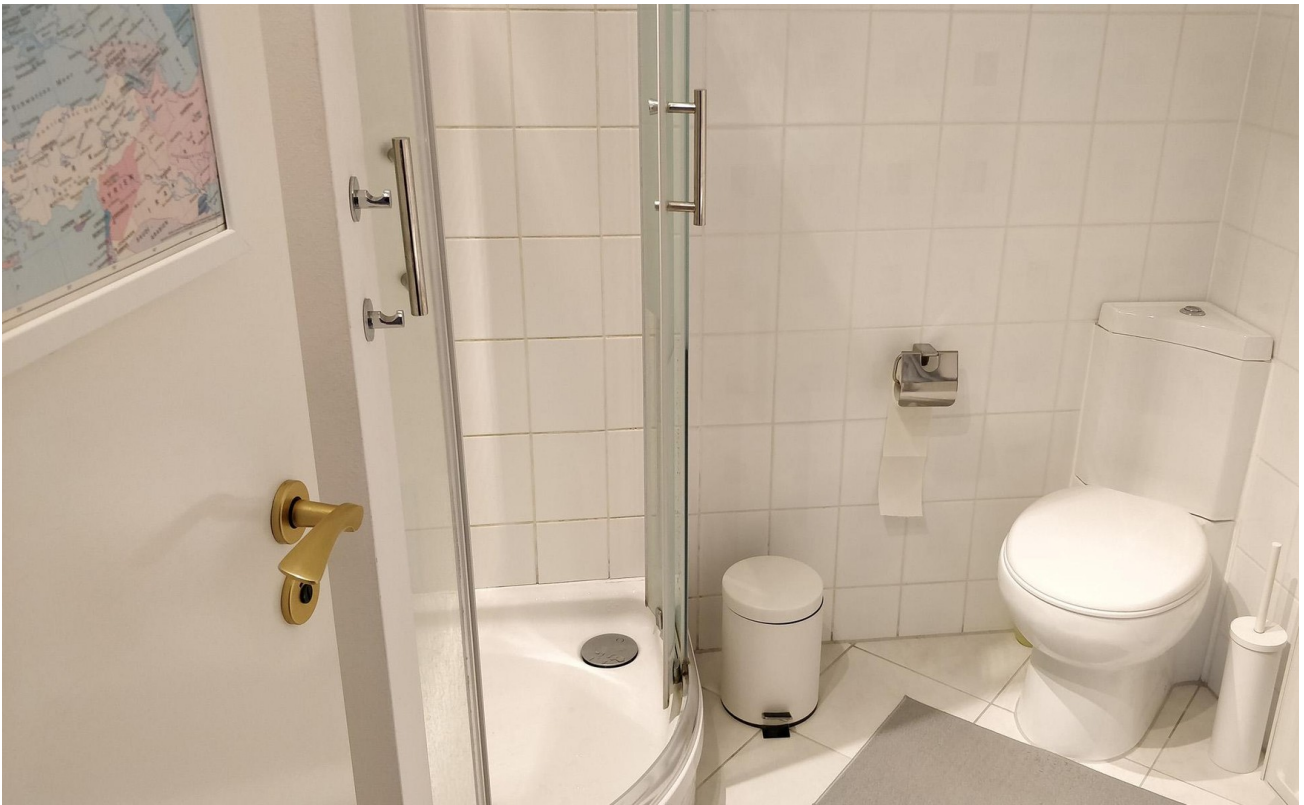
Duschbad - Rechts