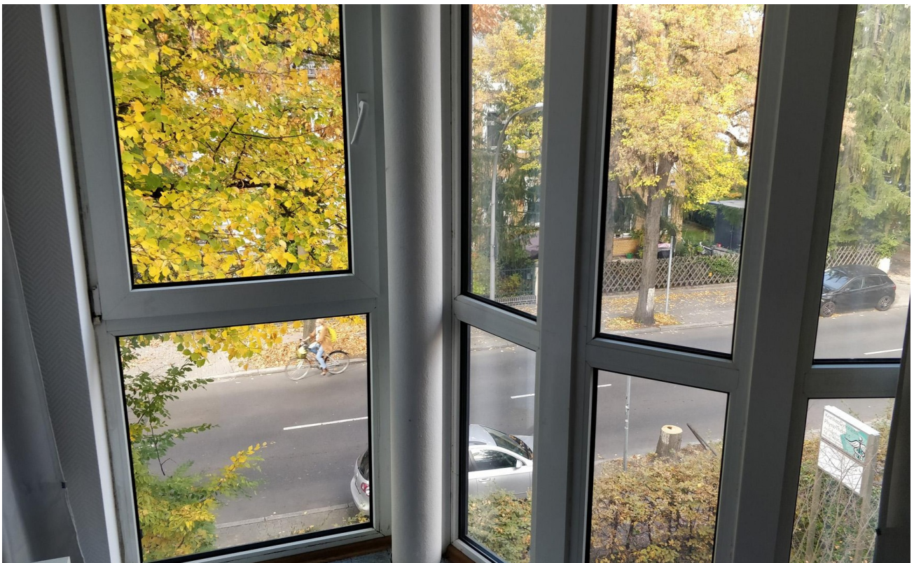
Schlafzimmer 2 (NW-Seite) - L