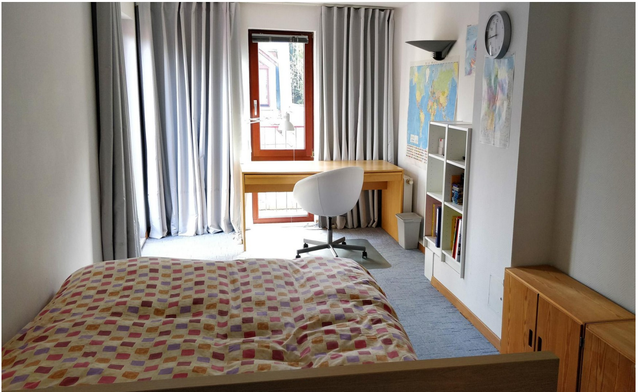
Schlafzimmer 2 (SO-Seite) - L