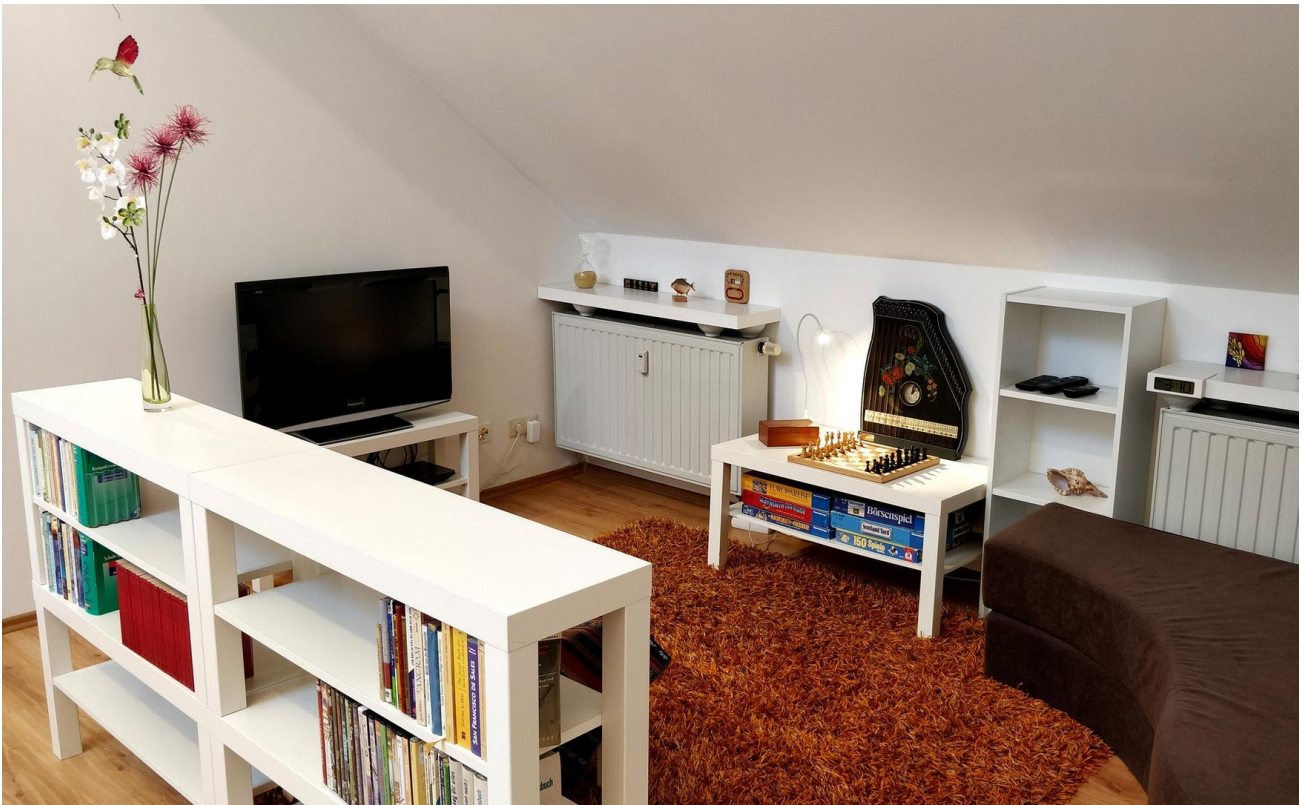
Wohnzimmer (NW-Seite) - Links