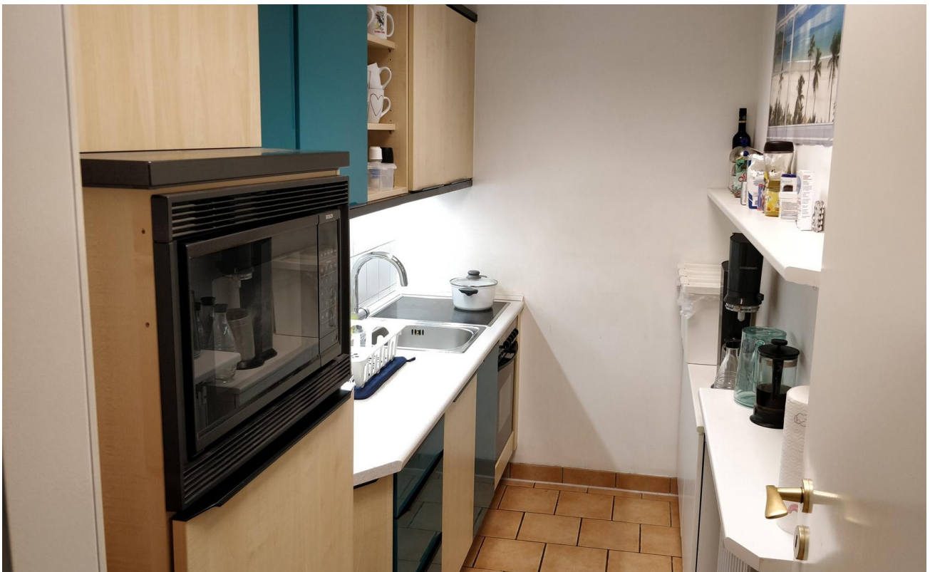
Kleine Küche 2 - Links