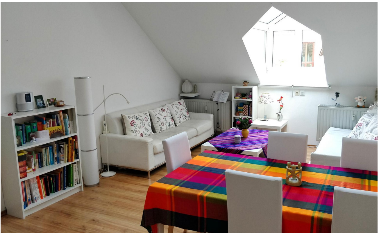
Wohnzimmer (SO-Seite) - Links