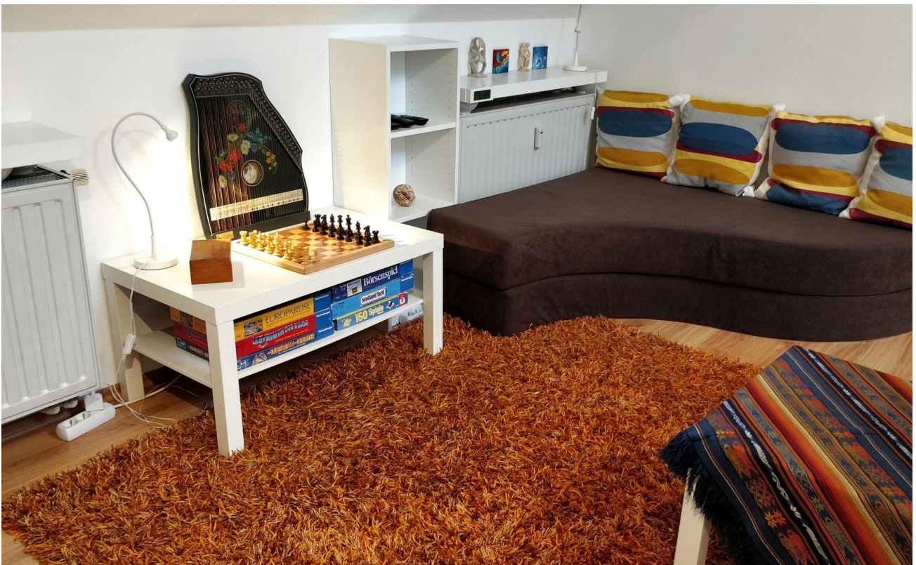
Wohnzimmer (NW-Seite) - Links