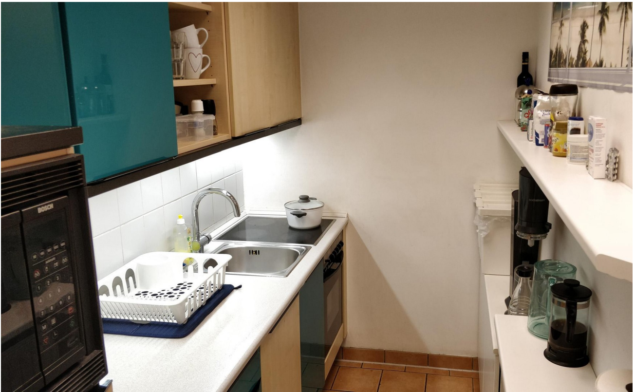
Kleine Küche 2 - Links