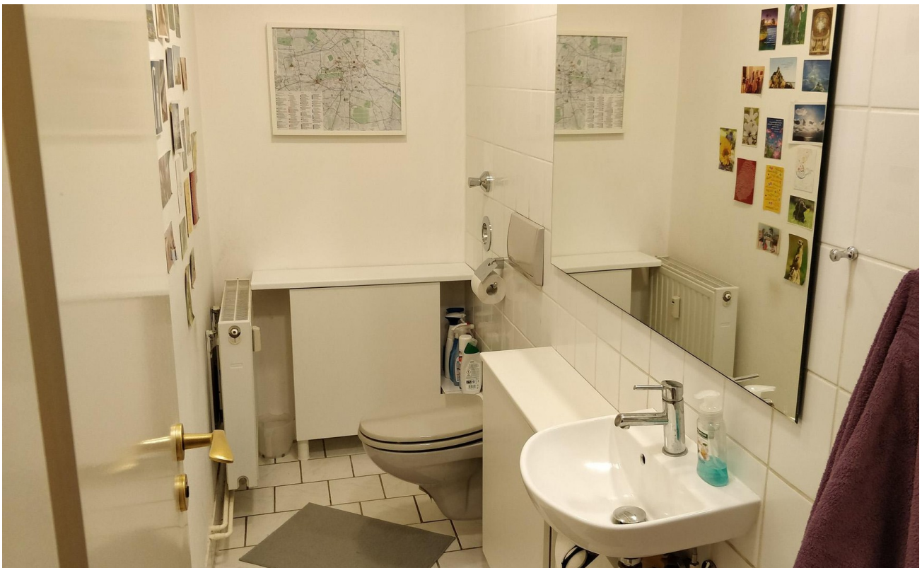
Gäste WC - Links