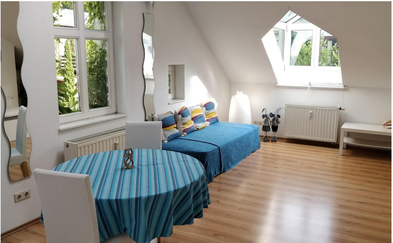
Schlafzimmer 1 - Rechts