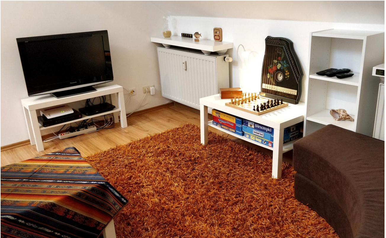
Wohnzimmer (NW-Seite) - Links