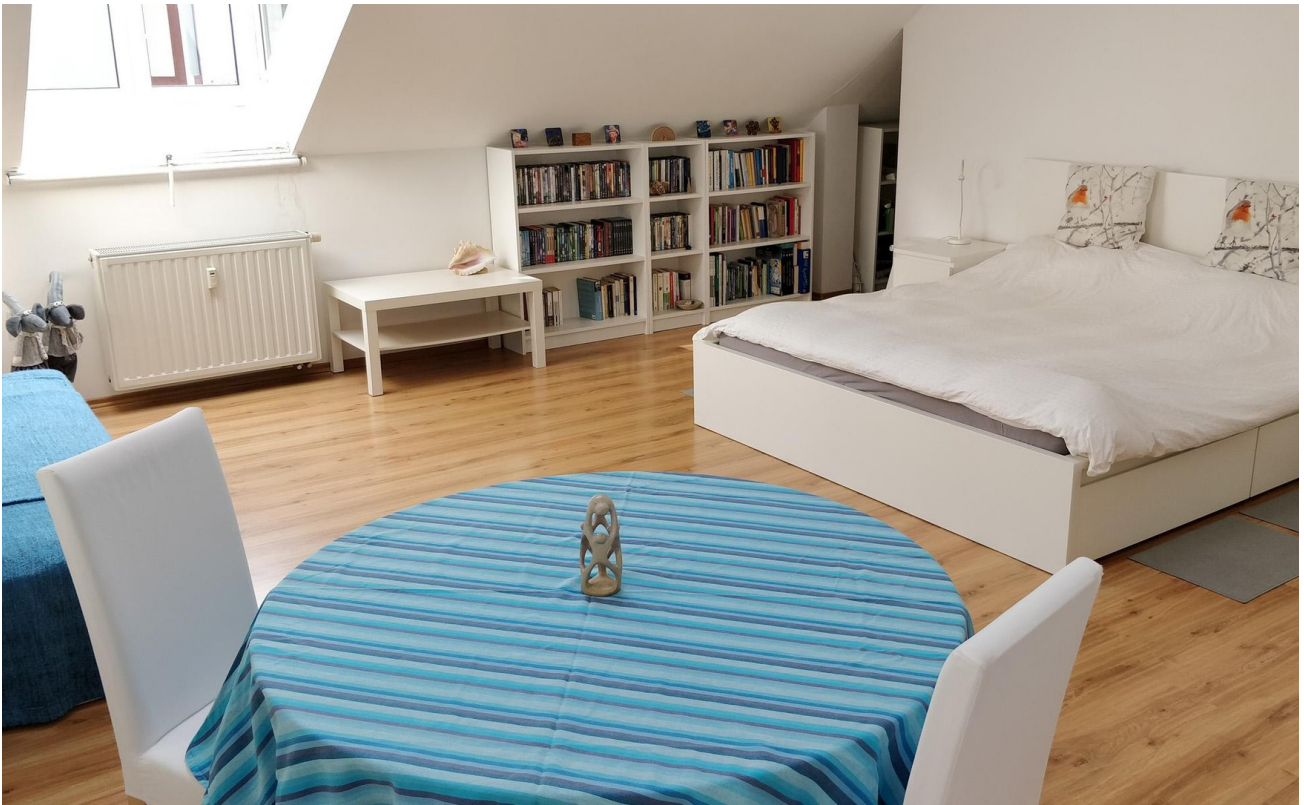
Schlafzimmer 1 - Rechts