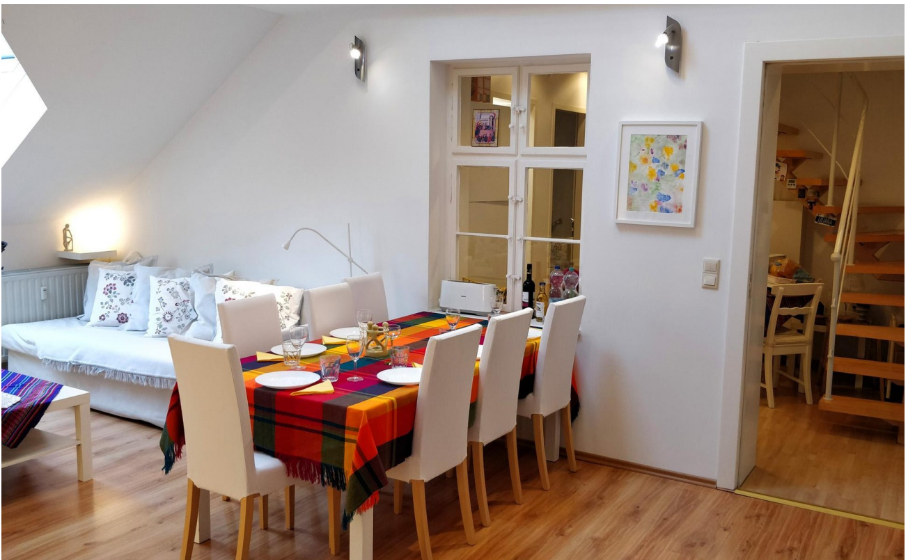
Wohnzimmer (SO-Seite) - Links