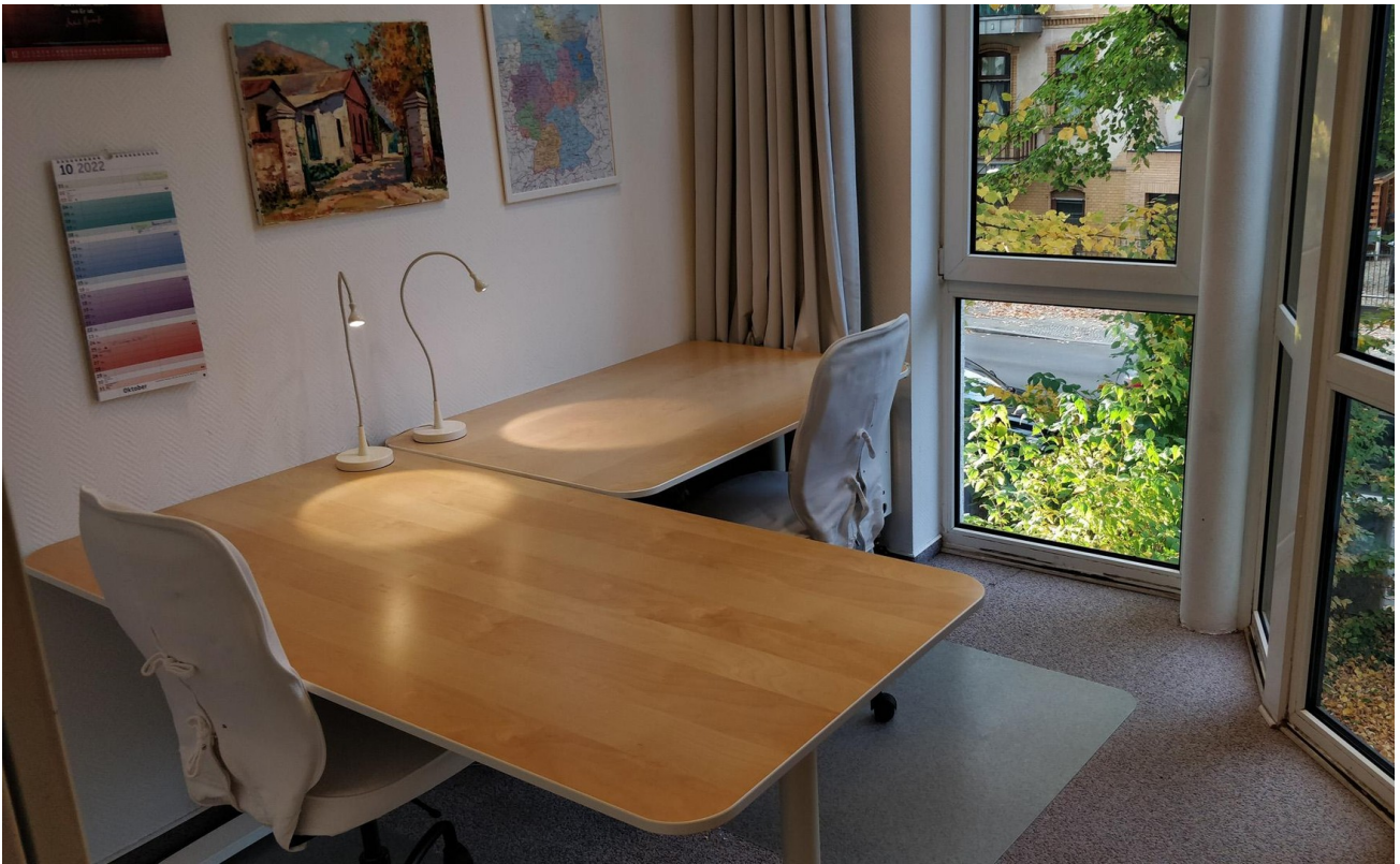
Büro (NW-Aussicht) - Links