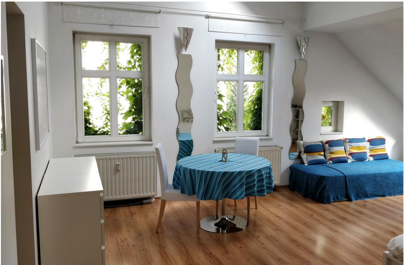
Schlafzimmer 1 - Rechts