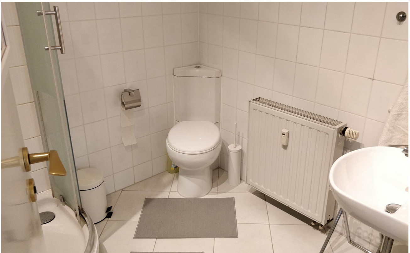
Duschbad 1 - Rechts