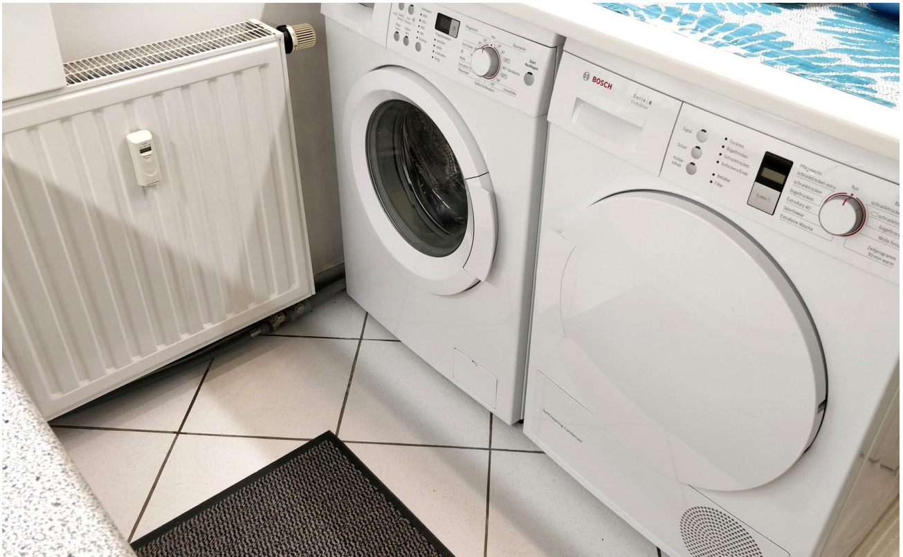
Kleine Küche 1 - Rechts