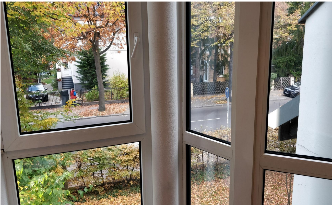
Büro (NW-Aussicht) - Links