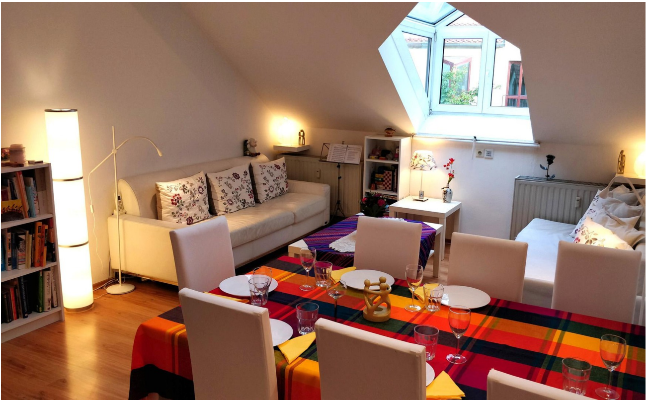
Wohnzimmer (SO-Seite) - Links