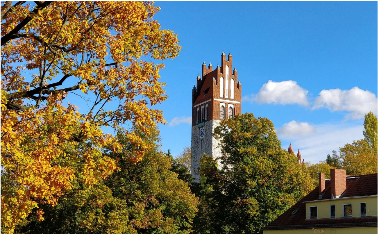
Schlafzimmer 2 (SO-Seite) - L