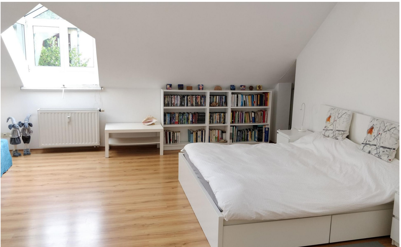
Schlafzimmer 1 - Rechts