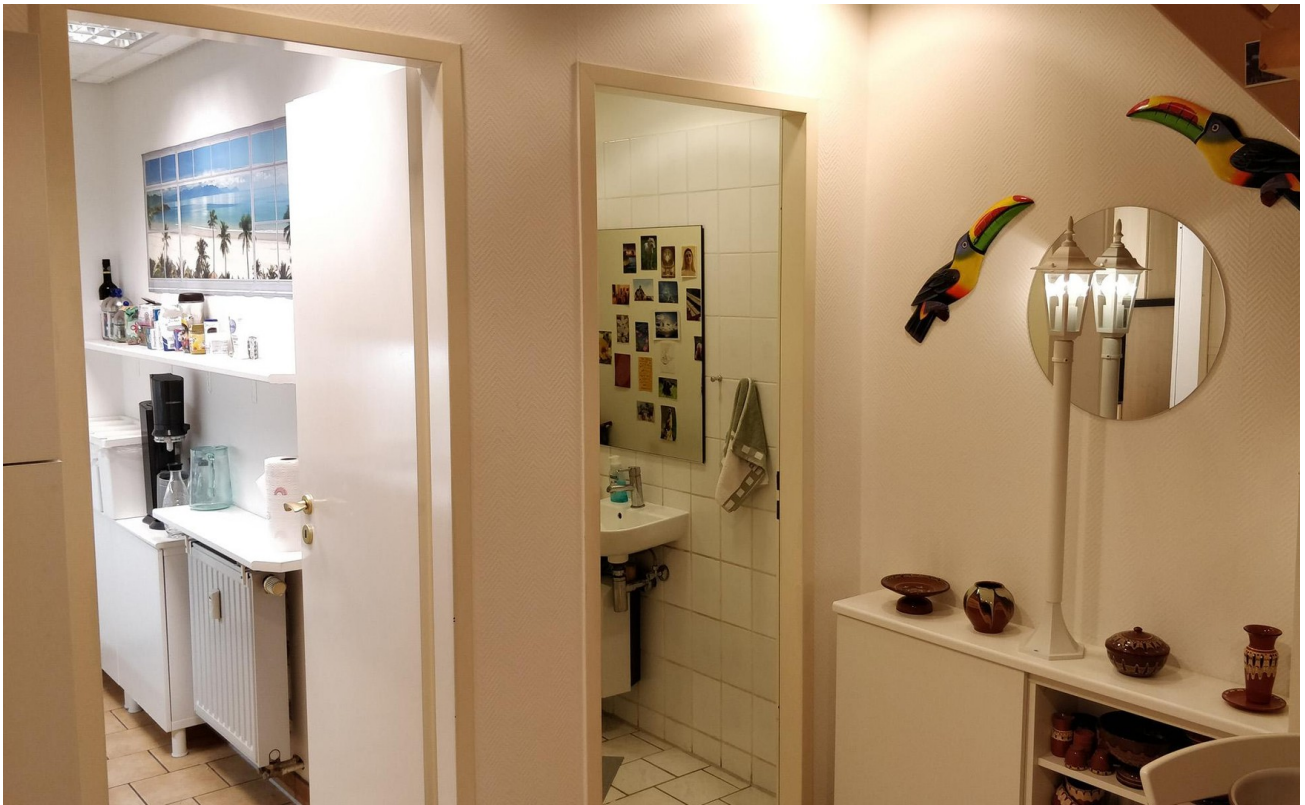
Flurraum - Links