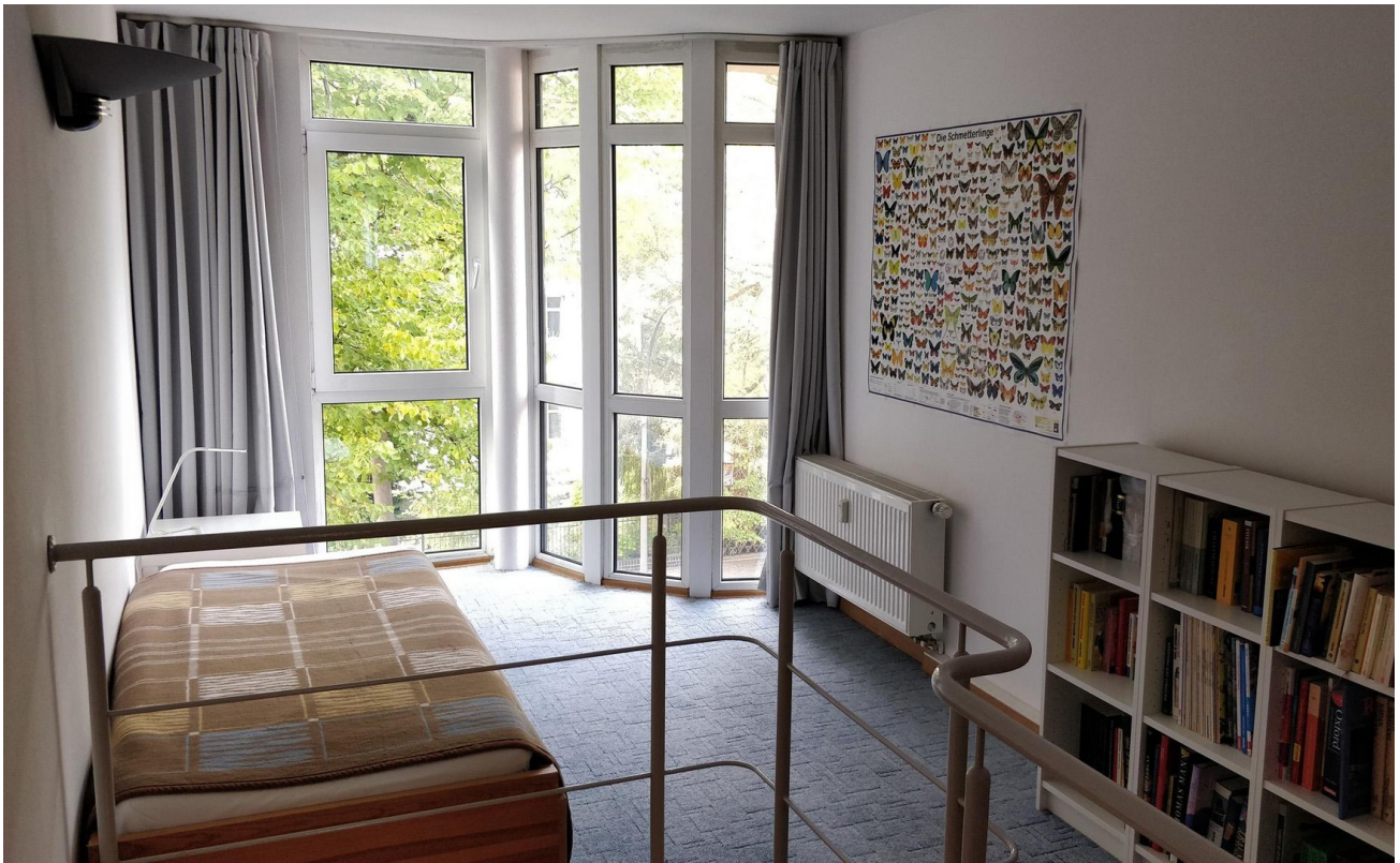
Schlafzimmer 2 (NW-Seite) - L