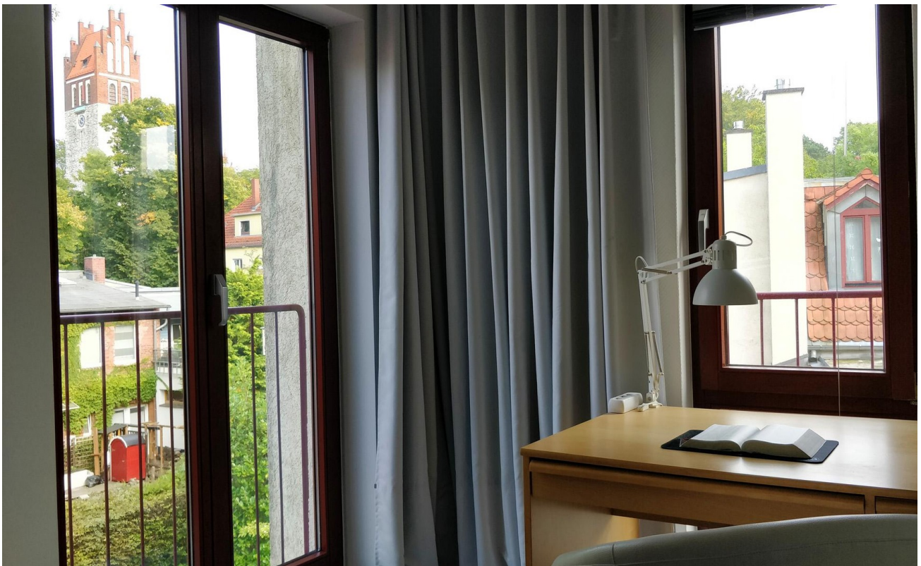
Schlafzimmer 2 (SO-Seite) - L