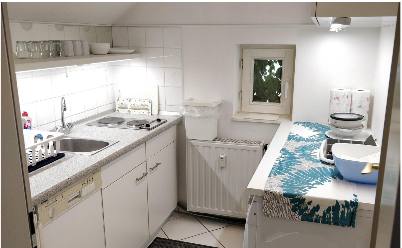
Kleine Küche 1 - Rechts