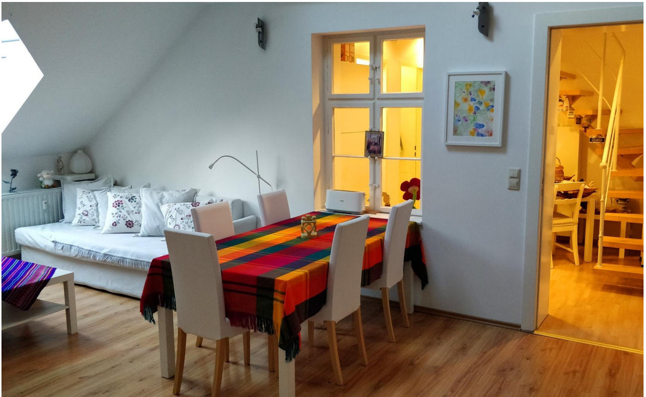
Wohnzimmer (SO-Seite) - Links