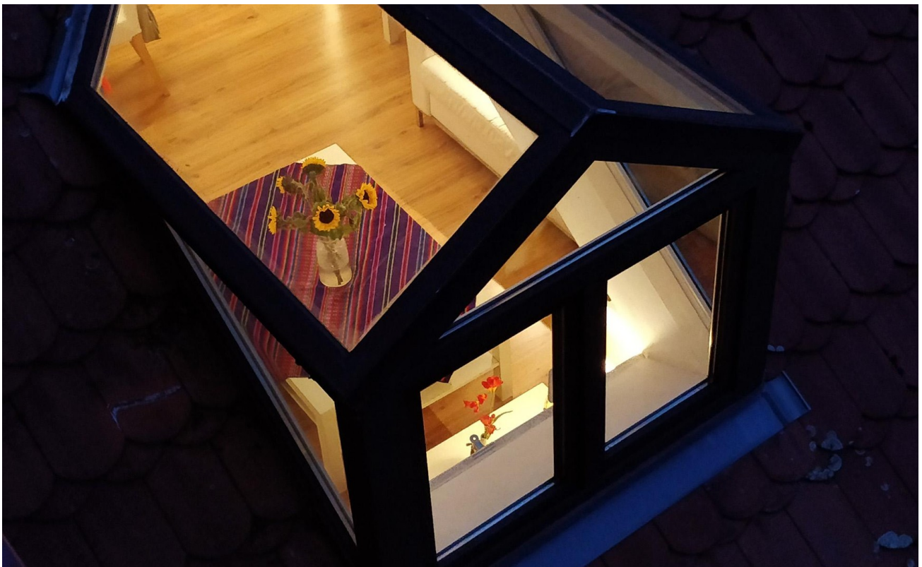
Wohnzimmer (SO-Seite) - Links