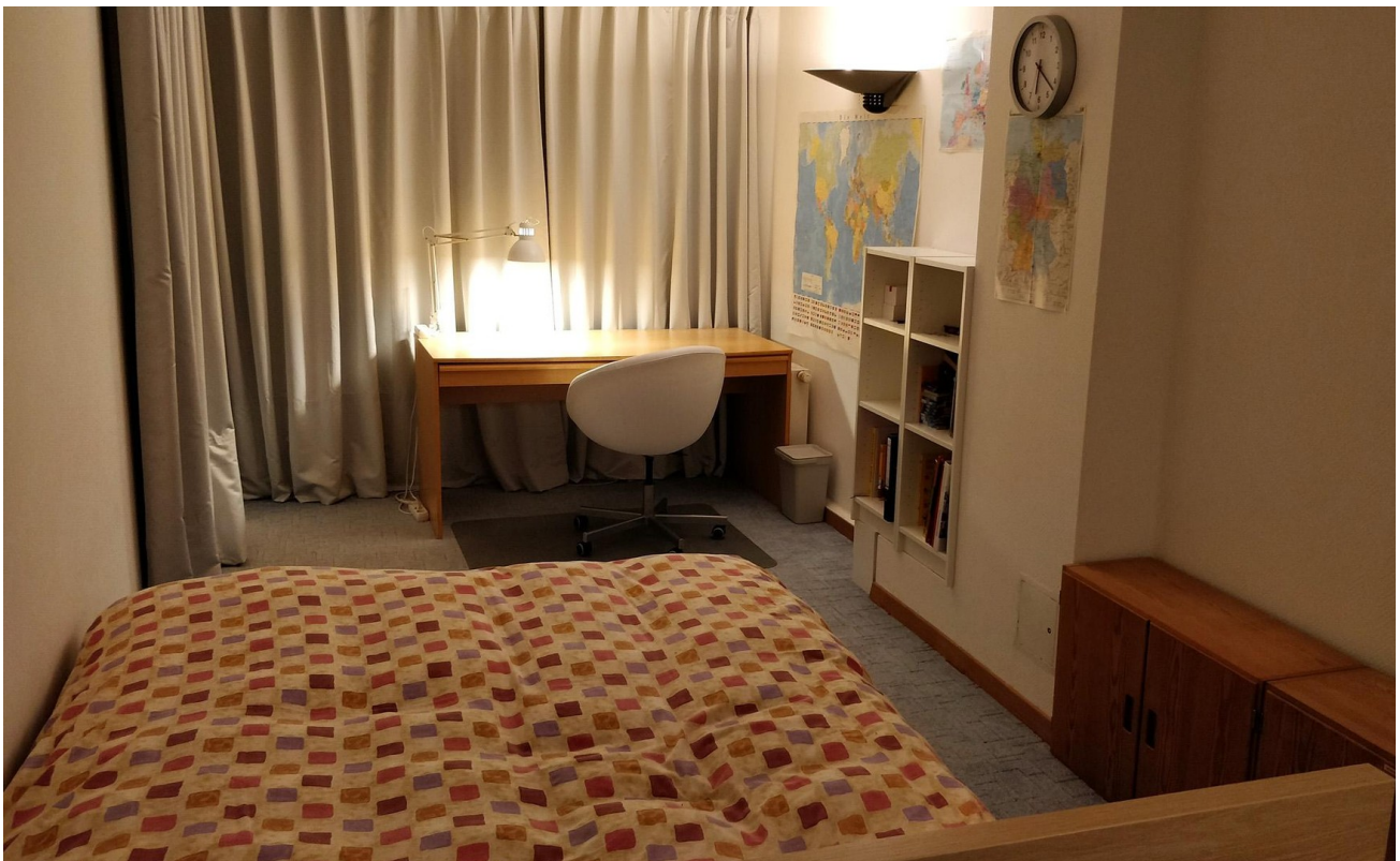
Schlafzimmer 2 (SO-Seite) - L