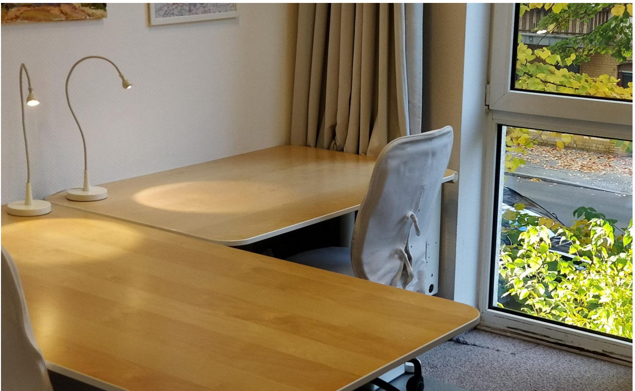
Büro (NW-Aussicht) - Links