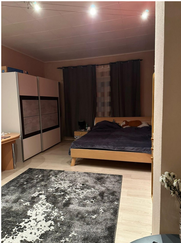
Beispielzimmer WE EG