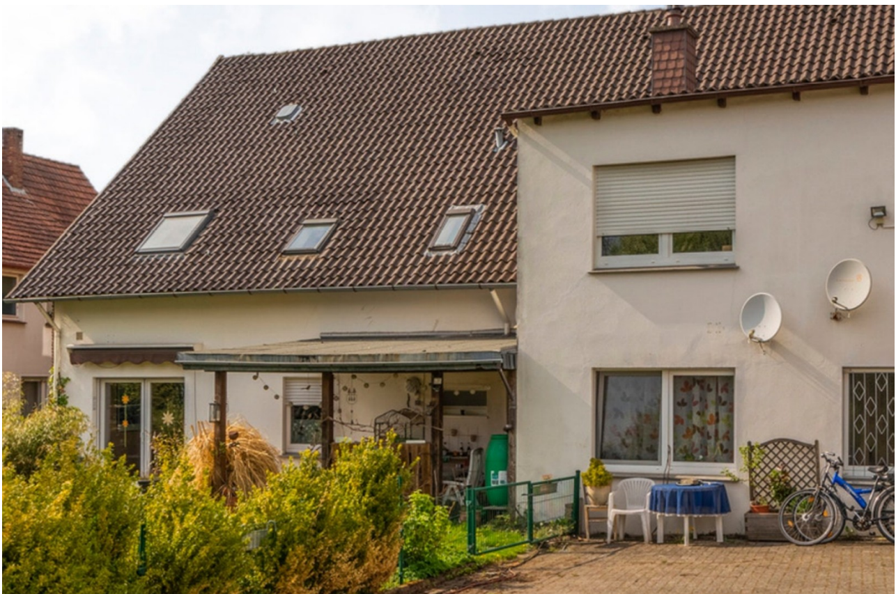
Haus vom Garten