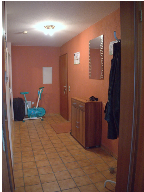
Flur mit Blick zur Eingangstür