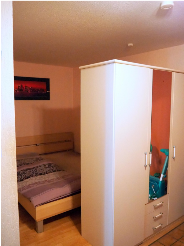
Schlafnische Flur o. Fenster