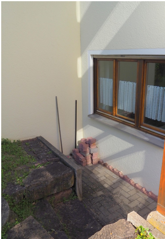
Terrasse vor der Küche