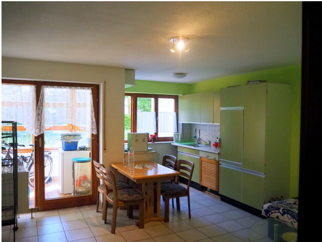
Küche und Wohnraum