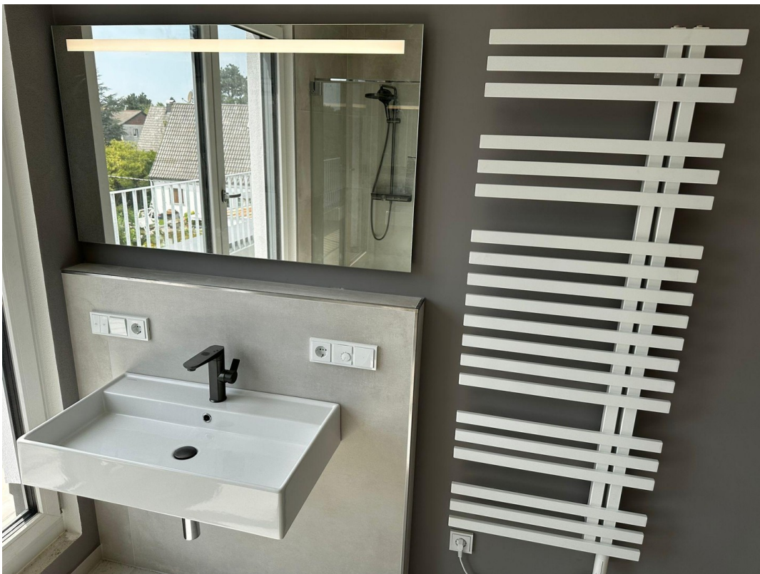
höchstwertige Bad Ausstattung