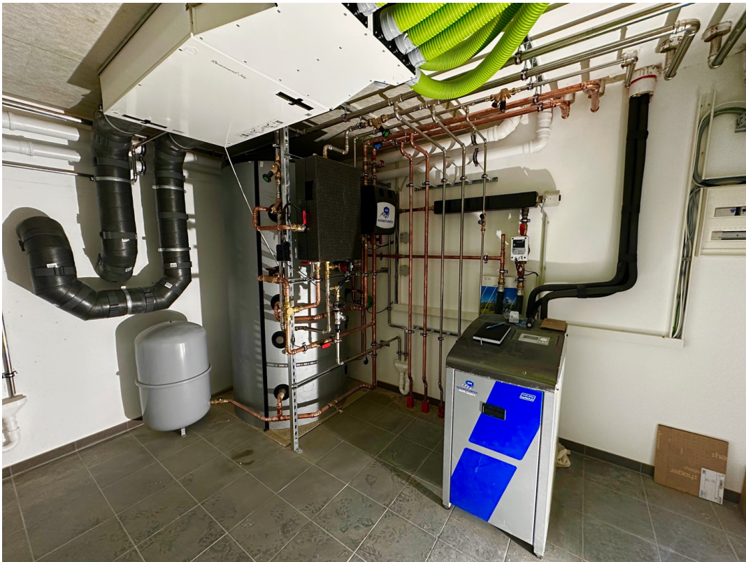
WP + Lüftungstechnik