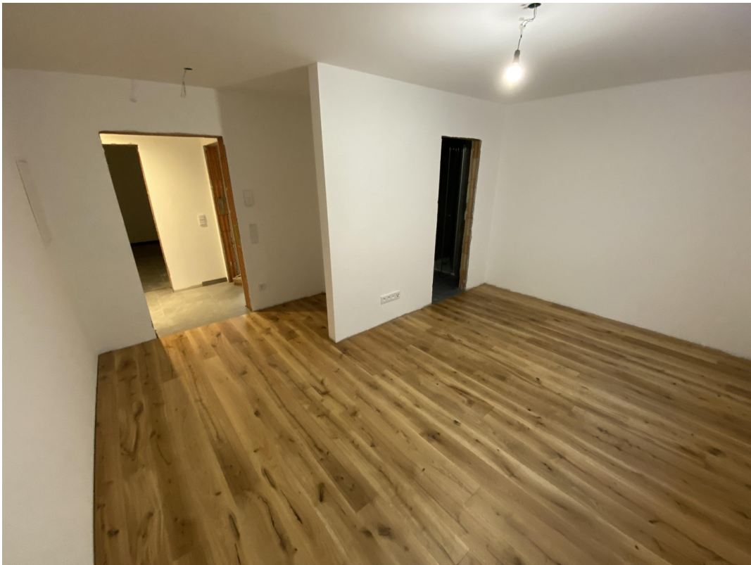
Hobby "Einliegeraum" mit Bad