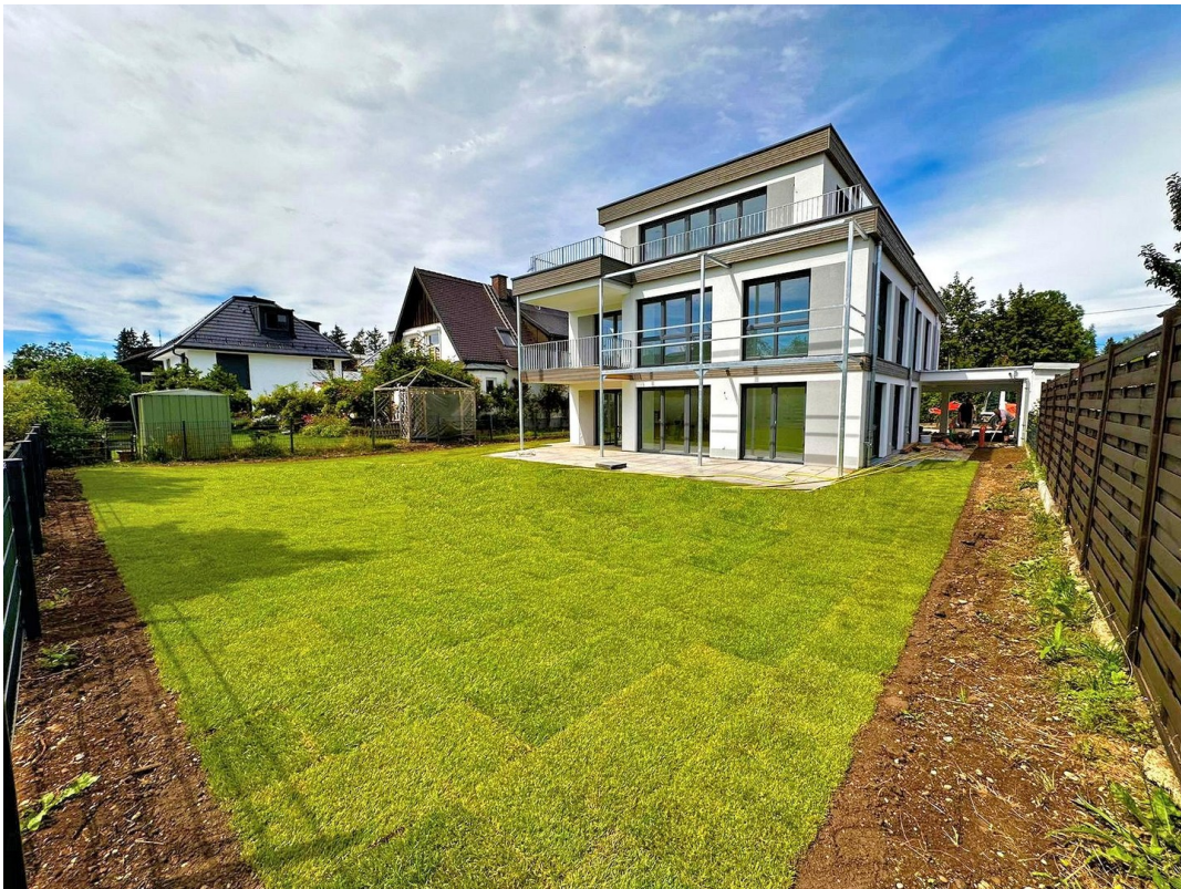
230 m 2 Privatgarten