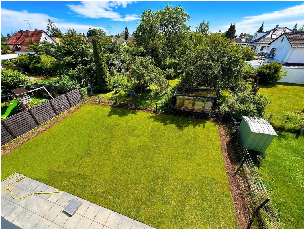
Garten von oben