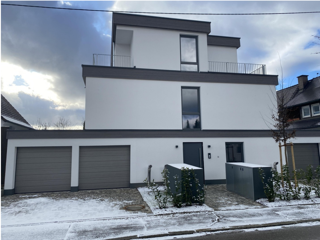
aktuelle Ansicht Norden