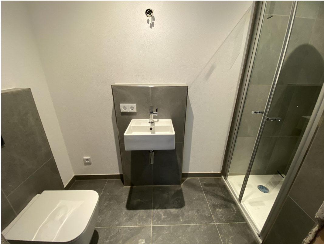
Duschbad im Hobbraum