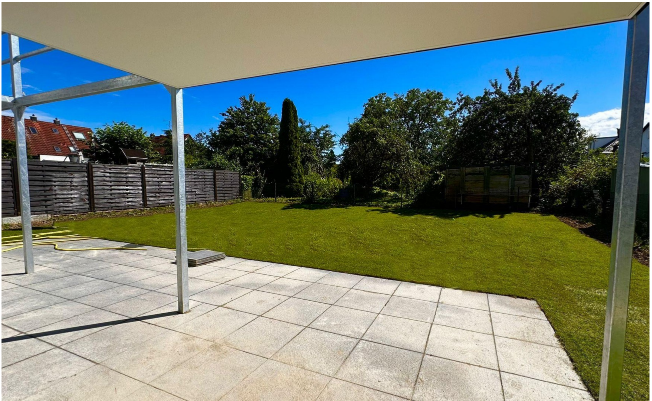
Blick in den Privatgarten