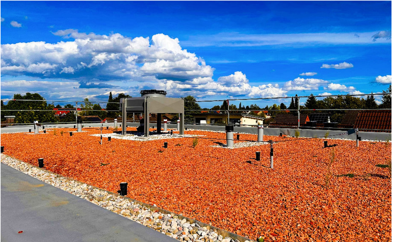
Wärmepumpe auf dem Dach