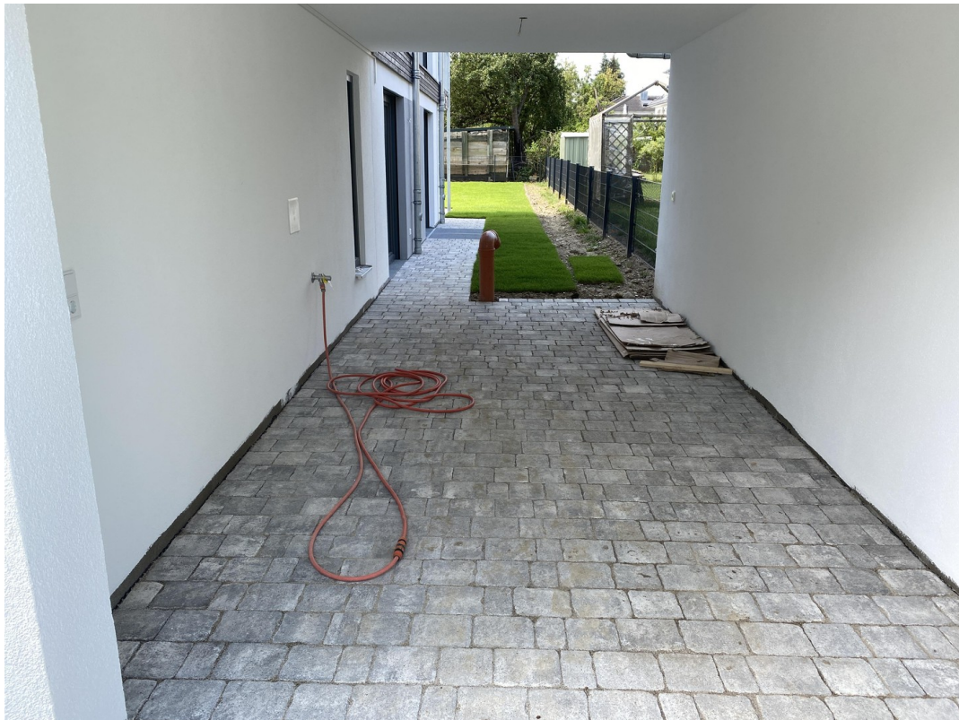
Einzelgarage mit Gartenzugang