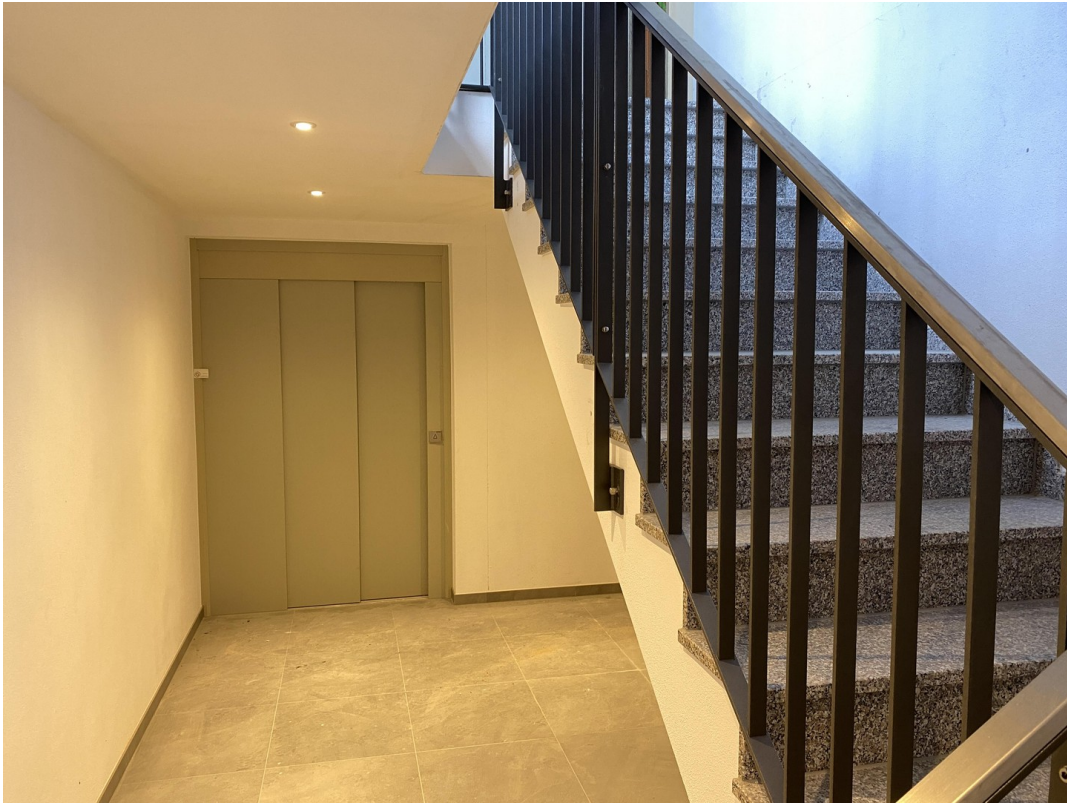
Treppenhaus mit Lift