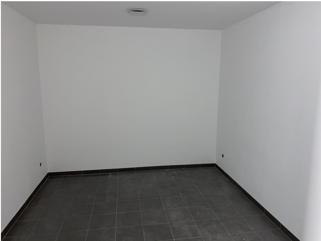
Kellerraum, beheizt, belüftet