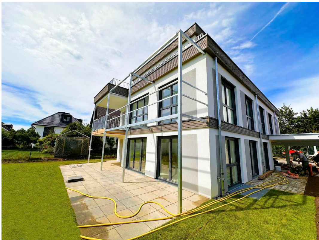
Südfassade mit großer Terrasse