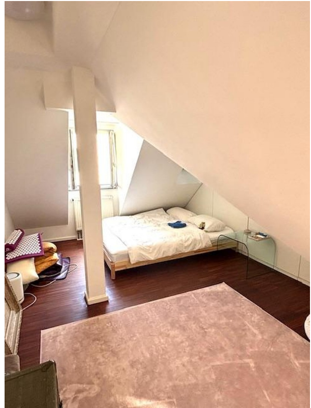
Schlafzimmer im DG