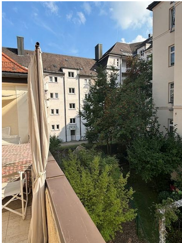
Blick in den Innenhof