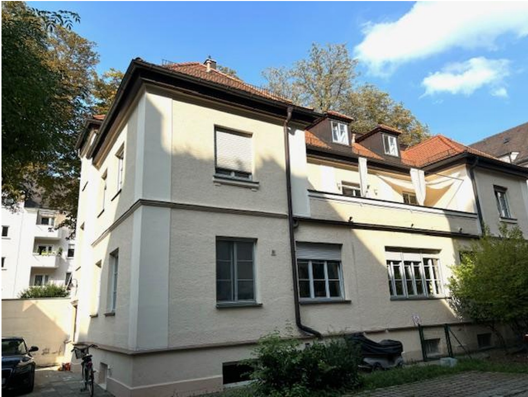
Haus im RGB