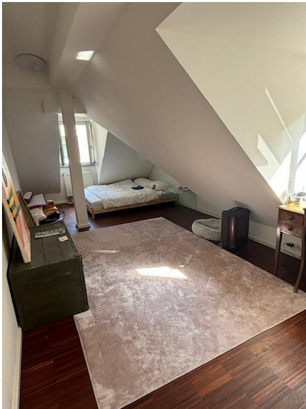
Schlafzimmer im DG