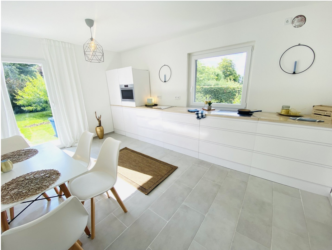
Küche / Essbereich Erdgeschoss