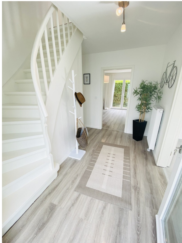
Flur / Treppenaufgang