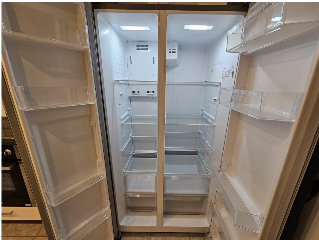
Küche, neuer Kühlschrank