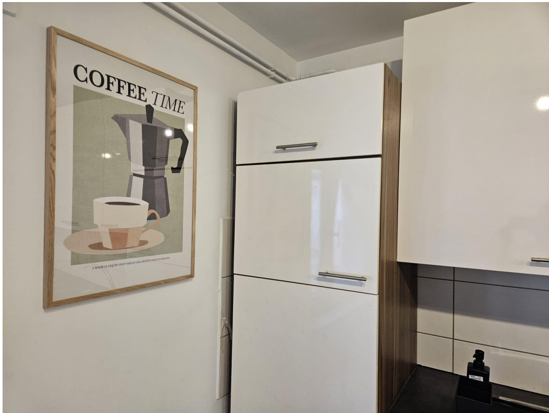
neue Einbauküche, Esszimmer