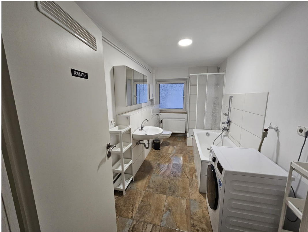
Bad 2, neue Waschmaschine