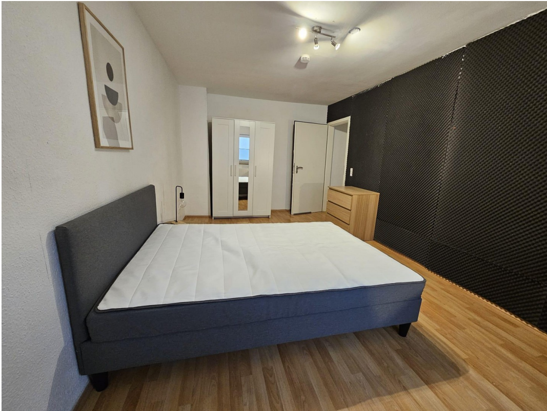
neu möbliertes Zimmer