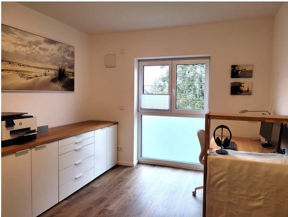
Arbeits- / Kinderzimmer