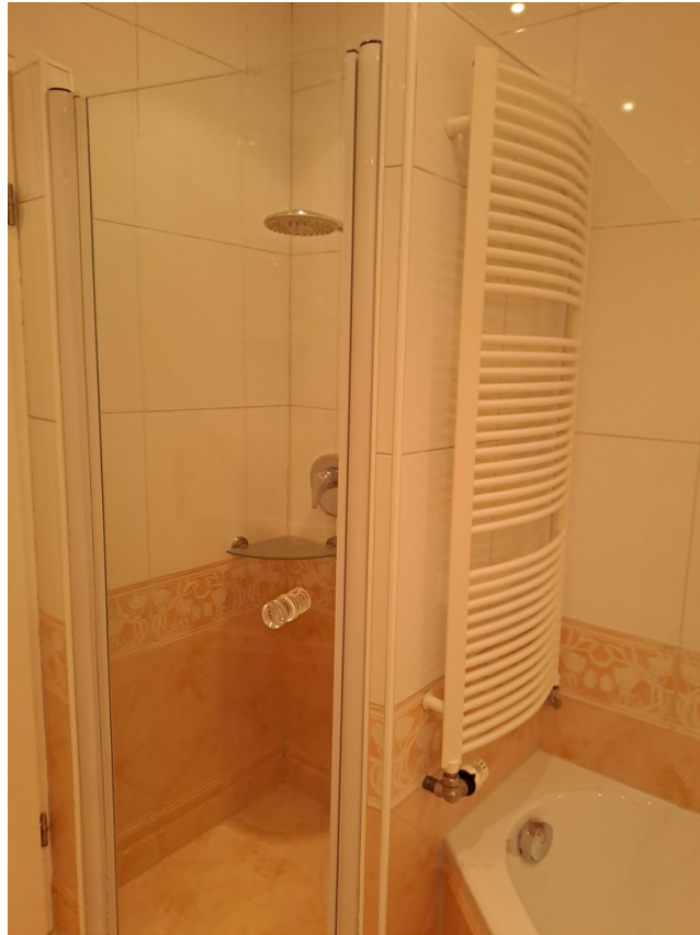
Vollbad im EG