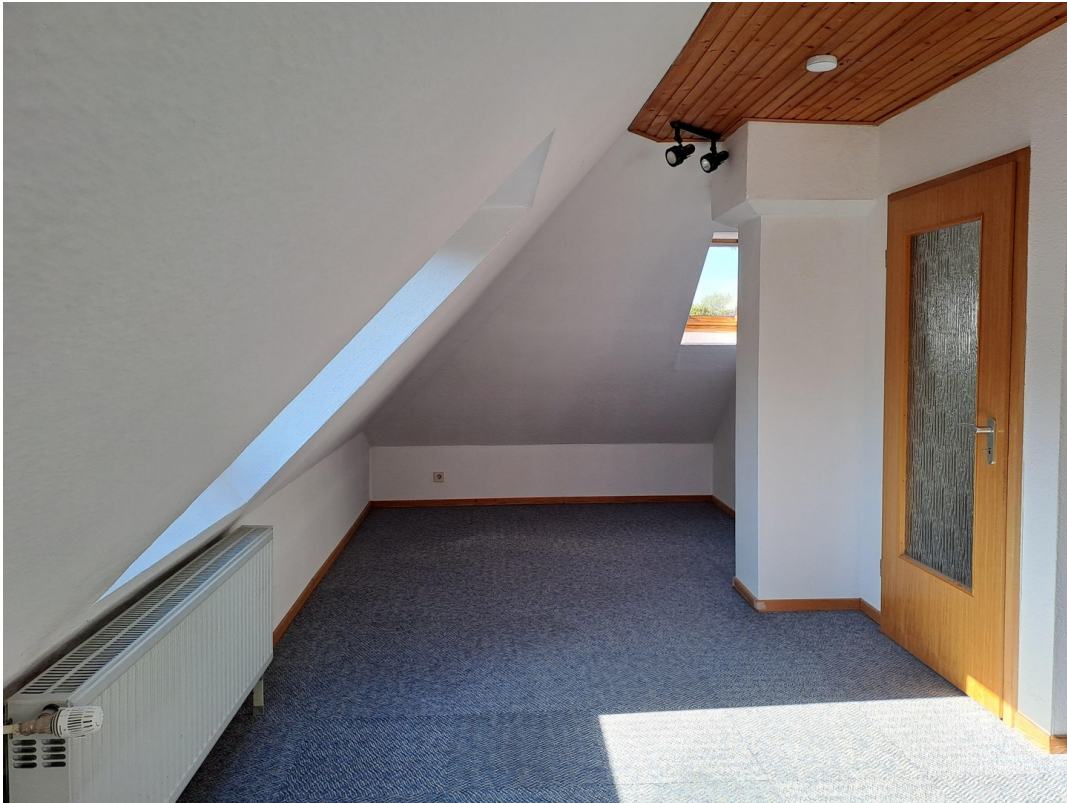
Zimmer im OG II