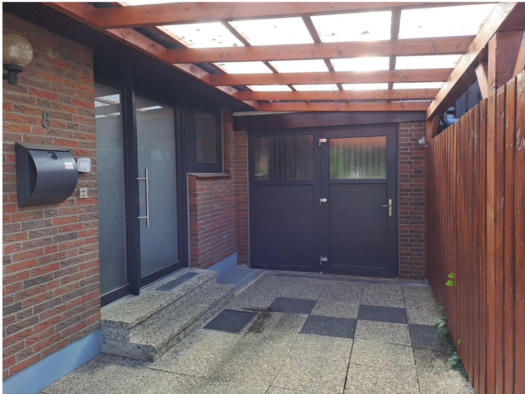
Hauseingang mit Garage/Carport