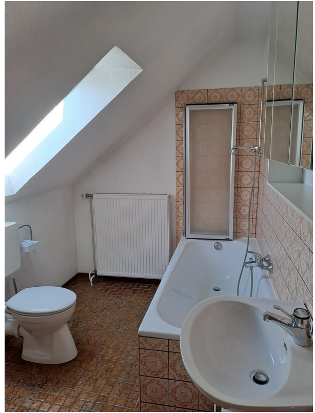
Vollbad im OG