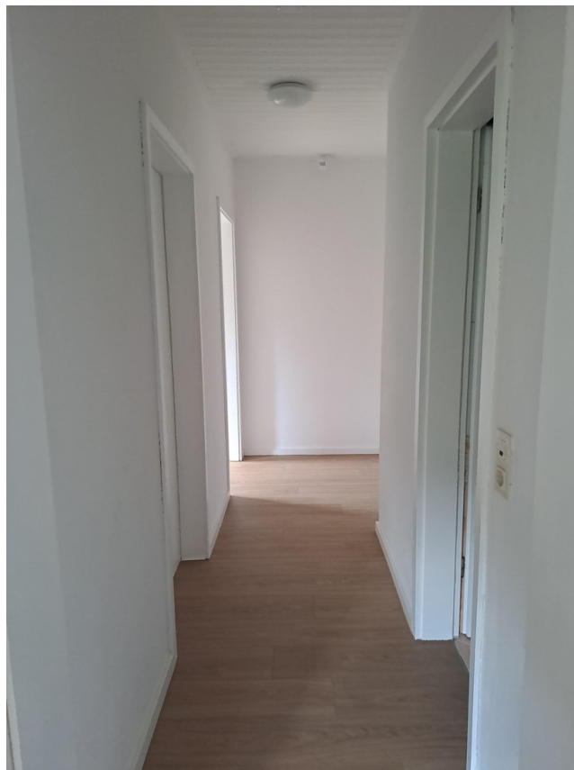
Flur im EG