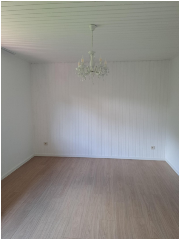
Zimmer im EG II