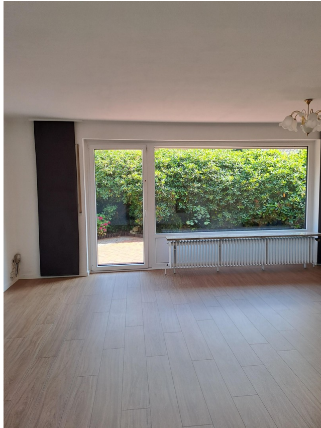
Wohnzimmer im EG