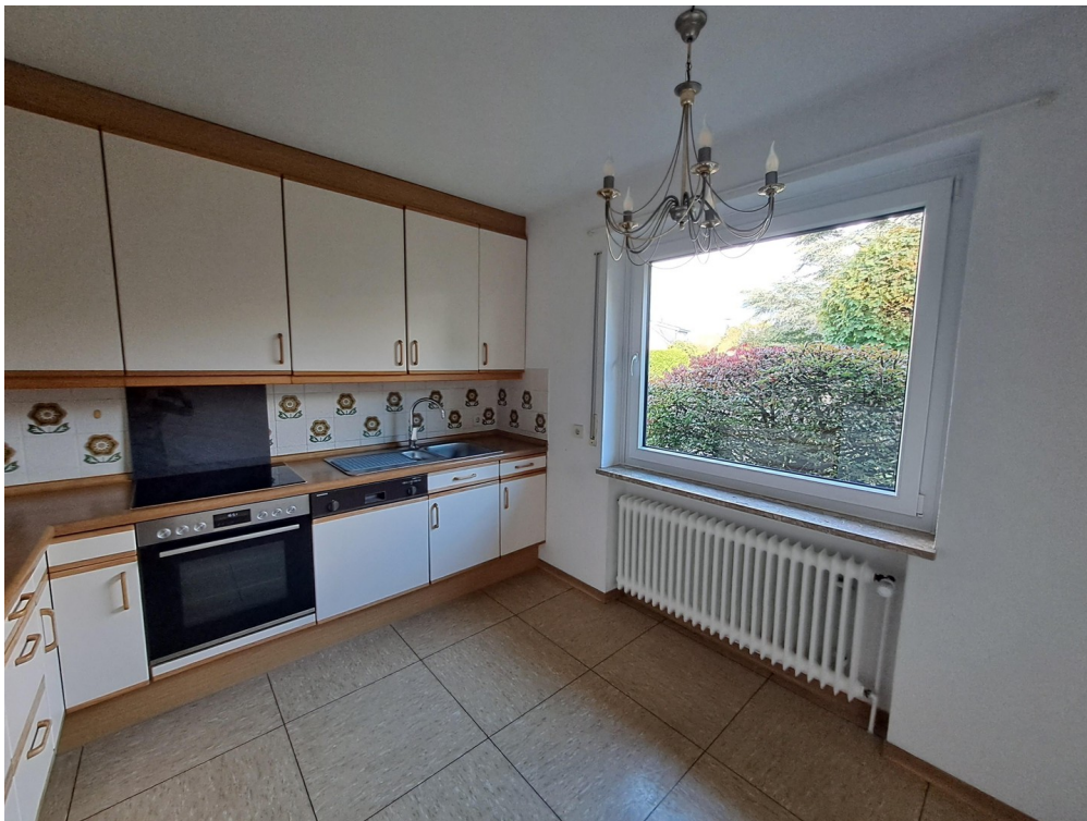
Küche im EG