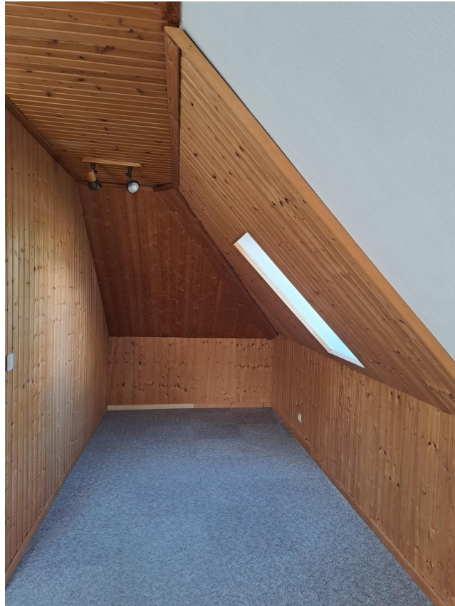
Zimmer im OG I