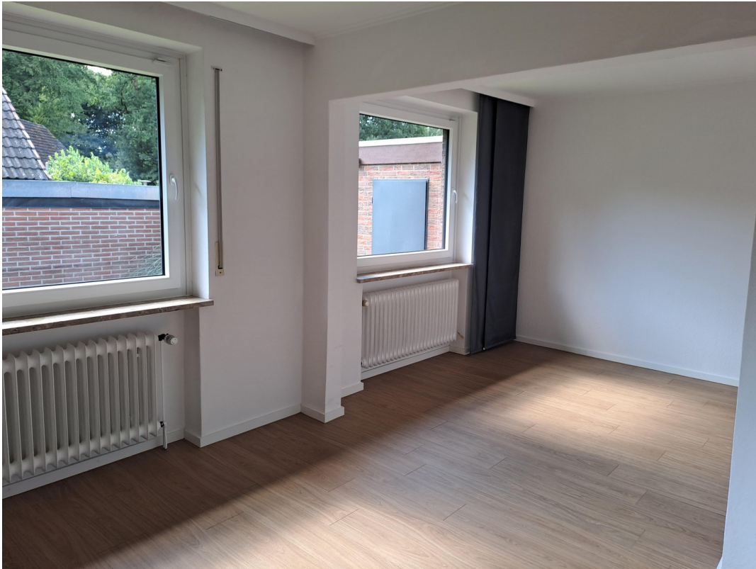
Zimmer im EG I