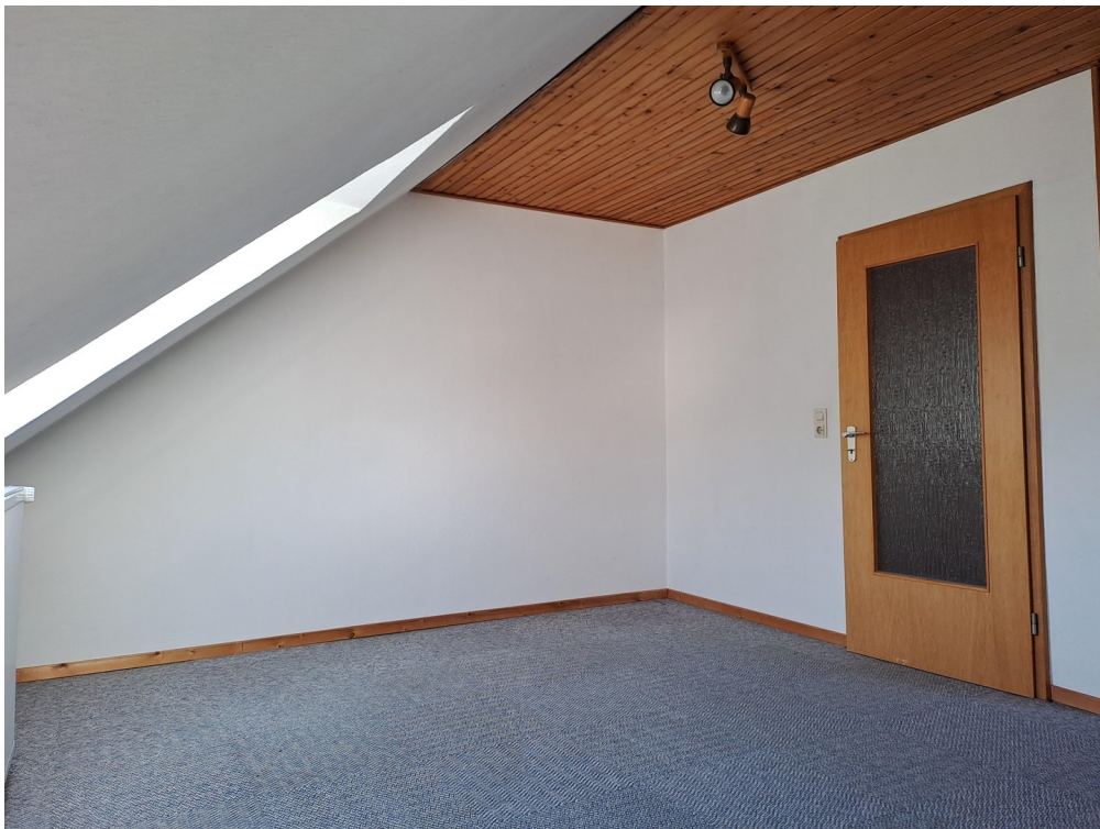
Zimmer im OG I