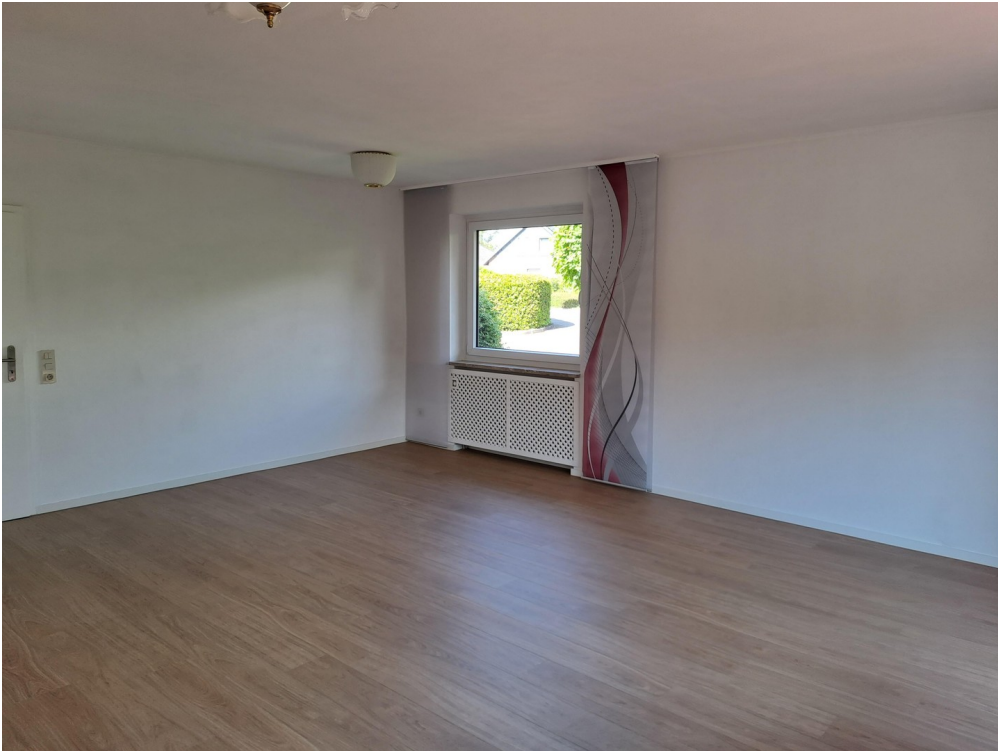
Wohnzimmer im EG