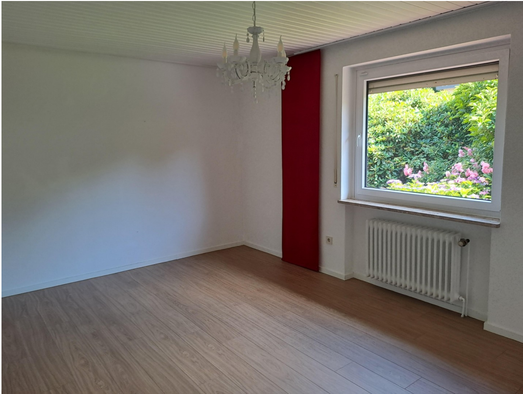
Zimmer in EG II