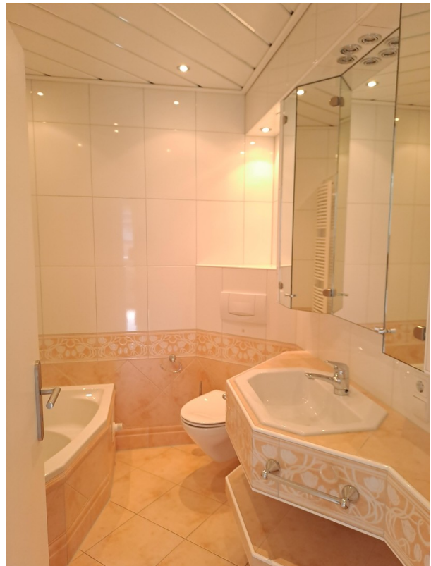
Vollbad im EG