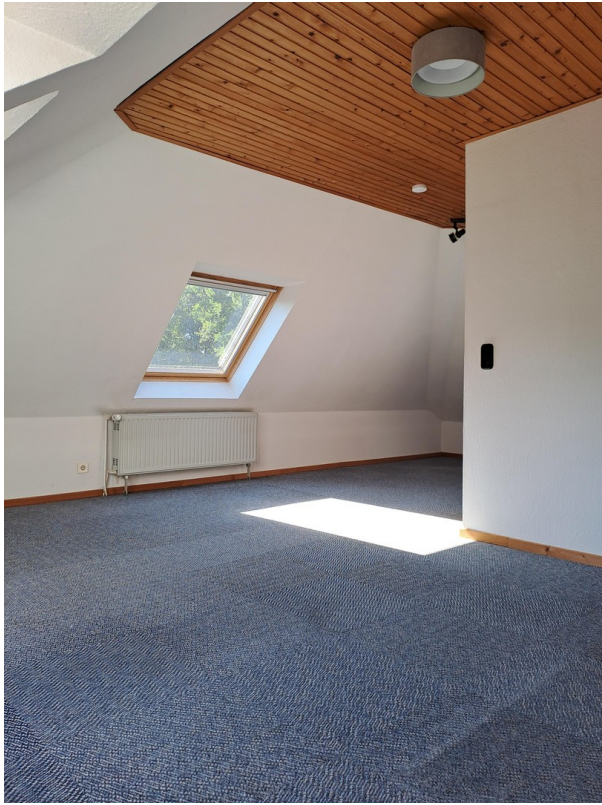
Zimmer im OG II