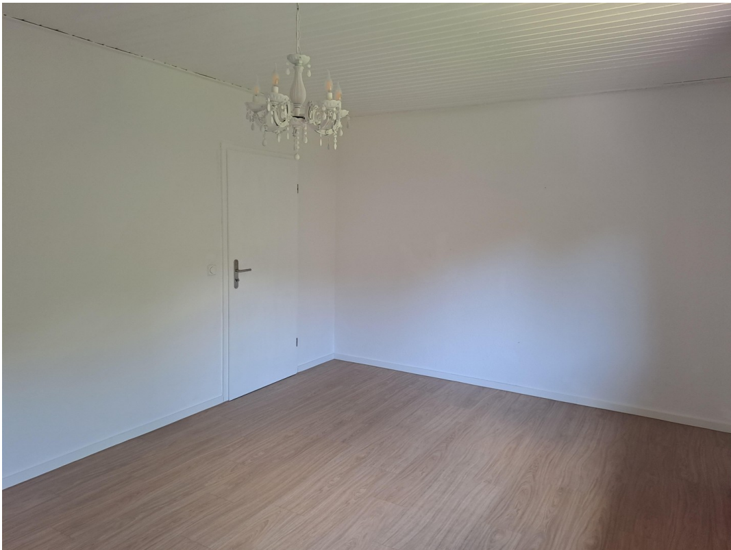
Zimmer im EG II