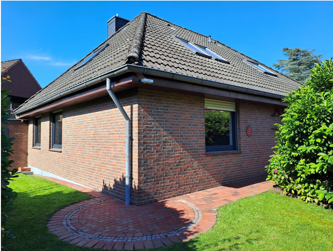
Südansicht Haus und Garten