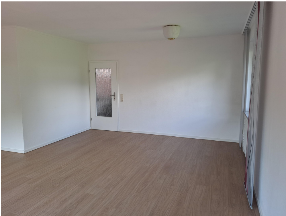
Wohnzimmer im EG