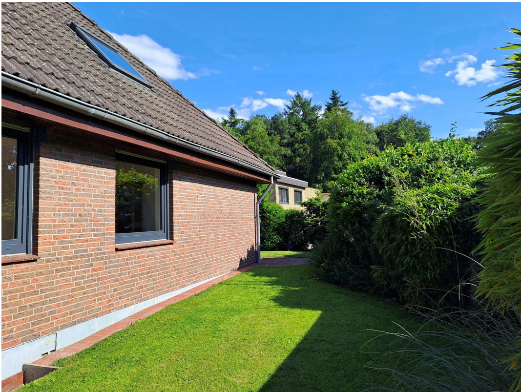
Seitenansicht Hinterseite Haus