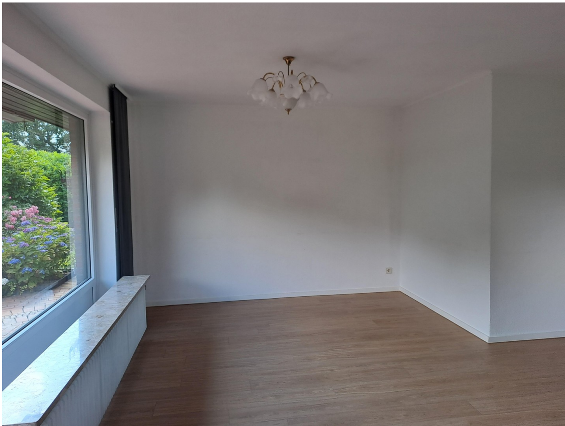
Wohnzimmer im EG