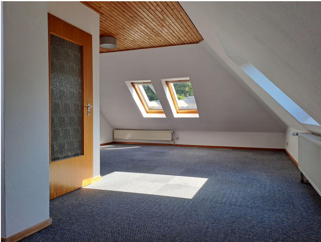
Zimmer im OG II