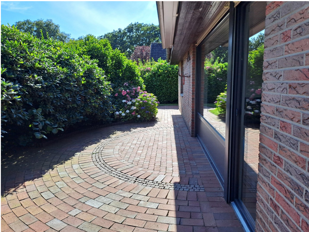
Terrasse in Südlage