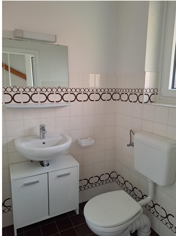
Gäste-WC im EG