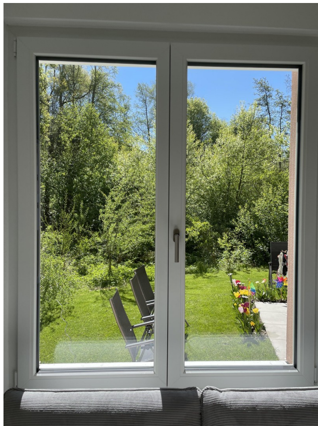
Blick aus dem Wohnzimmer