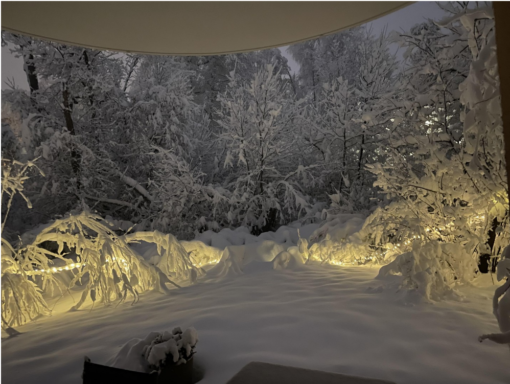
Blick Terrasse Garten (Winter)