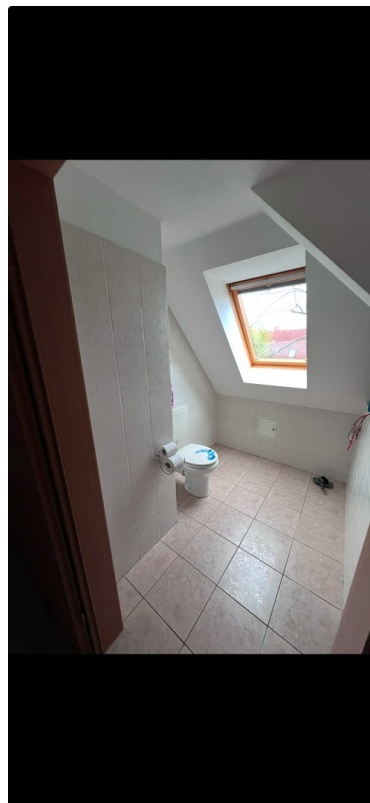
Toilette mit Fenster