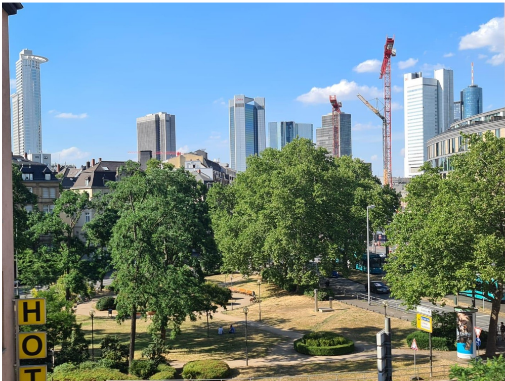
Blick auf Skyline