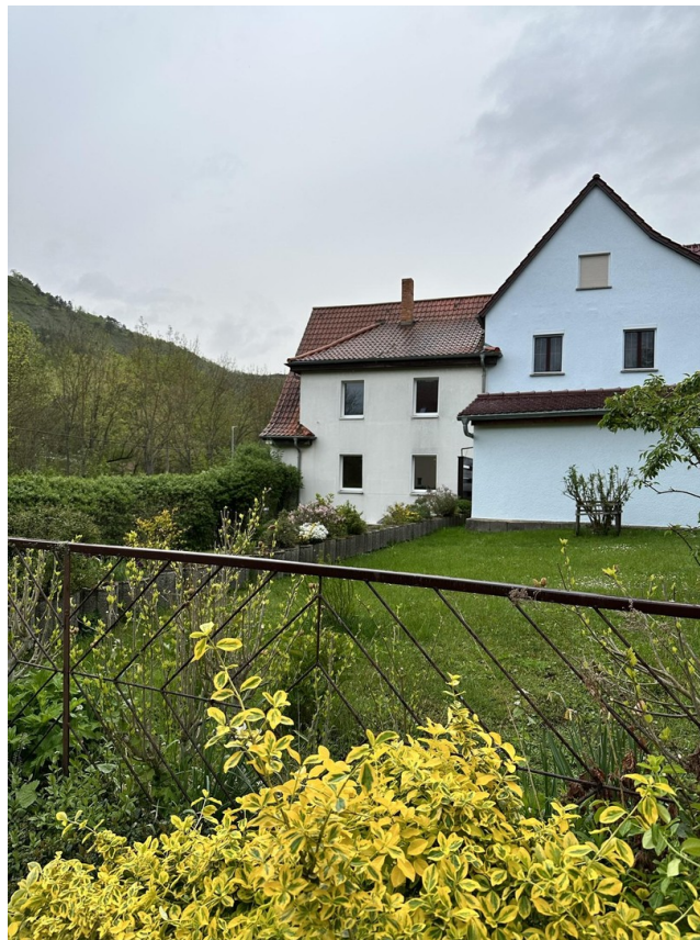
Blick auf das Haus