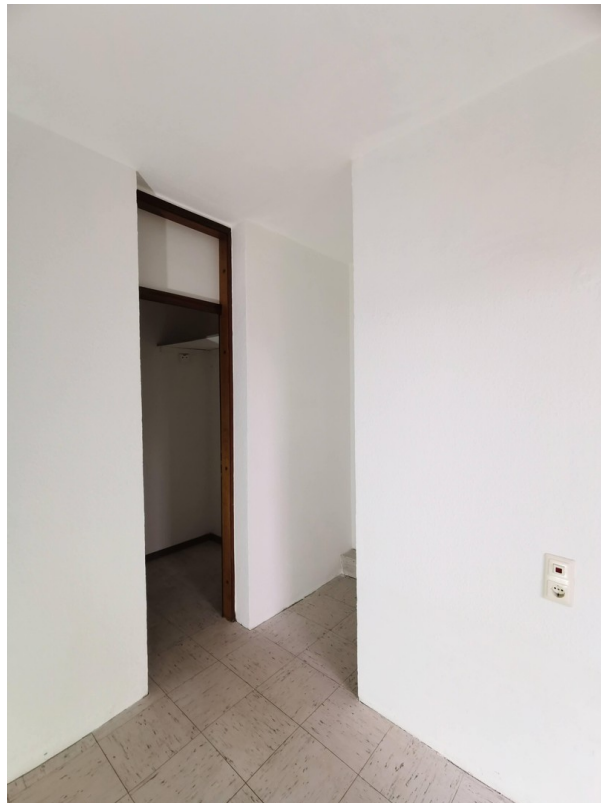
Garderobe und Abstellraum