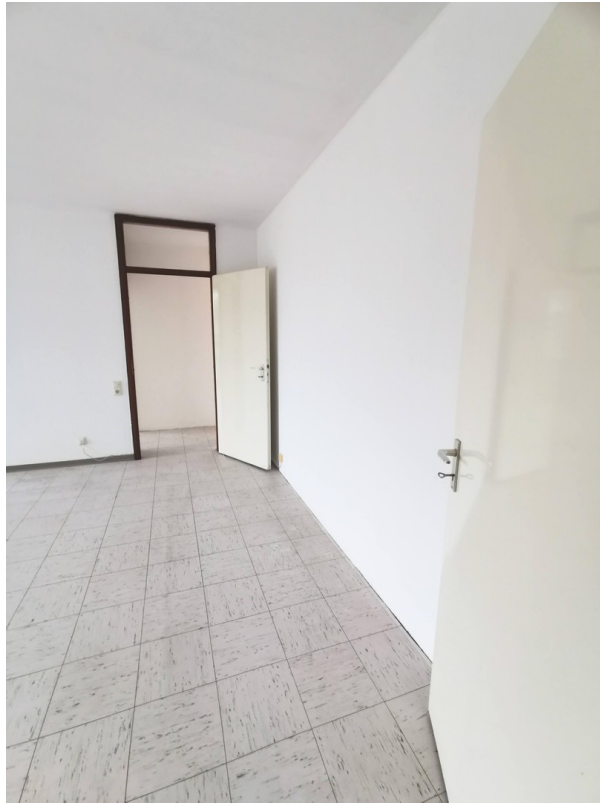
Zugang zum Wohnzimmer