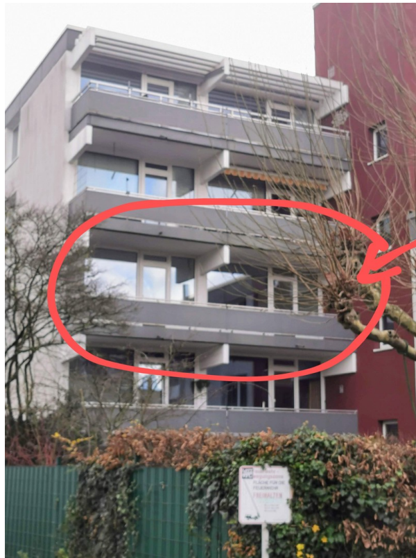
Wohnung Blick in den Garten