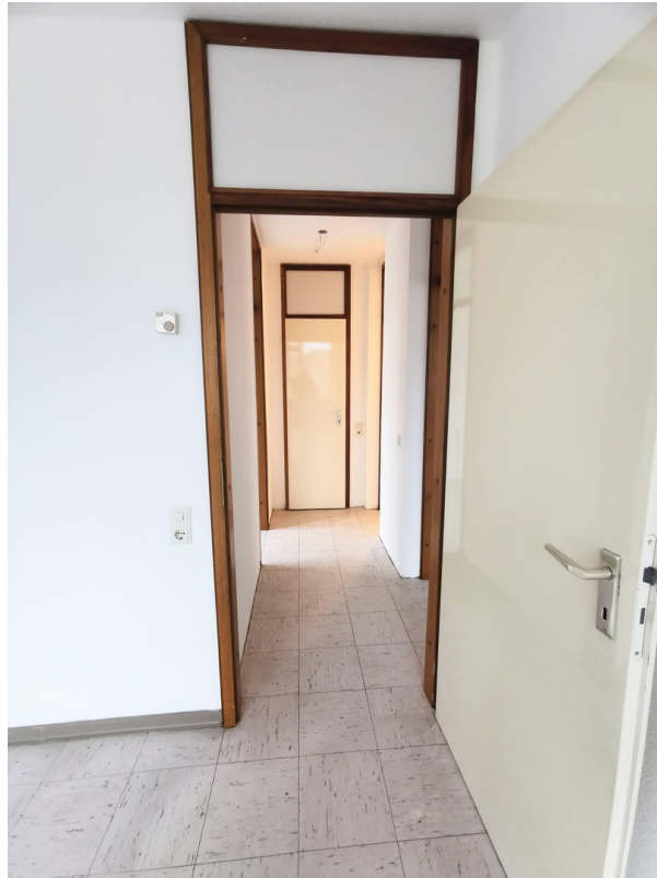
Flur im Schlafbereich