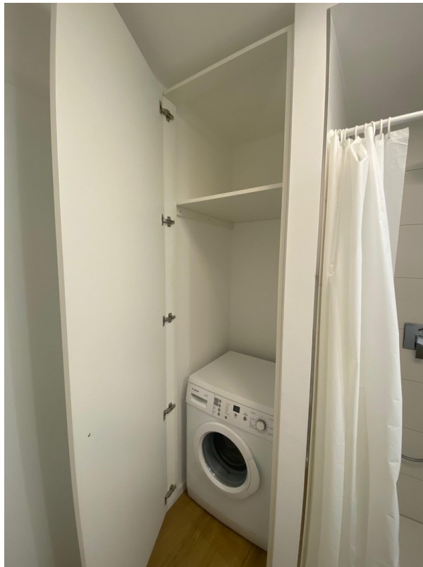
Bad Waschmaschine / Trockner