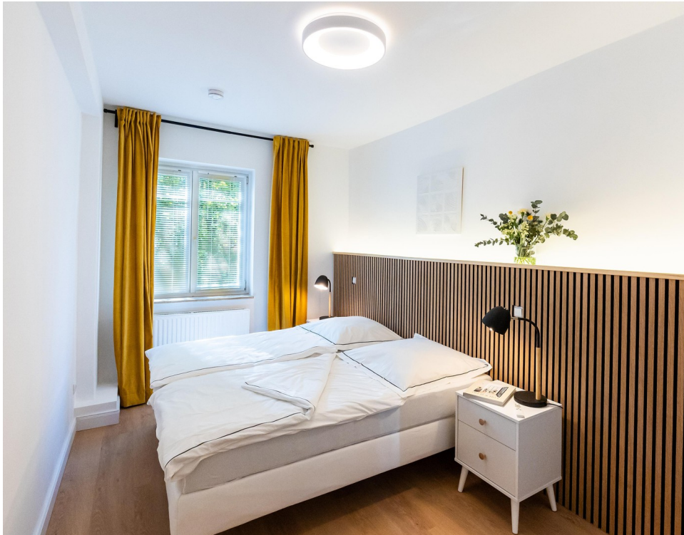
Schlafzimmer 02 Bild 01