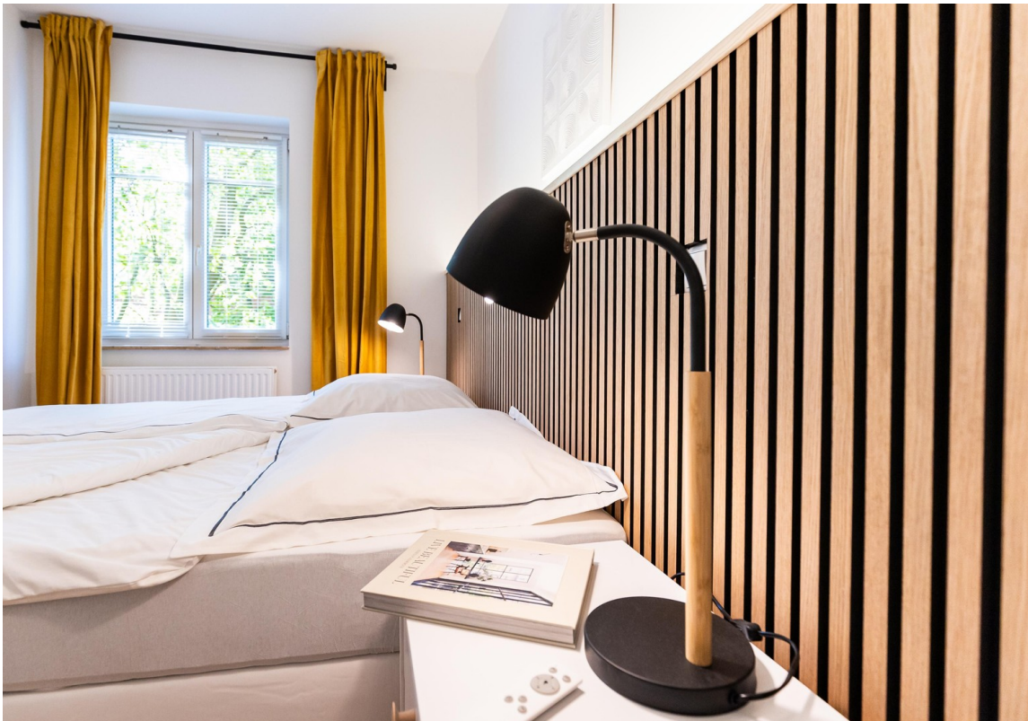
Schlafzimmer 02 Bild 04