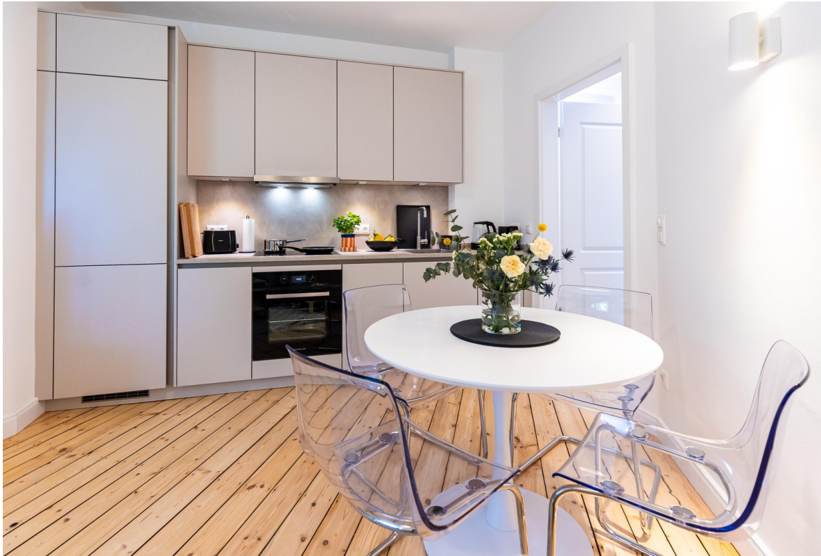
Küche Bild 01