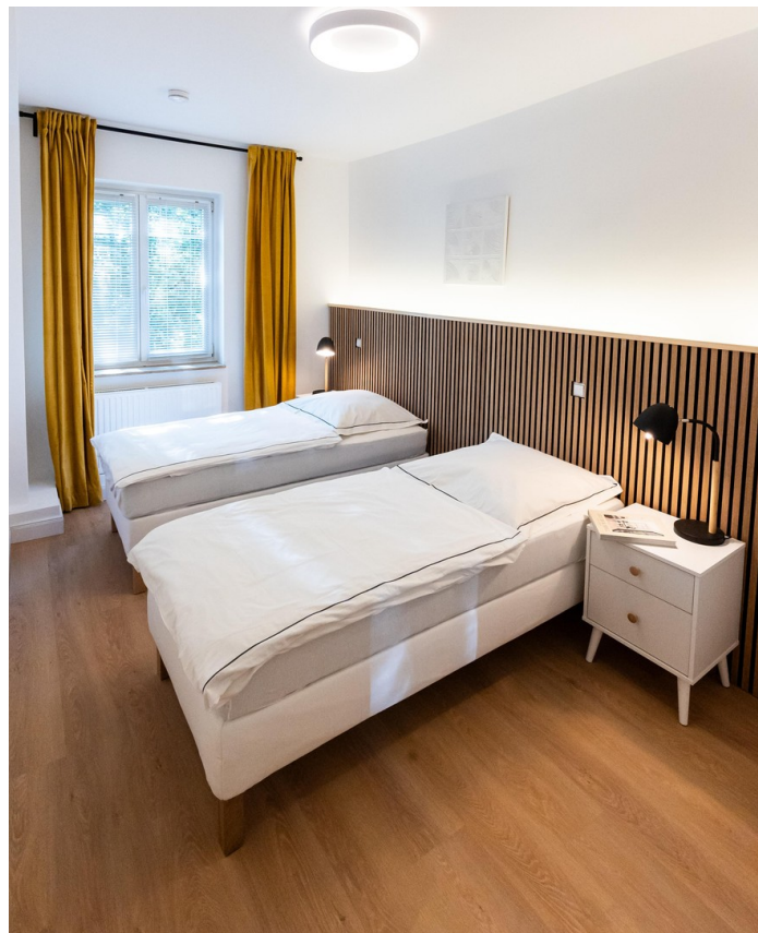
Schlafzimmer 02 Bild 02