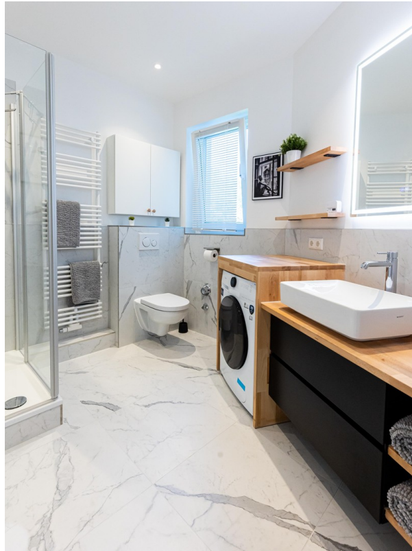
Badezimmer Bild 01