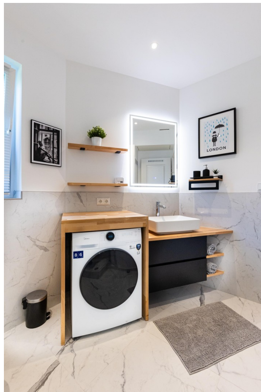
Badezimmer Bild 02