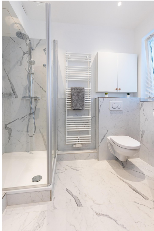
Badezimmer Bild 03