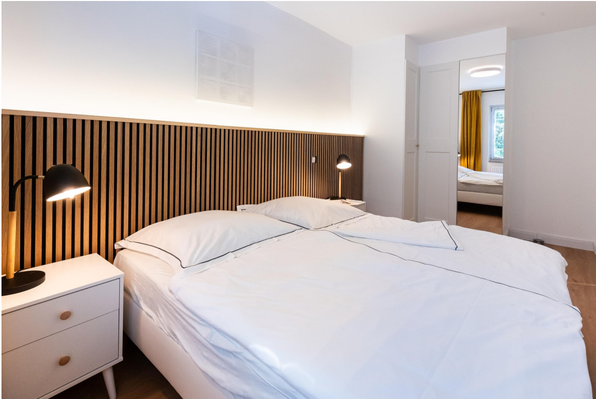
Schlafzimmer 02 Bild 03