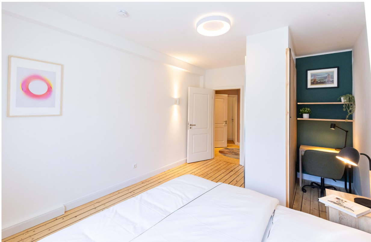
Hauptschlafzimmer Bild 03