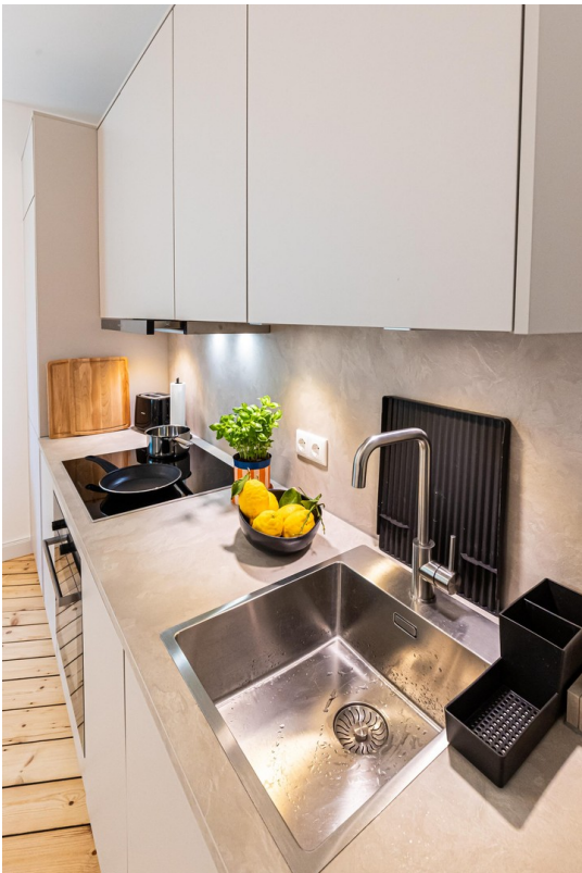
Küche Bild 02