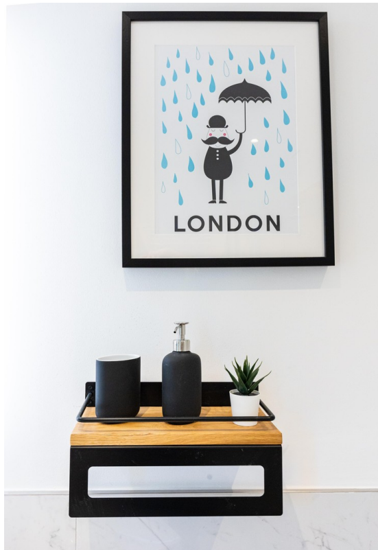
Badezimmer Bild 04