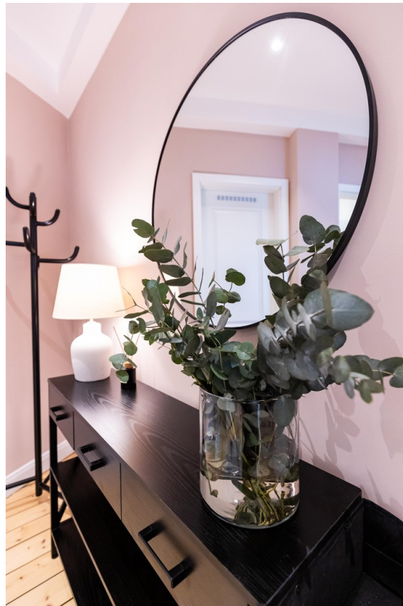
Flur Bild 02