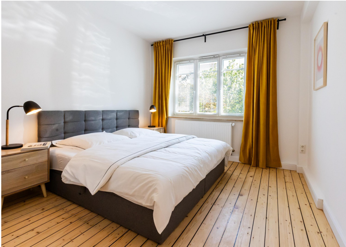
Hauptschlafzimmer Bild 02