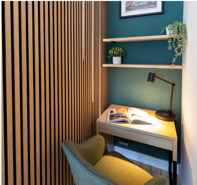
Hauptschlafzimmer Bild 04