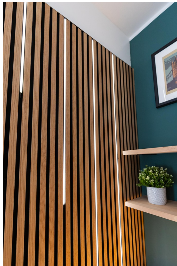
Hauptschlafzimmer Bild 05