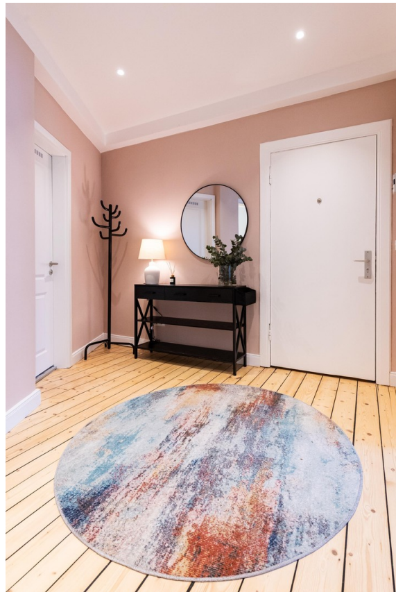
Flur Bild 01