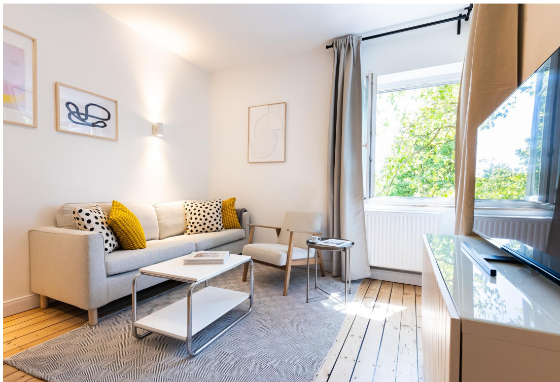
Wohnzimmer Bild 02