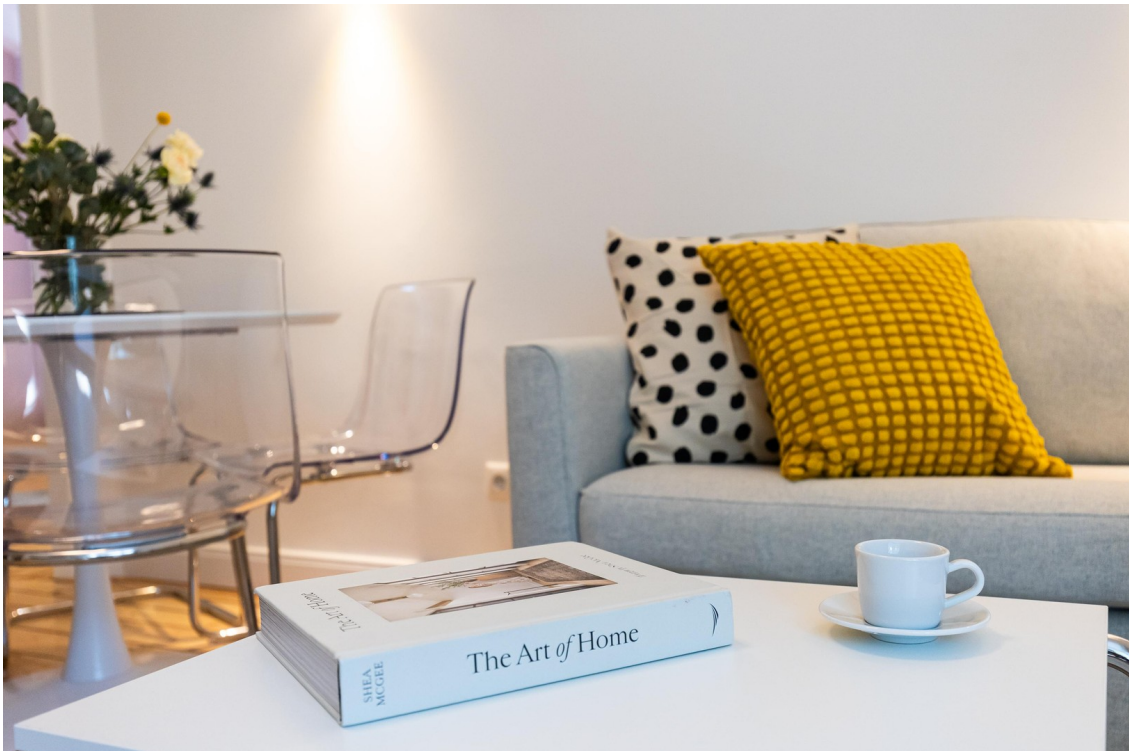
Wohnzimmer Bild 03