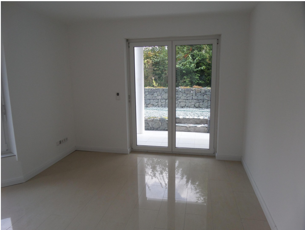
Erkerzimmer KG mit Terrasse