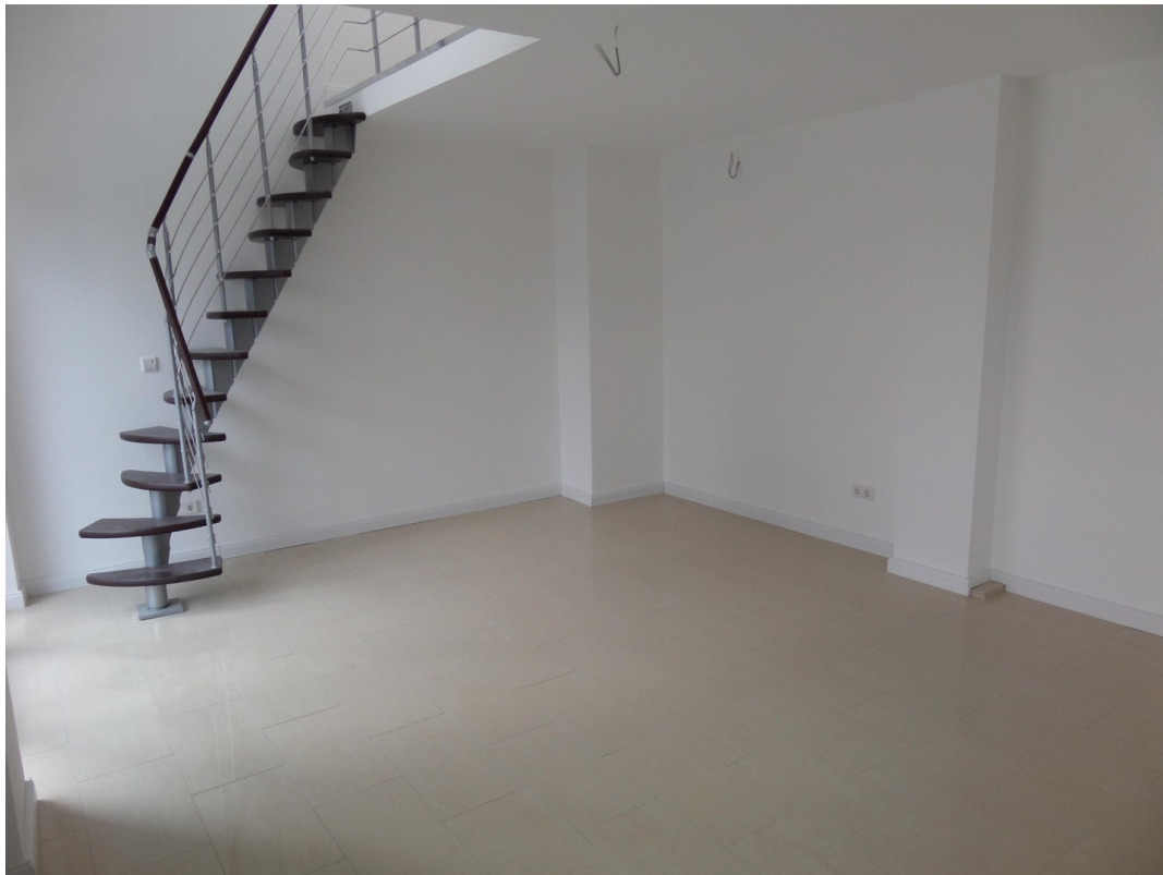
Wohnzimmer EG mit Empore