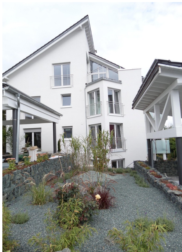
Hausansicht von der Straße