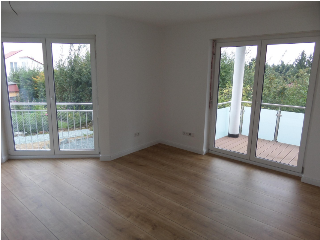
Erkerzimmer EG mit Balkon