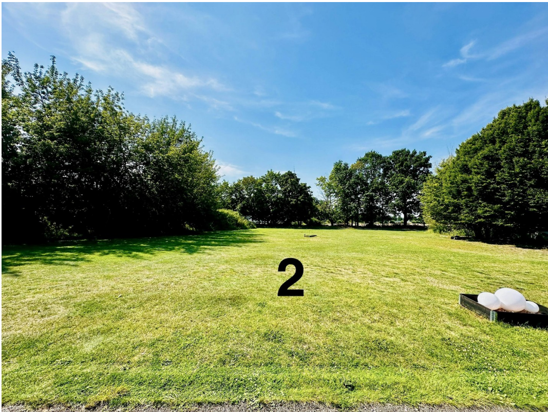
Grdstk 2 Blick Richtung Westen