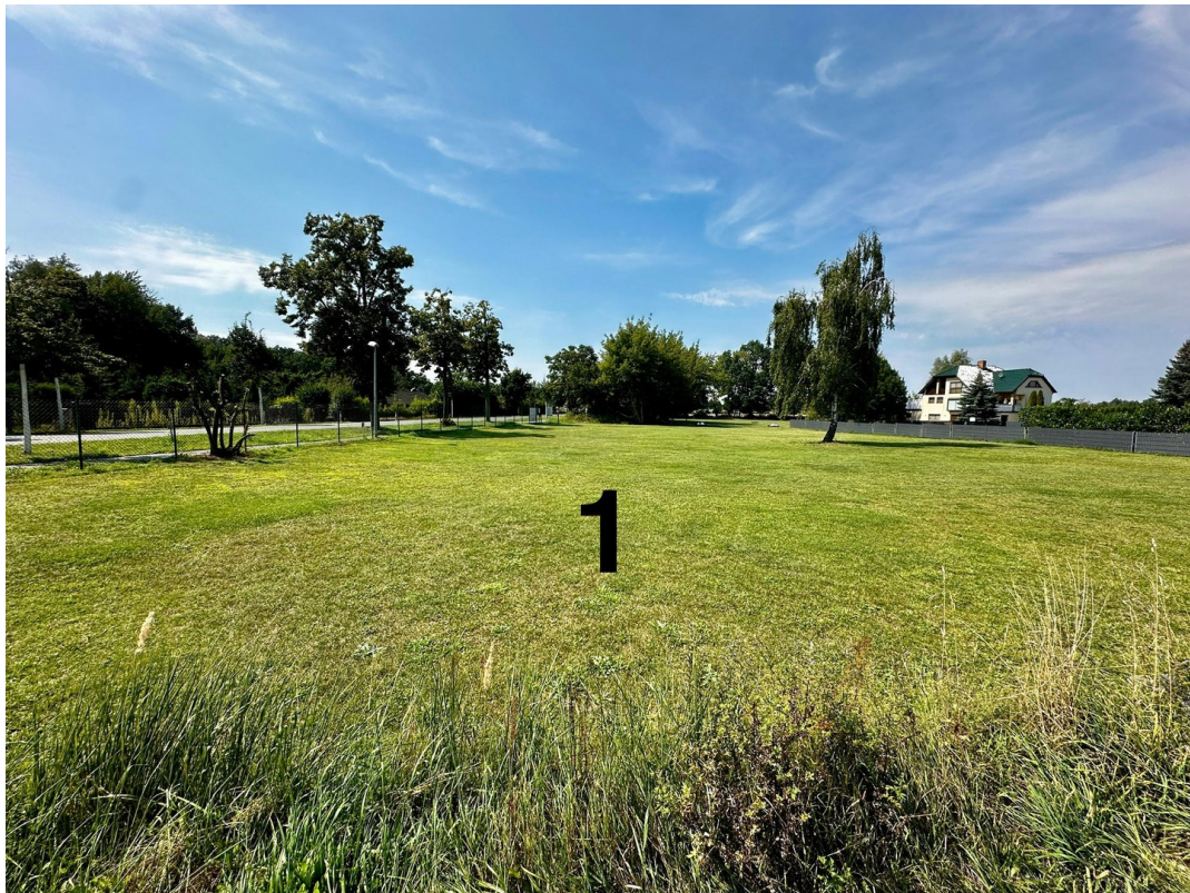
Grdstk 1 Blick Richtung Westen