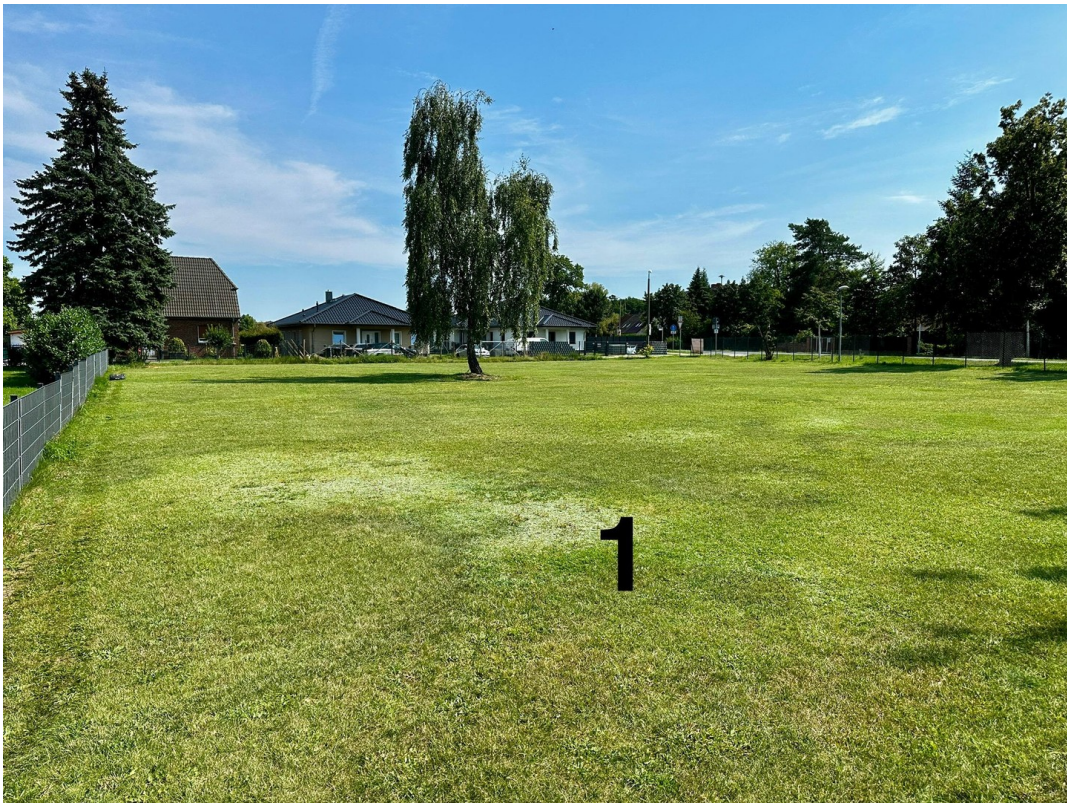
Grdst 1 Blick Richtung Osten