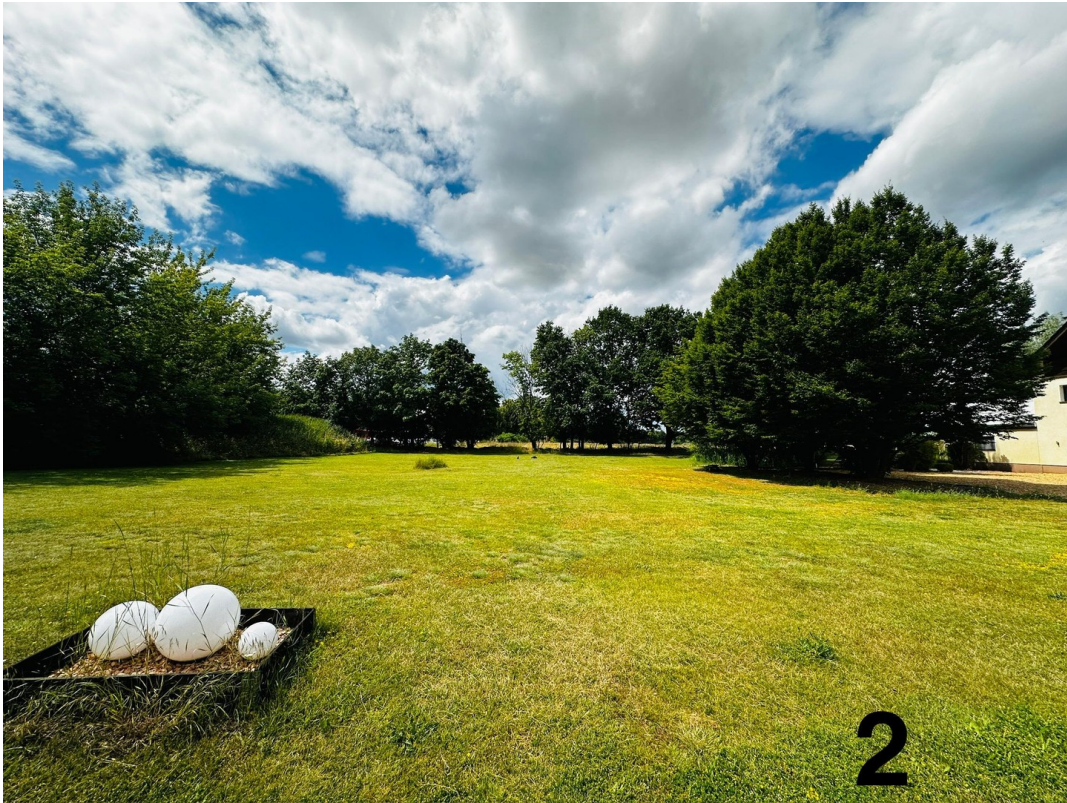
Grdstk 2 Blick Richtung Westen