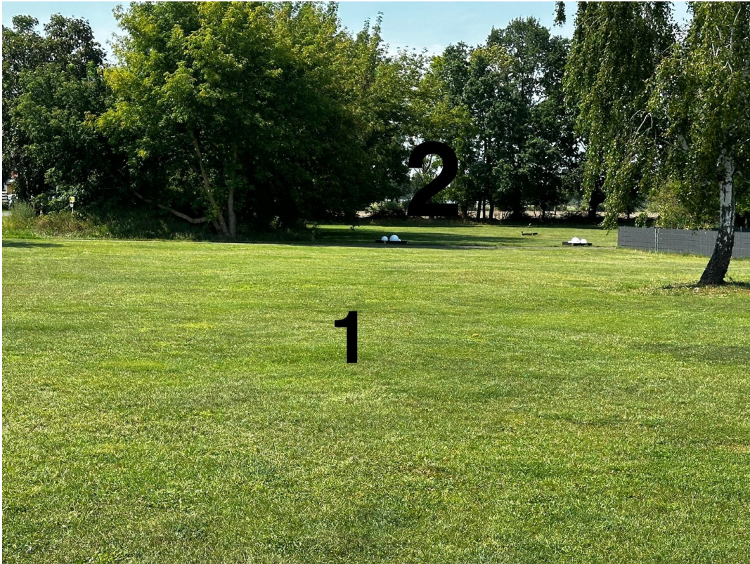
Grdst 1 Blick Richtung Westen