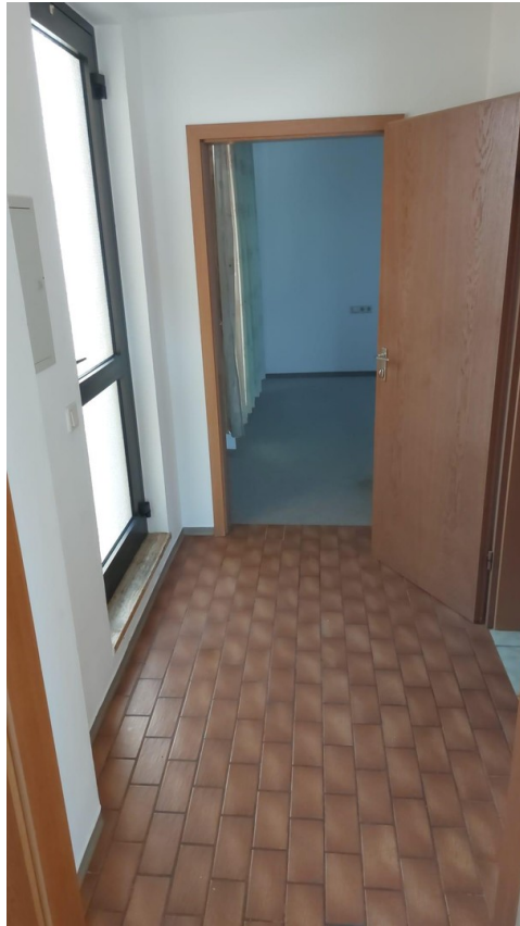
Flur in Richtung Schlafzimmer