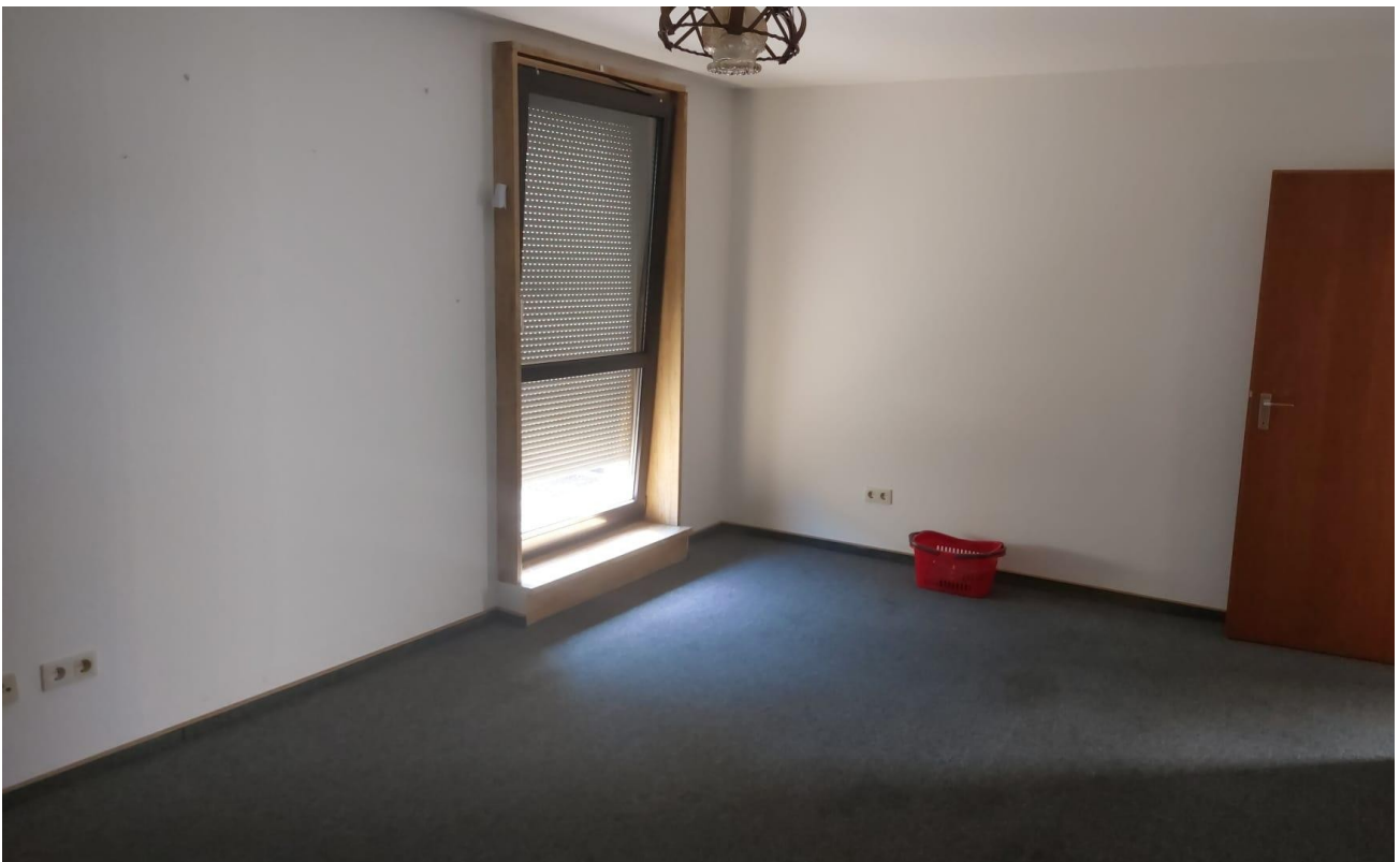
Wohnzimmer Bild 2