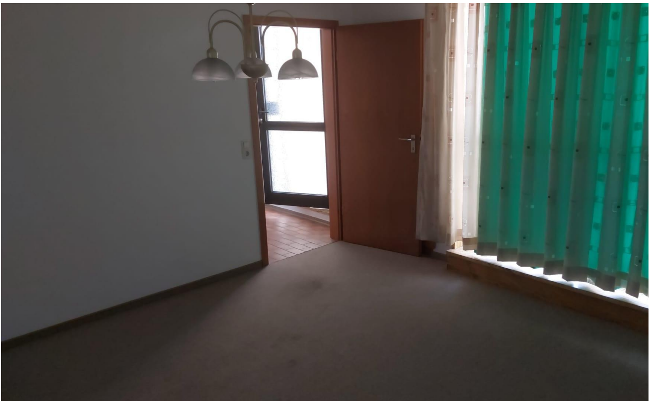
Schlafzimmer Bild 3