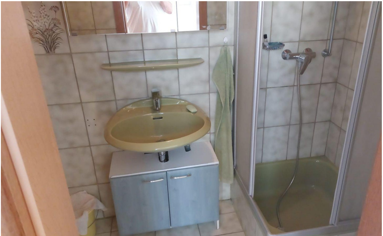
Badezimmer Bild 3