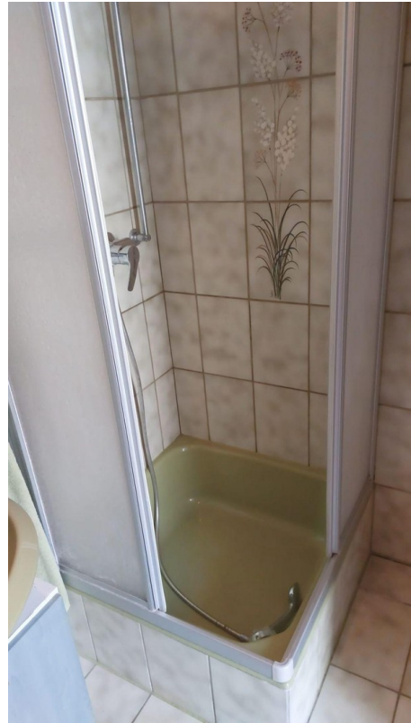
Badezimmer Bild 2