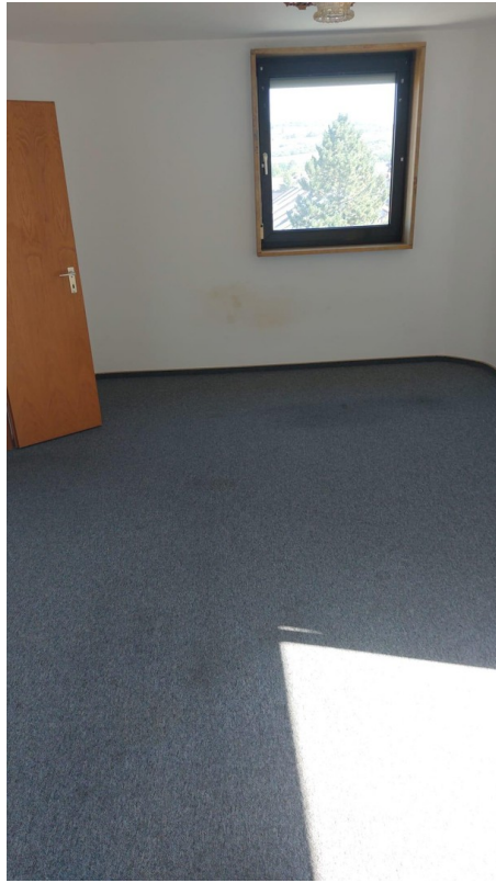
Wohnzimmer Bild 3