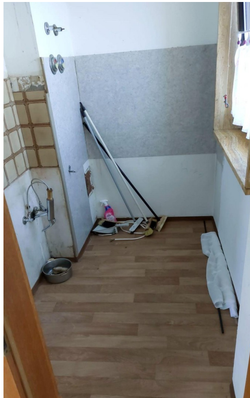
Küche Bild 1