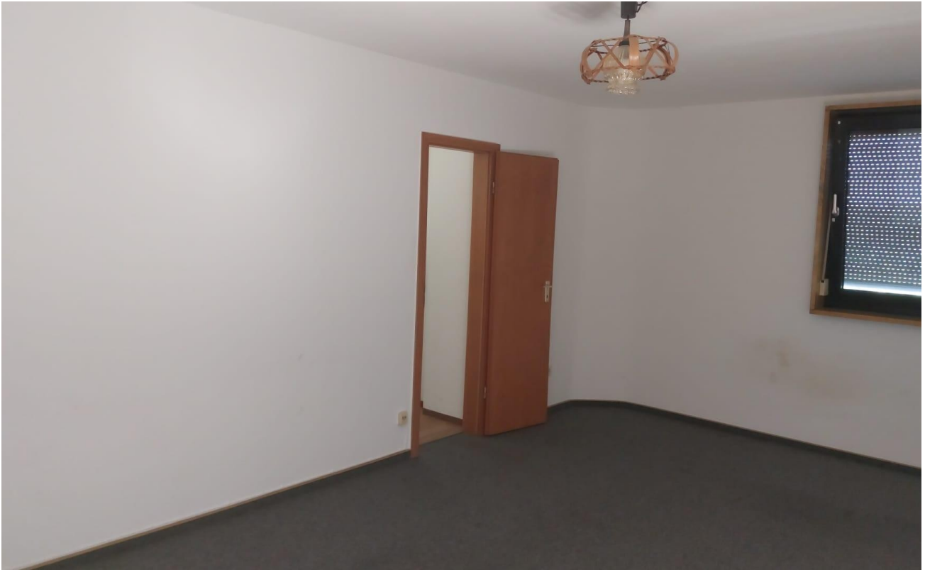
Wohnzimmer Bild 1