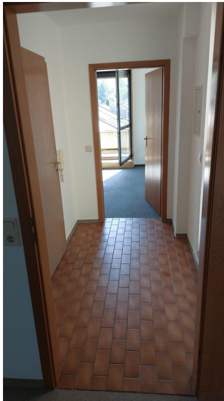
Flur in Richtung Wohnzimmer