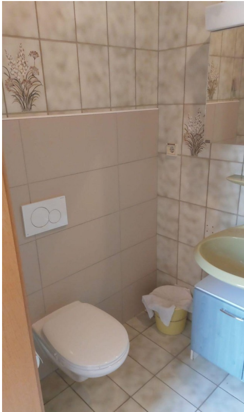
Badezimmer Bild 1