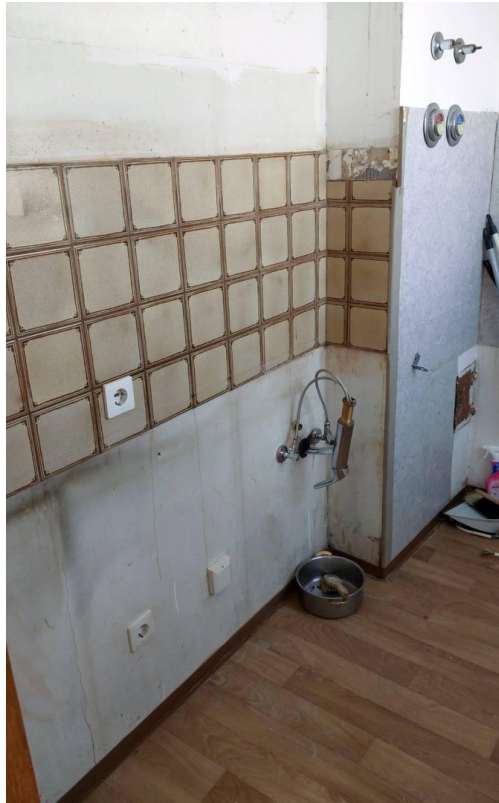
Küche Bild 2