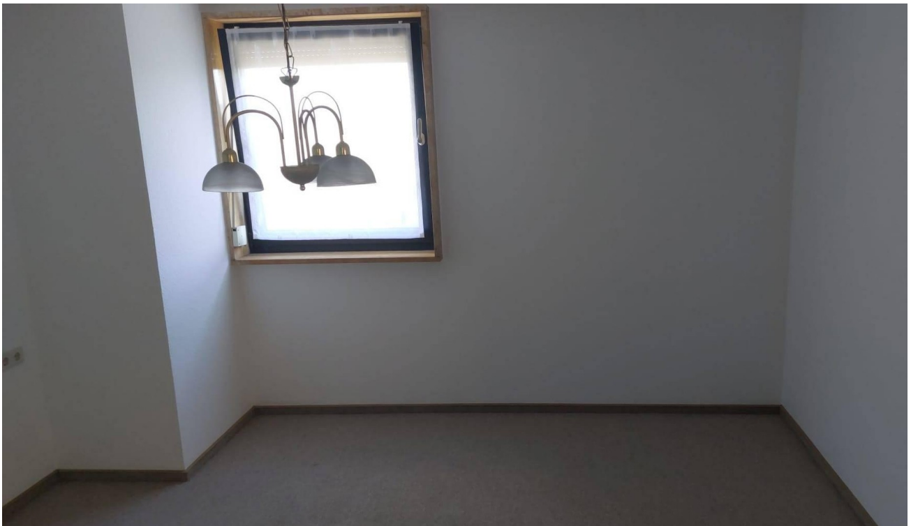
Schlafzimmer Bild 1