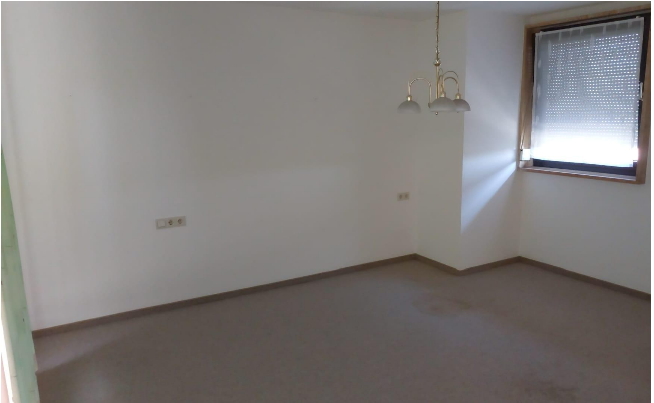
Schlafzimmer Bild 2