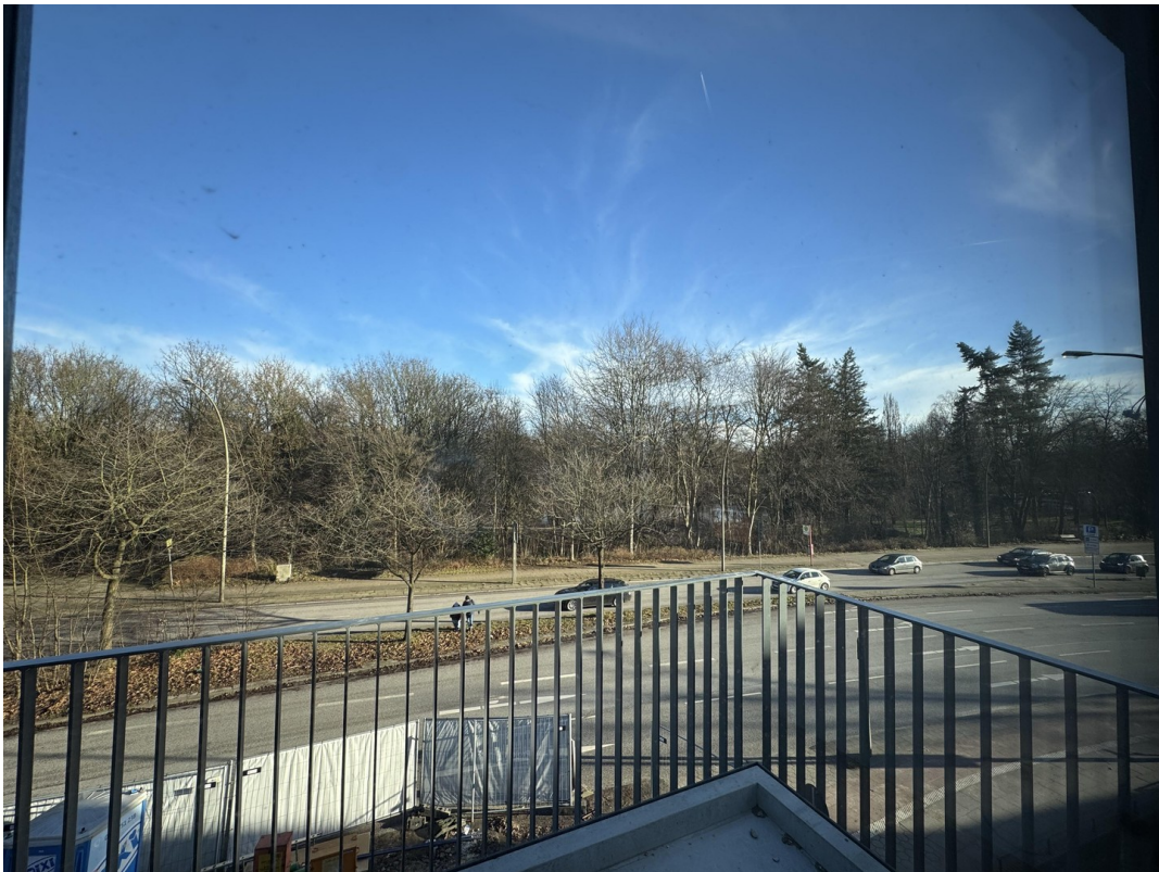
Blick aus dem Balkon auf die A