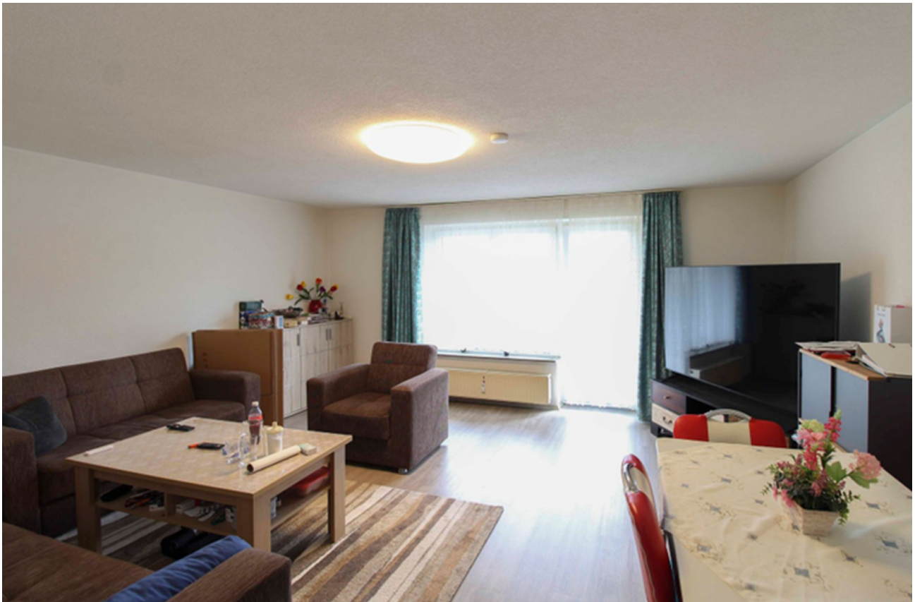
Wohnzimmer von aussen