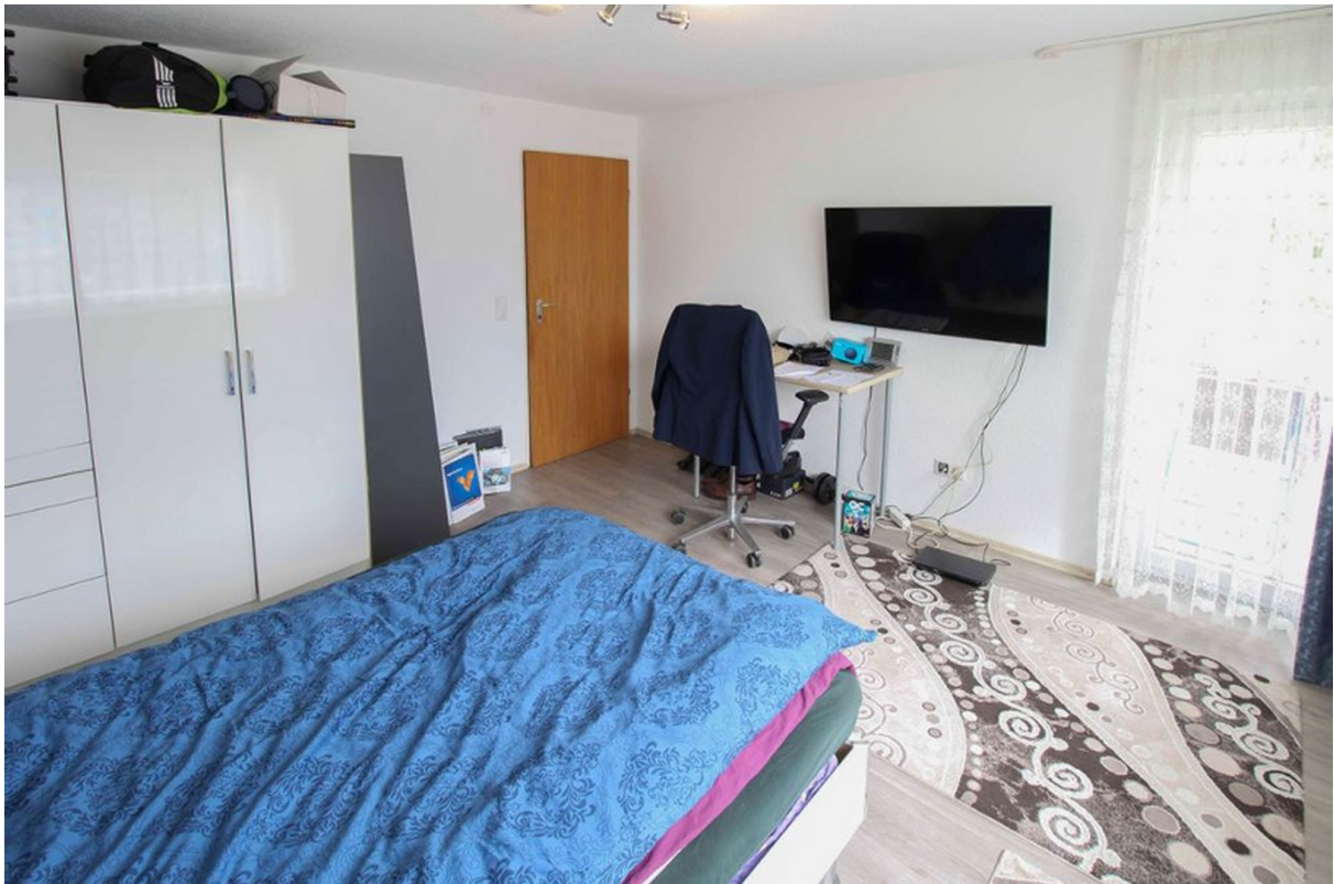
Kinderzimmer von innen