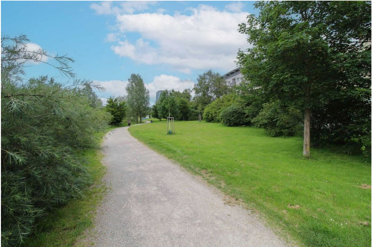
Park direkt neben der Wohnung