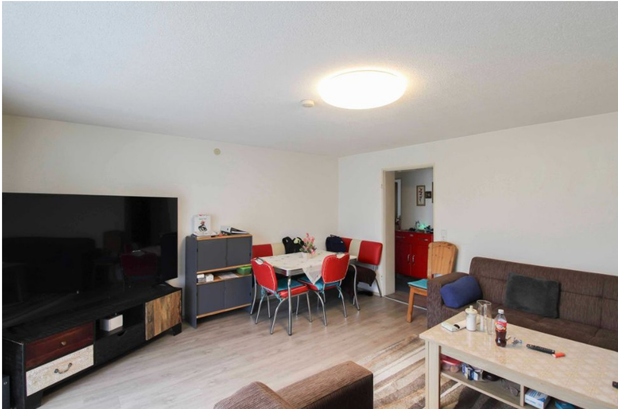
Wohnzimmer von innen