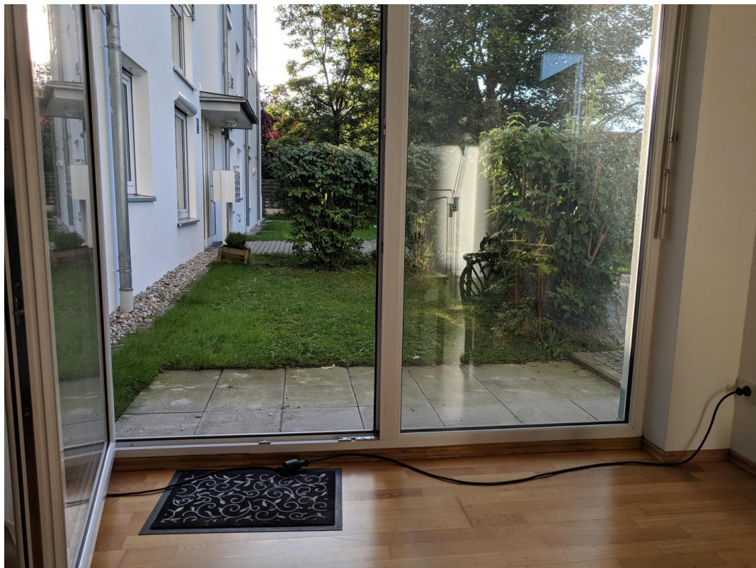
Terrasse / Garten