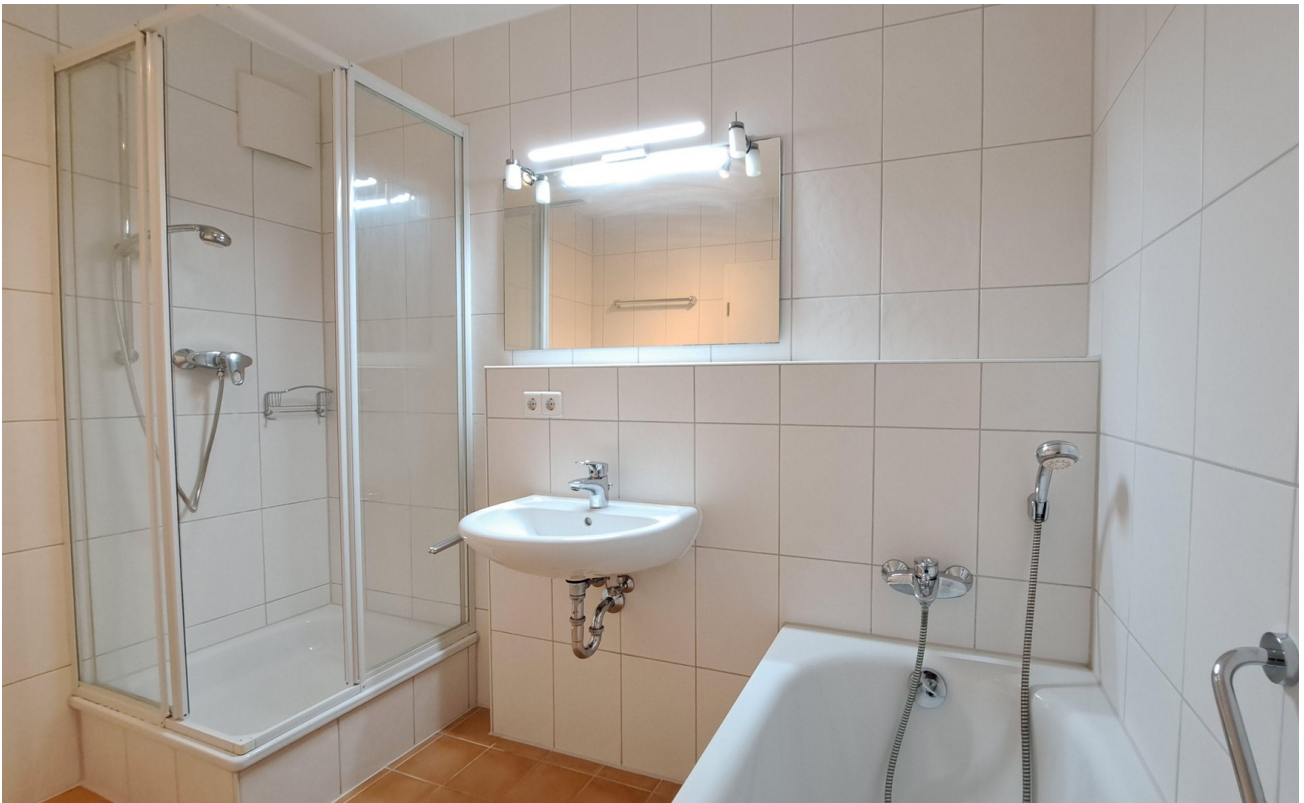
Bad, Dusche und Badewanne